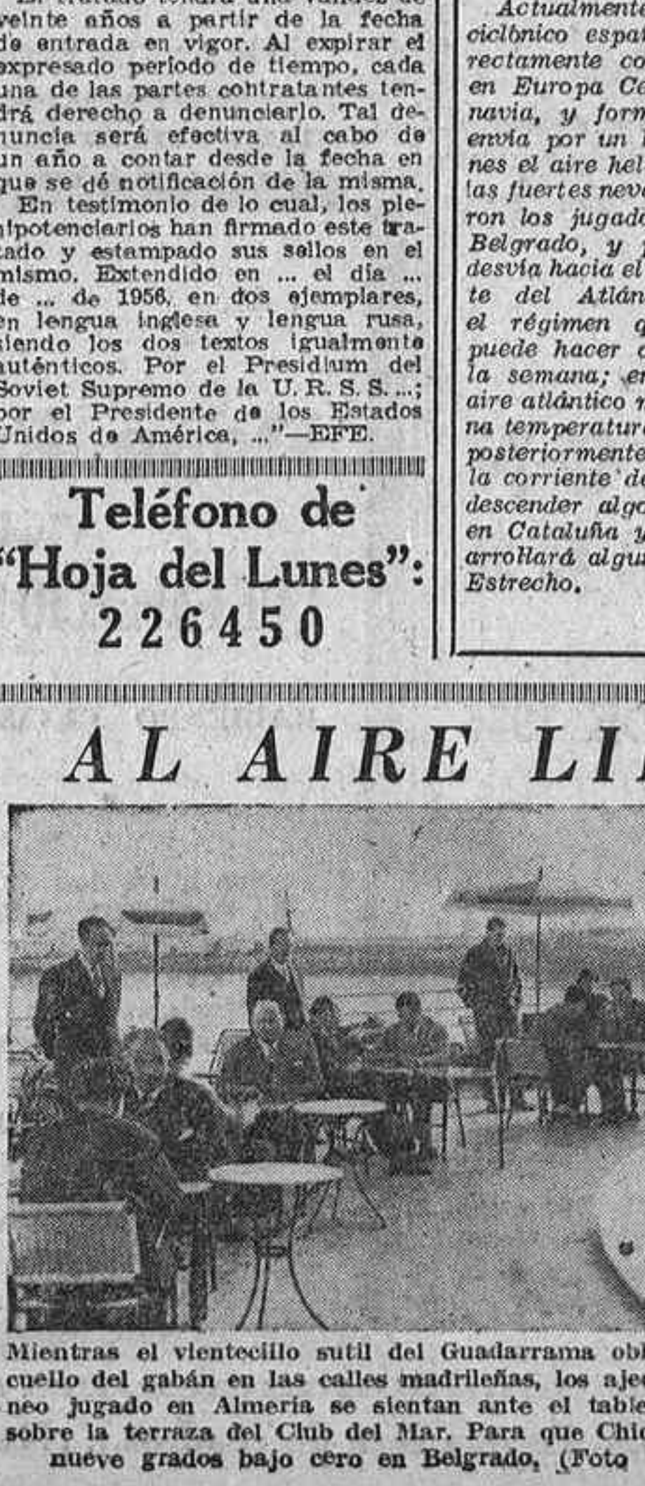
Mientras el venticillo sutil del Guadarrama obliga a subirse el cuello del gaban en las calles madrileñas, los ajejadistas del torneo jugado en Almería se sientan ante el tablero al aire libre, sobre la terraza del Club del Mar. Para que Chicote hable de los nueve grados bajo cero en Belgrado.