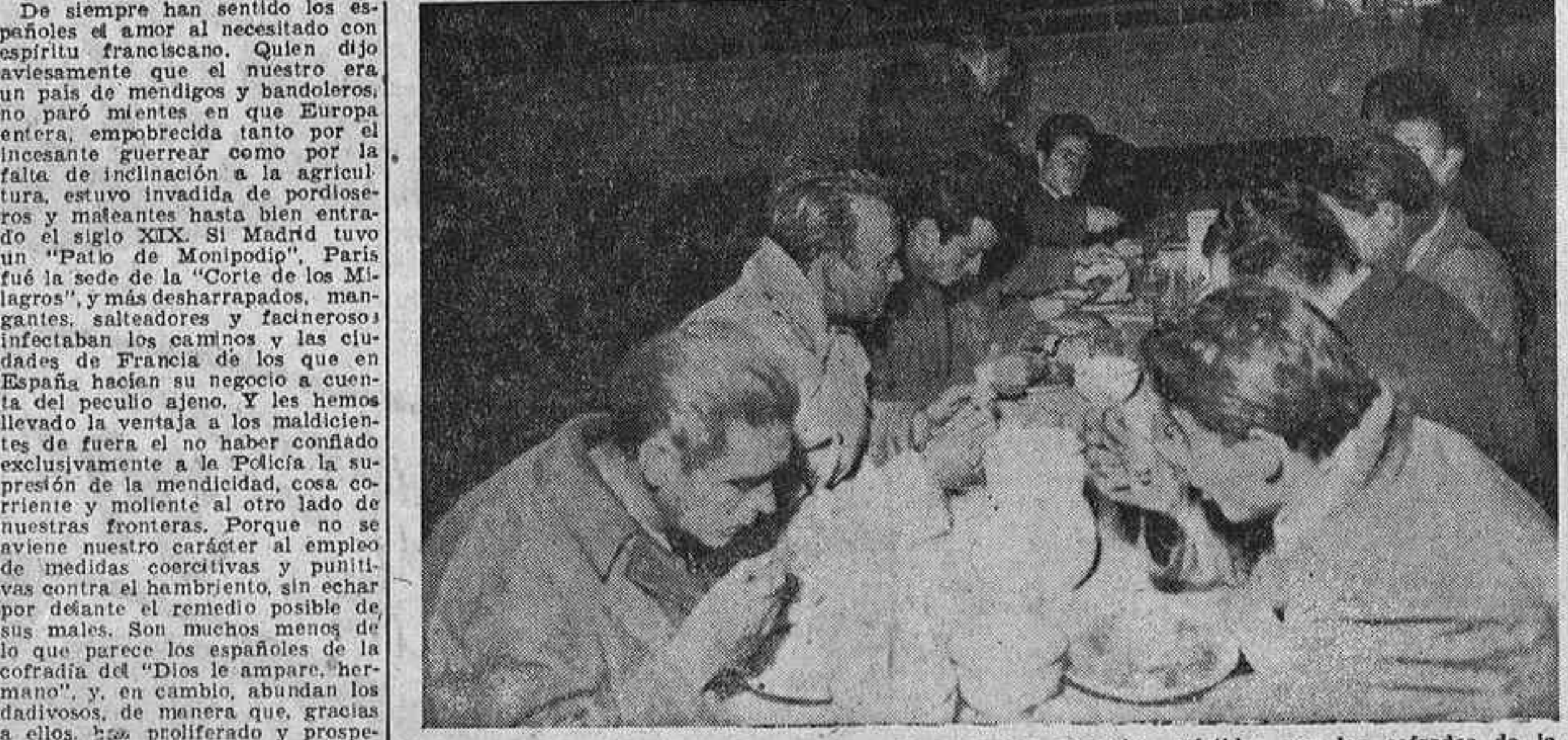
Quiénes nada poseen, hallan puesto a la mesa del Refugio, asistidos por los cofrades de la Hermandad.