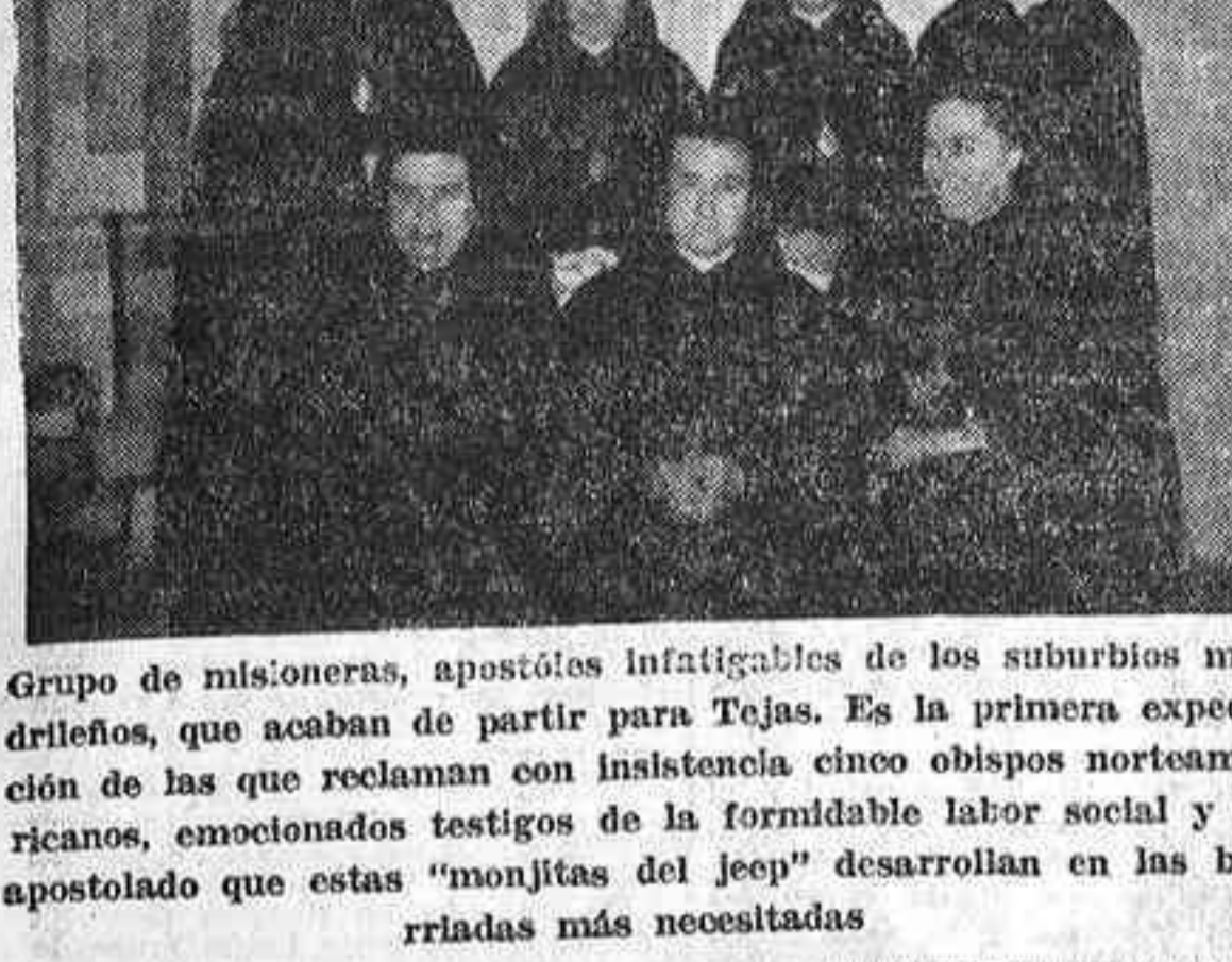
Grupo de misioneras, apostólas infatigables de los suburbios madrileños, que acaban de partir por Tejas. Es la primera expedición de las que reclaman con insistencia cinco obispos norteamericanos, emocionados testigos de la formidable labor social y de apostolado que estas "monjitas del jeep" desarrollan en las barridas más necesitadas