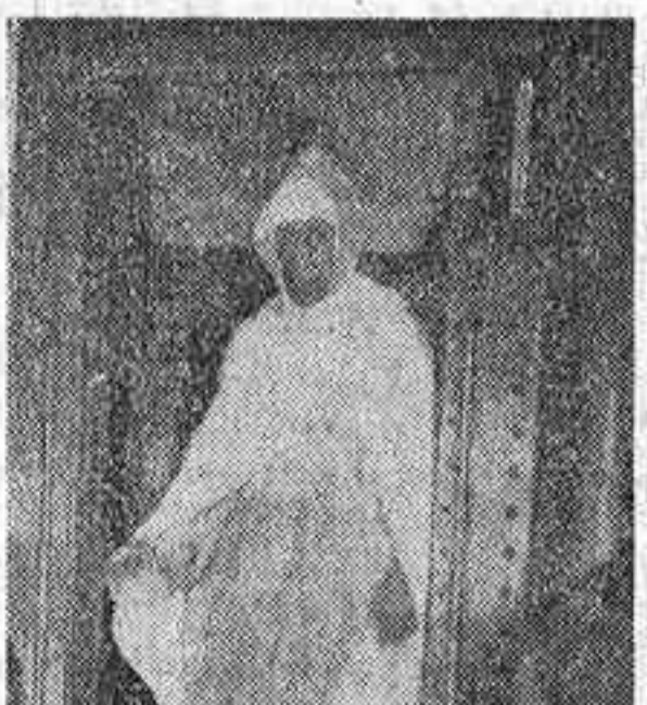
El bajá de Marruecos se halla en estado agónico, según las últimas noticias. A partir de la reciente intervención quirúrgica que sufrió, El Glaui no ha podido salir del estado de máxima prostración, y se teme un rápido y fatal desenlace.