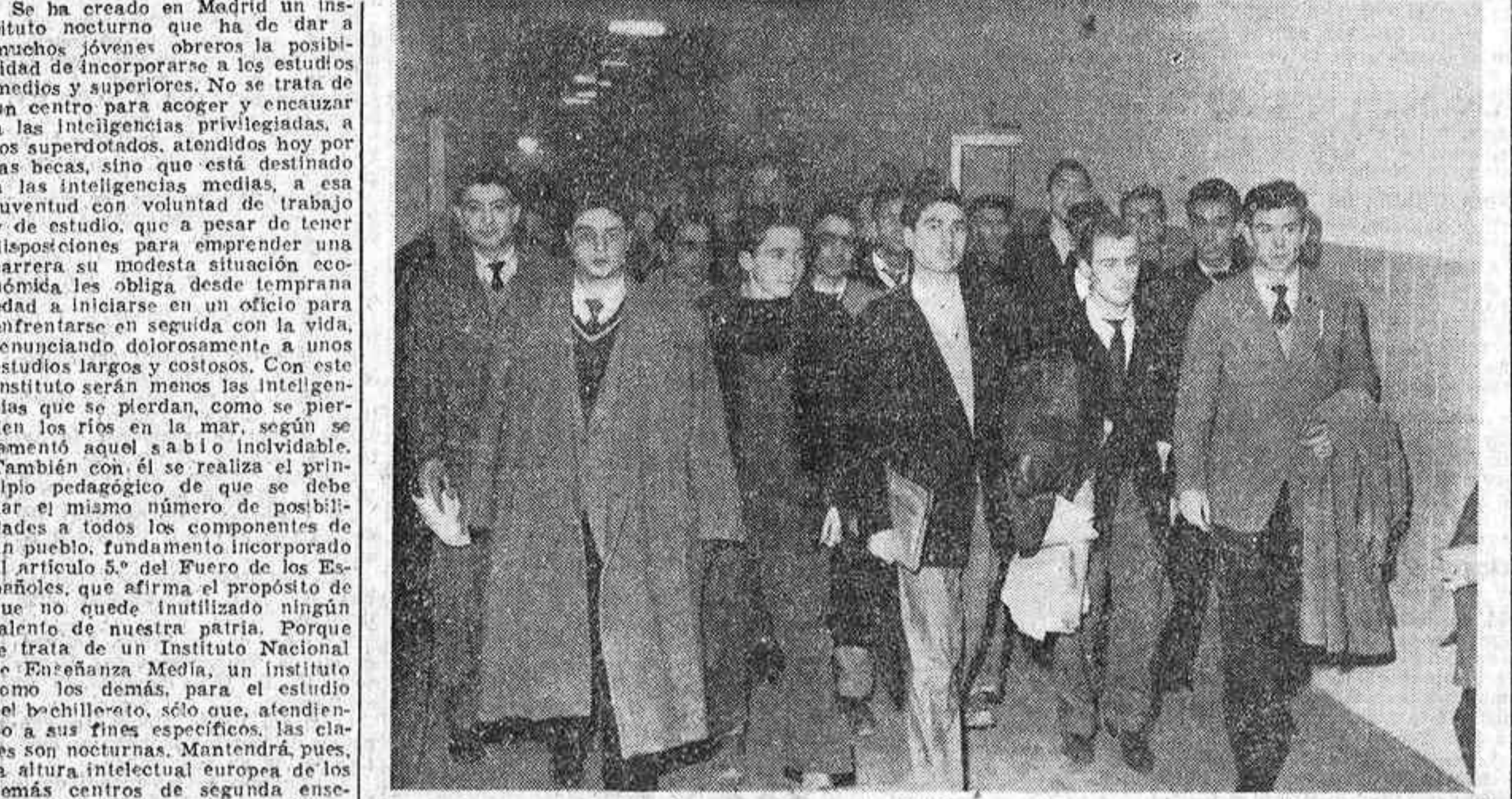
He aquí a un grupo de alumnos, obreros de distintas profesiones, que cursan el bachillerato en el Instituto Nocturno.

TERMINADA LA JORNADA DE TRABAJO, UN SERVICIO DE AUTOBUSES LOS RECOGE DE LAS BARRIADAS POPULARES PARA LAS CLASES Y SE LES PROPORCIONA MERIENDA Y CENA