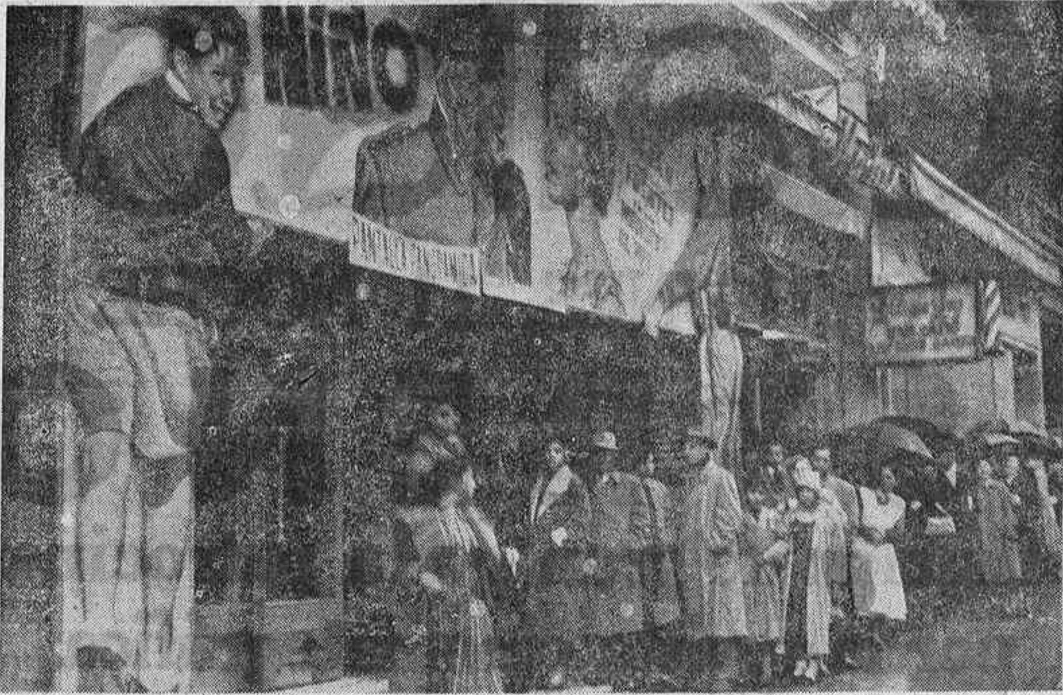
COLAS ANTE EL CINE GRAN VIA PARA VER