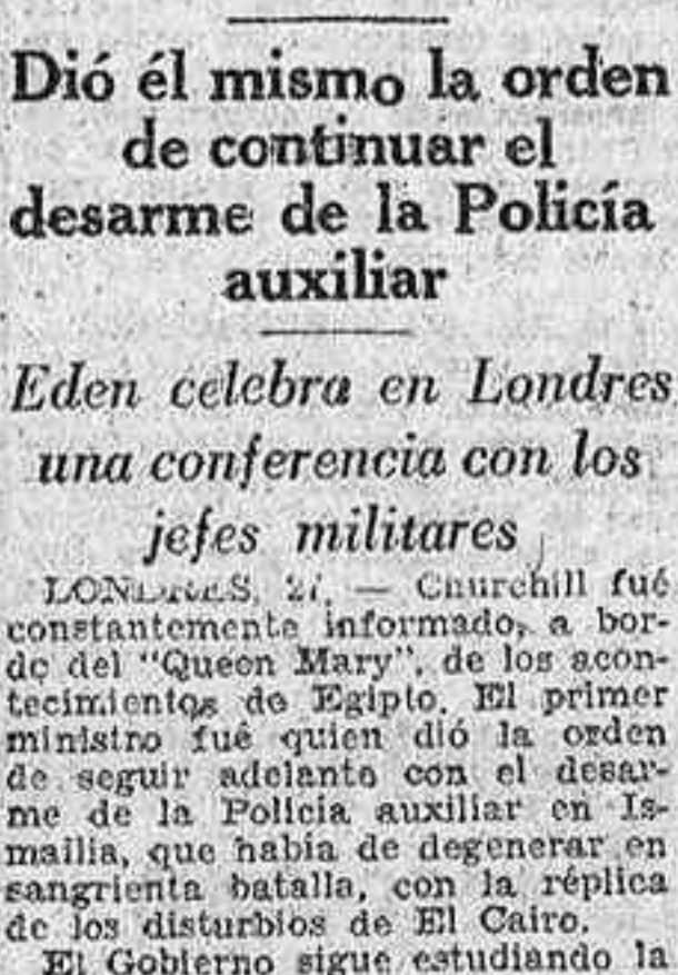
Winston Churchill, informado de los acontecimientos

Dió él mismo el orden de continuar el desarme de la Policía auxiliar