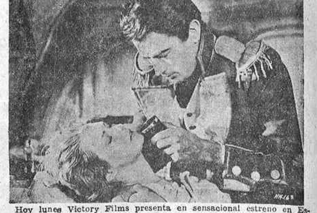
Hoy lunes Victory Films presenta en sensacional estreno en España en los cines Pompeya, Palace y Beatriz "El hidalgo de los mares" ("Capitán Horacio Hornblower"), la cumbre del cine espectacular, en sobrio tecnicolor, con Gregory Peck y Virginia Mayo al frente de un reparto estelar con millares de extras. Las mayores y más fielmente realizadas de cuantas batallas navales aparecieron en la pantalla, la emoción de un argumento excepcional debido a la ilustre pluma de C. S. Forester y una interpretación maravillosa confieren a "El hidalgo de los mares" ("Capitán Horacio Hornblower") esa suprema calidad que es distintivo de Victory Films y de su orgulloso y ambicioso lema: "El mejor cine del mundo, al servicio del público español." Esta película es apta para todos los públicos.