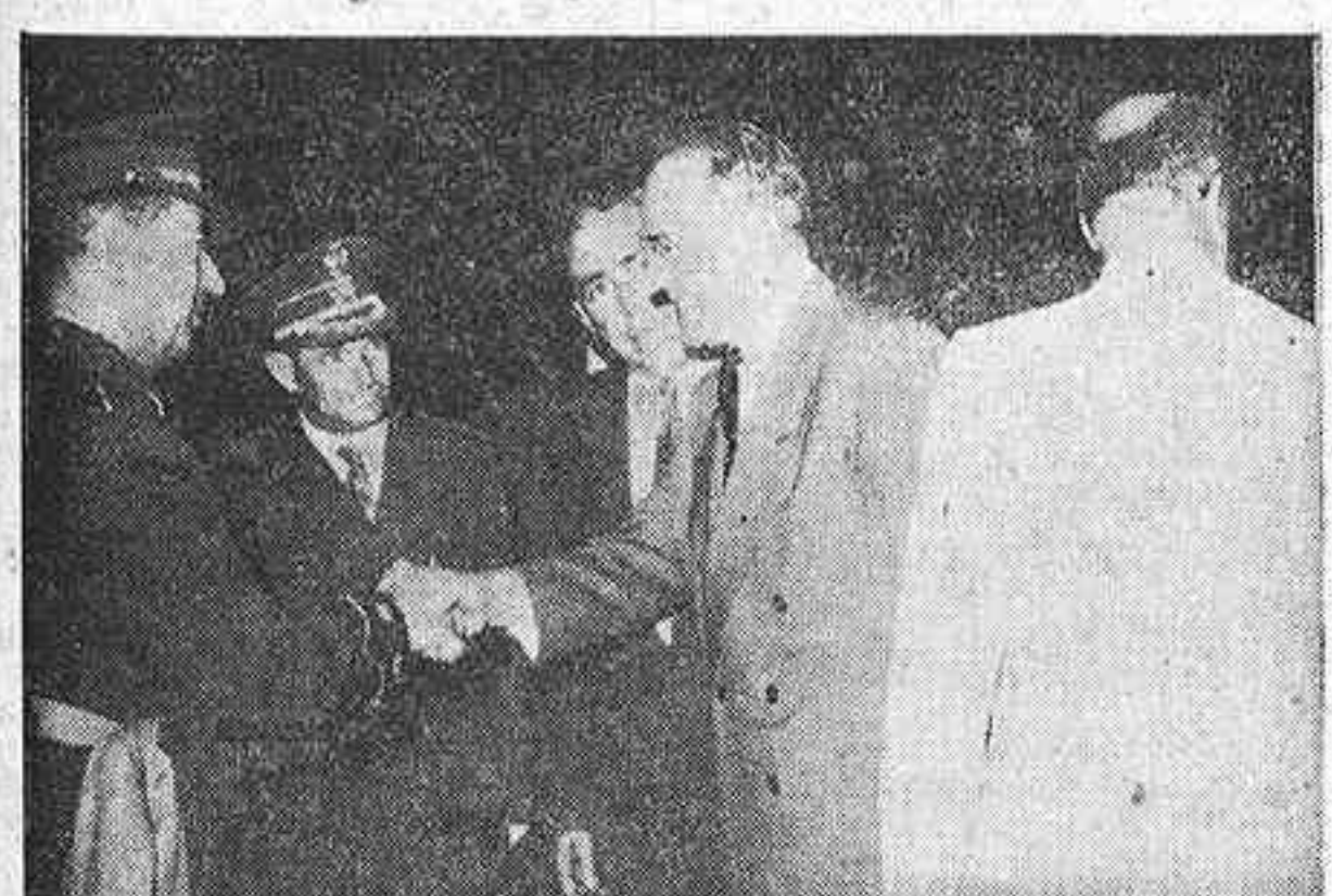
Un momento de la llegada a Barajas del subsecretario del Ejército de los Estados Unidos, Mr. John Sizel, en el que aparecen al subsecretario del Ejército español, general López Valencia, y otras personalidades americanas y españolas dándole la bienvenida al descender del avión.