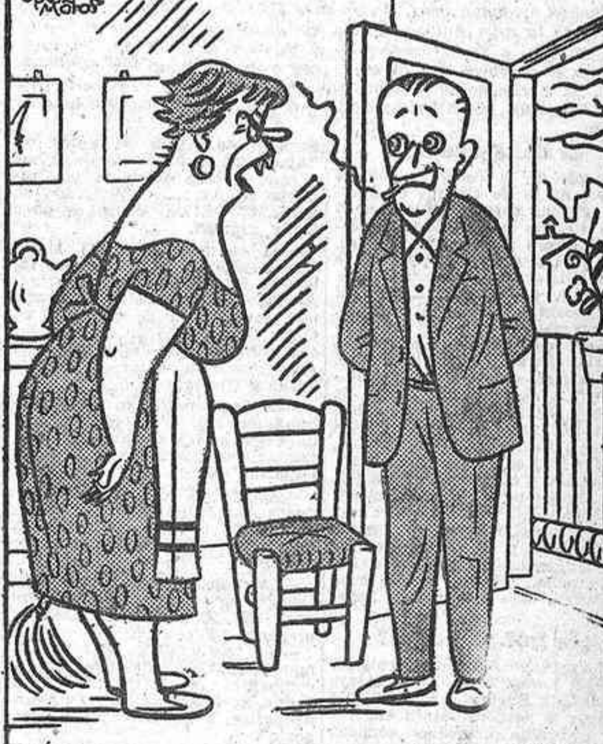
—No valoras lo que tienes en casa; ya sabes que soy prima de la "miss" del barrio.