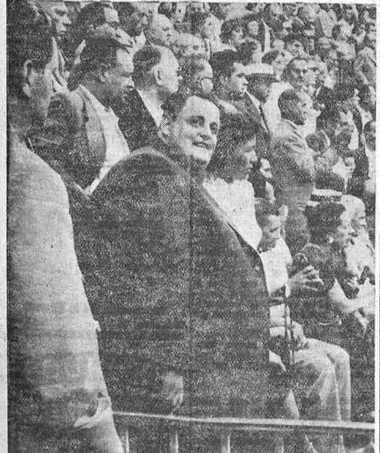
Los hay gordos! ¿Quién se atreverá a regarlo? Ahí tenemos a uno bien afeitado que ayer asistió, tan orondo y satisfecho, a la corrida celebrada en la plaza de las Ventas. Lo que no sabemos es si se aciaría una localidad o dos; porque dudamos, ¡a la vista está!, de que cupiera en una sola.