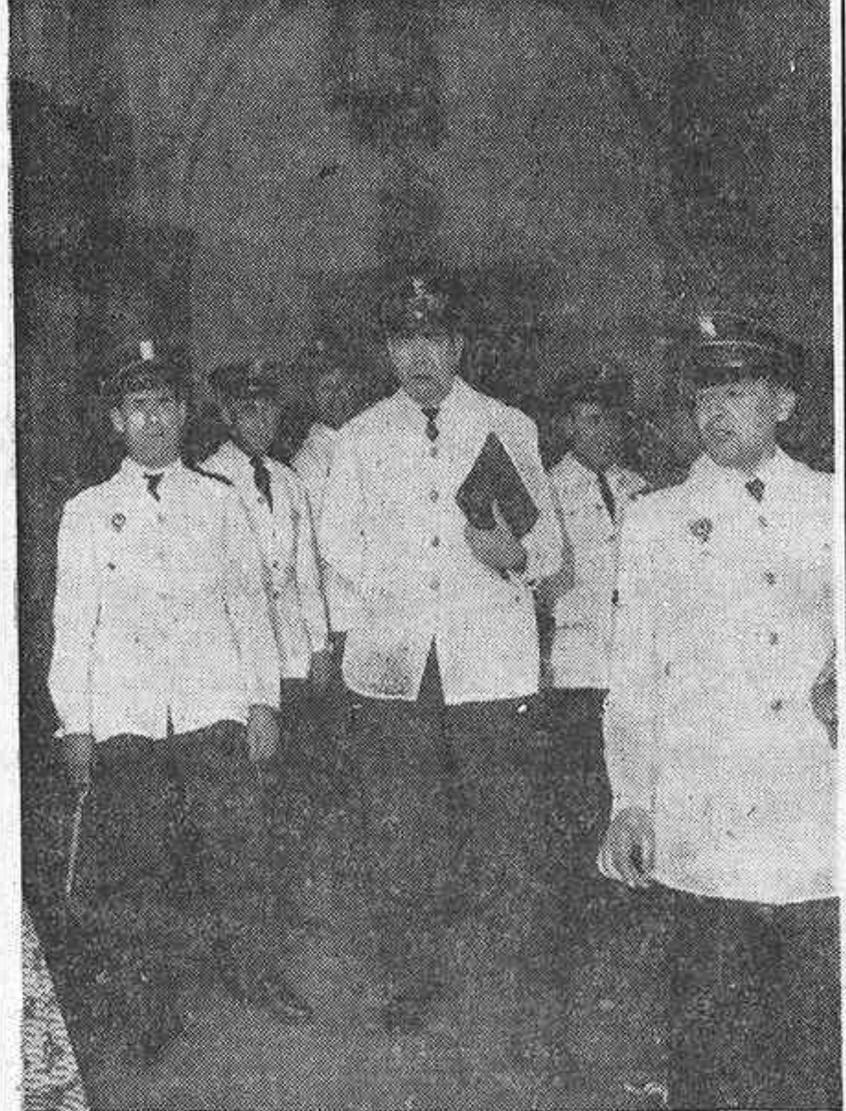
Bien vestidos y bien plantados, nada recuerda en estos agentes de la Policía Urbana de hoy a la pareja de guardias que, con andar cansino, daba una vuelta a la manzana en "La verbena de la Paloma".

EL RESTO ES INSUFICIENTE PARA CUBRIR LAS EXIGENCIAS DE LA POLICIA URBANA