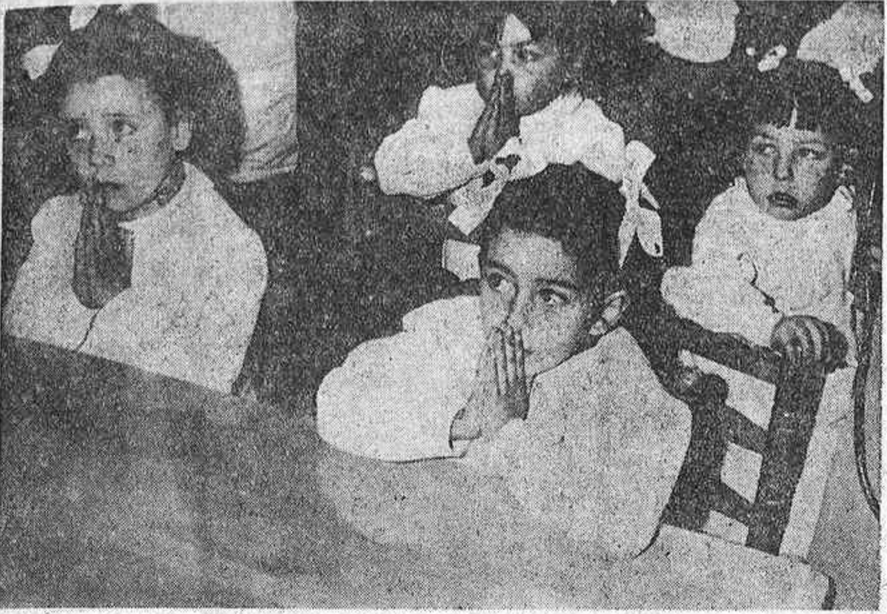
Terminada la clase, todavía con su blanco vestido escolar, hacen su oración las niñas de un grupo escolar que mañana inaugura el curso.