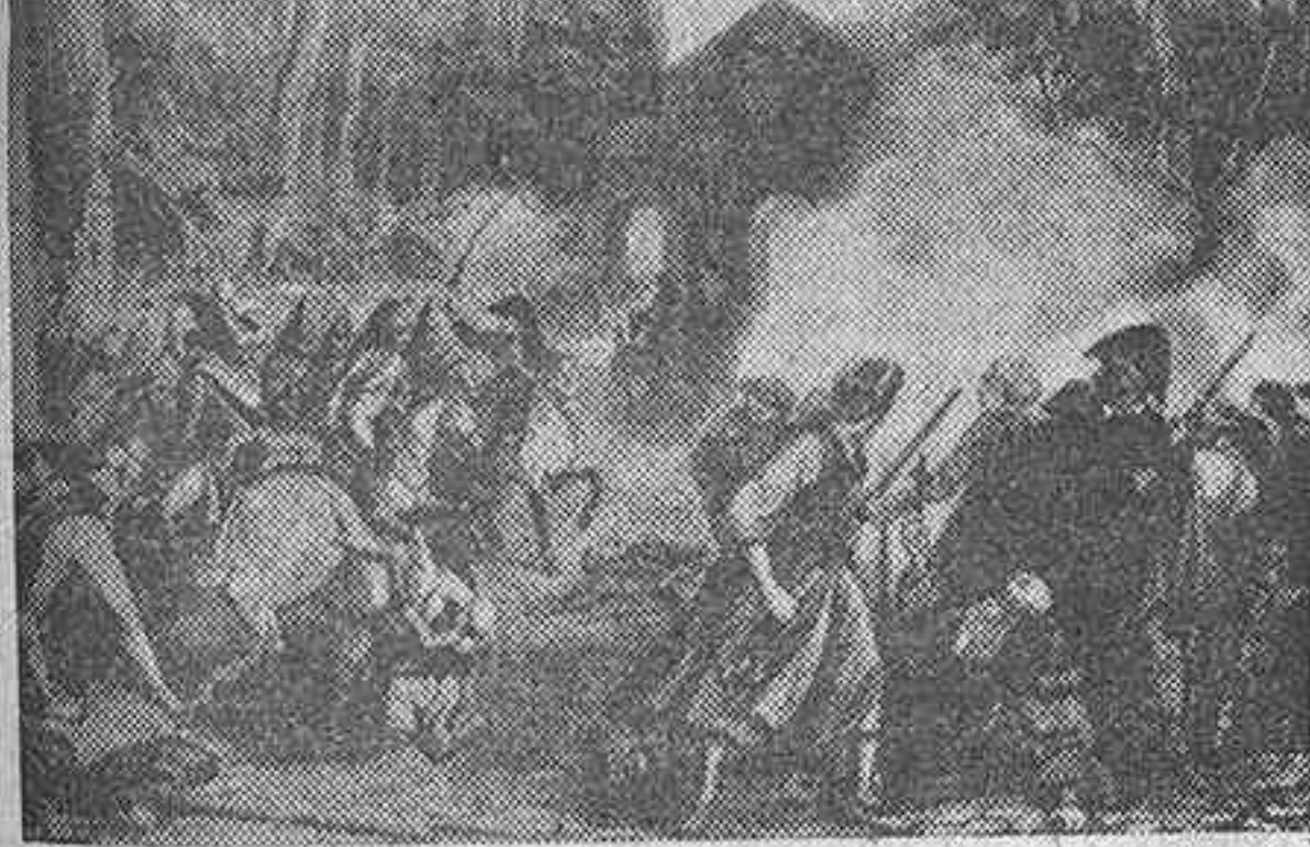
Este viejo y magnífico grabado, que se conserva en el Museo Municipal de Madrid, refleja lo que fue la gloriosa jornada del 2 de mayo de 1808: el pueblo, sin distinción de clases, de edades ni de estados, alzado en armas contra el invasor