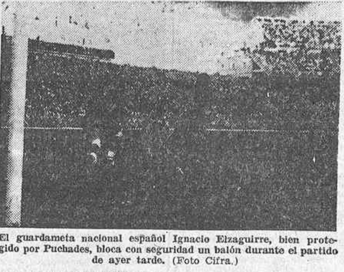
El guardameta nacional español Ignacio Elizaguirre, bien protegido por Puchades, bloca con seguridad un balón durante el partido de ayer tarde.