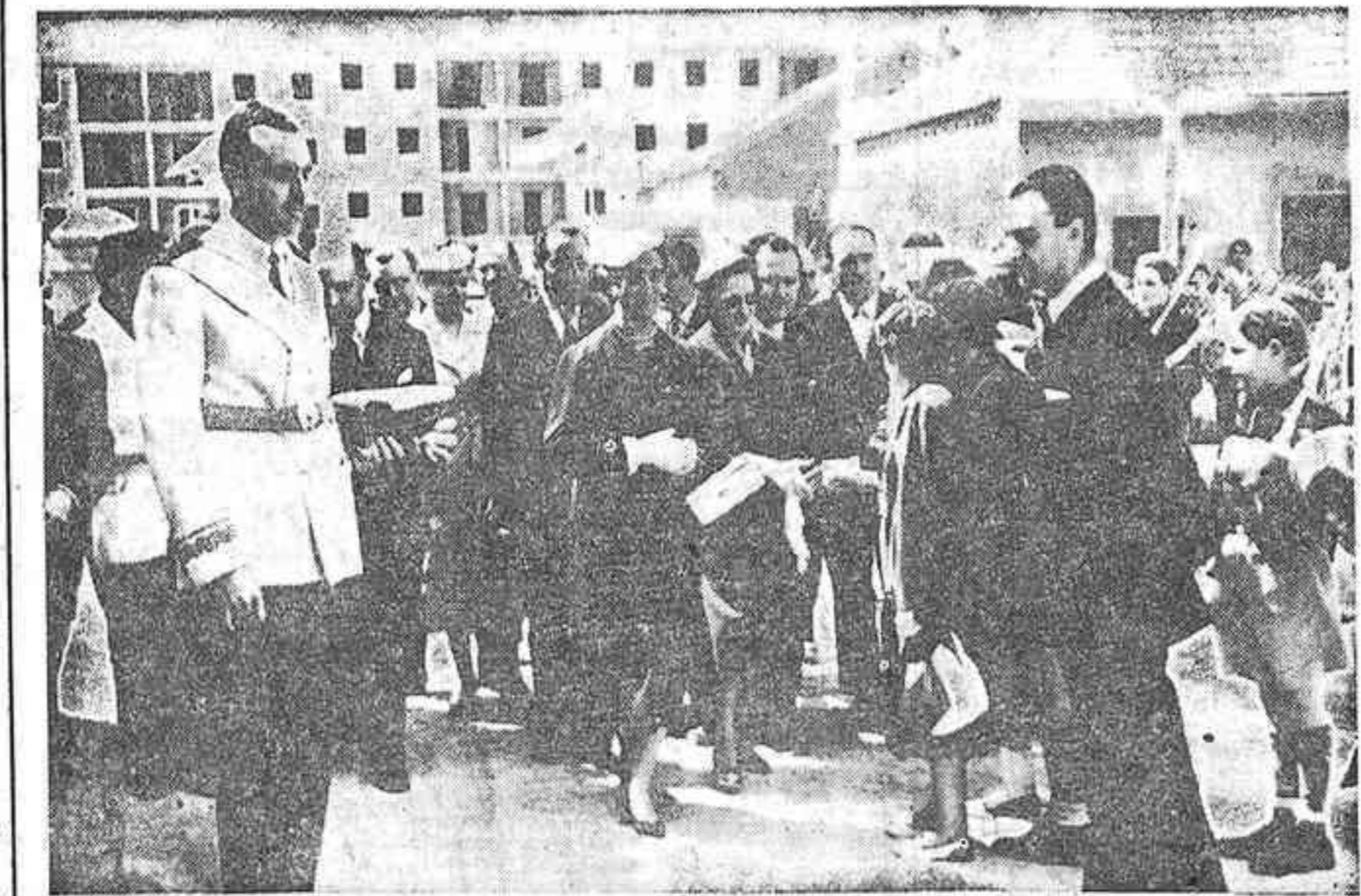
Doña Carmen Polo de Franco, acompañada por las autoridades, a su llegada a uno de los grupos escolares que el Ayuntamiento y el ministerio de Educación han instalado en las barriadas de Carabanchel y Canillas.

PARIS FERIA DE MUESTRAS 14 al 30 de mayo