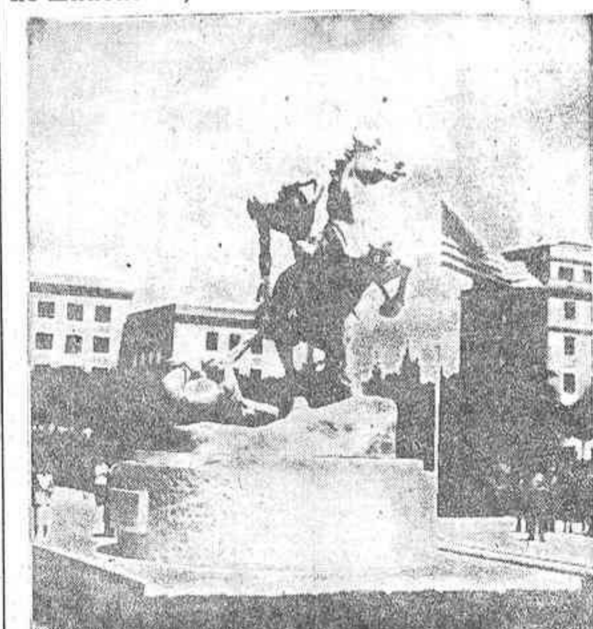
"Los portadores de la antorcha", el grupo escultórico regalado por la señora Huntington a la Ciudad Universitaria de Madrid.

Presidió el acto la esposa del Caudillo, acompañada de los ministros de Educación, A. Exteriores y Justicia y el embajador norteamericano