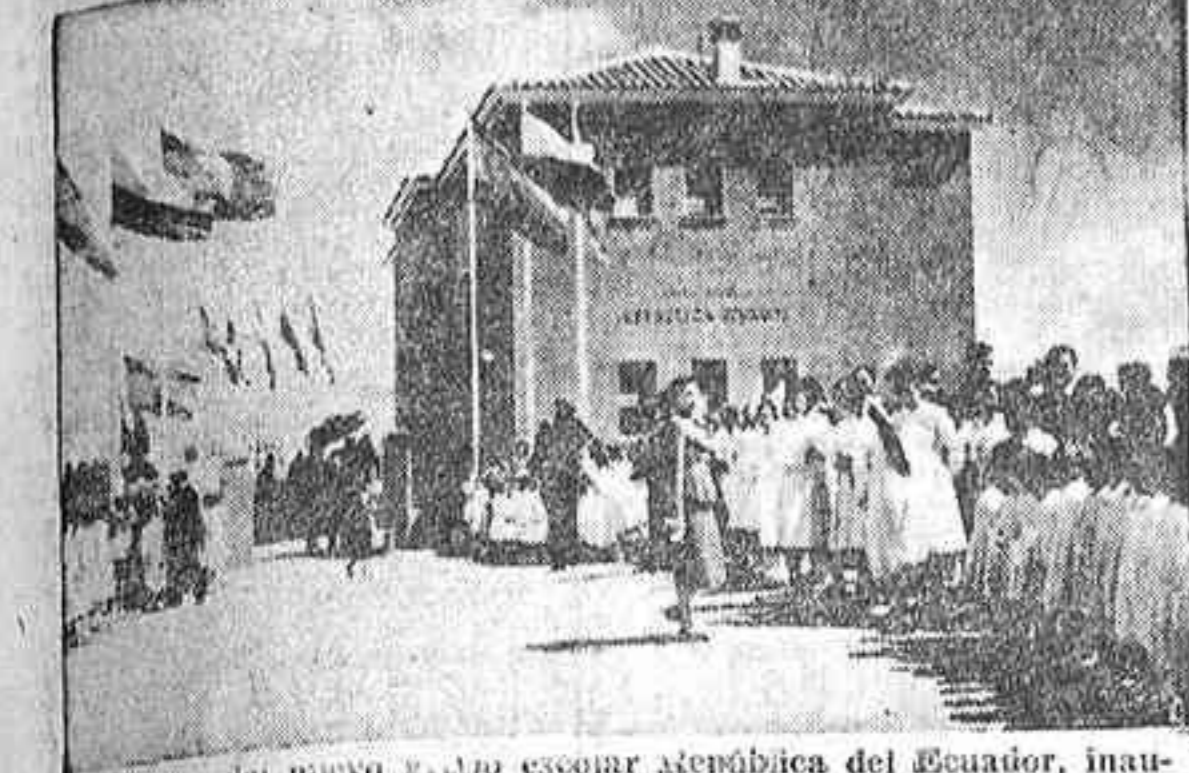
En el aspecto del nuevo grupo escolar municipal del Ecuador, inaugurado ayer en Madrid por el Ayuntamiento en Carabanchel Bajo. La foto recoge el momento en que la población escolar espera la llegada de la esposa del Caudillo y las autoridades.

Asistieron a dichos actos el alcalde, los embajadores de Ecuador y Perú y otras autoridades