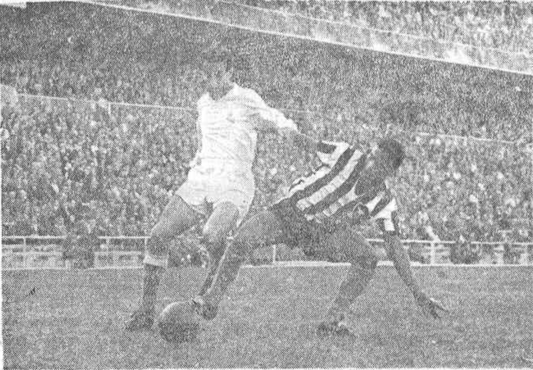
La rapidez y habilidad del extremo de color Sarrincha fueron la causa de que la defensa Lesmes tuviera que trabajar de firme para evitar sus continuas internadas, obstaculizando la labor del brasileño a base de desplazarlo en algunas ocasiones con su cuerpo o cortando con energía sus avances.