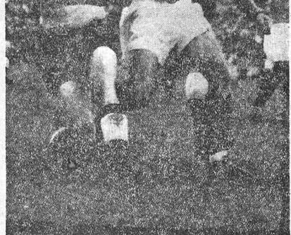
Ayer, en el viejo estadio de Colombes, el equipo nacional francés venció al de Inglaterra, que será nuestro adversario de pasado mañana, por un tanto a cero, marcado, de penalty, por el famoso Kopa, que tan destacada actuación tuvo en Chamartin. La foto recoge el momento en que el defensa Byrne corta, sin demasiadas contemplaciones, un avance del igualmente polaco, naturalizado francés, Glovacki.

El dominio correspondió a los ingleses en los primeros momentos, pero fueron incapaces de marcar gracias a la magnífica actuación