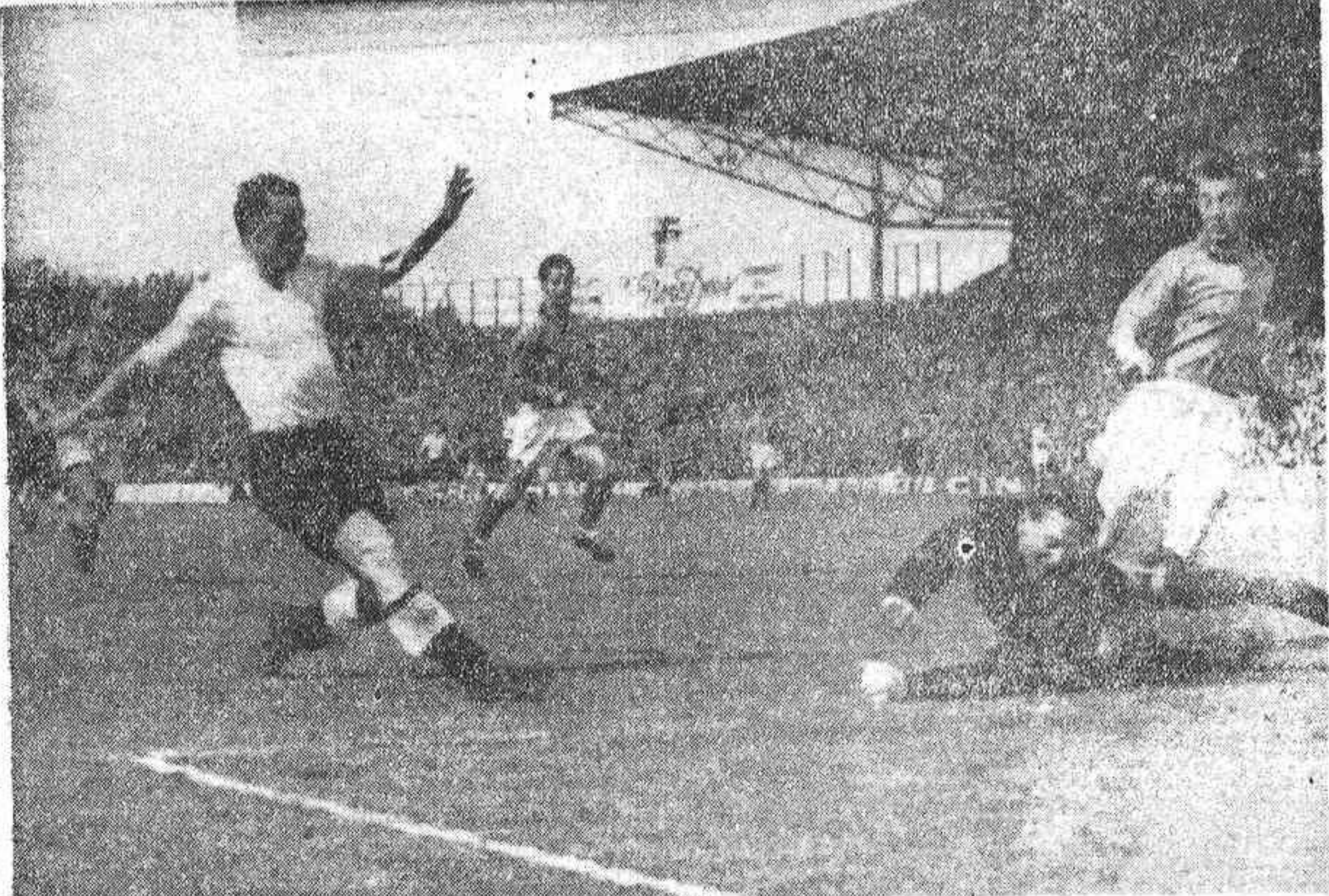
El centro delantero inglés Lafthouse remata a gol, salvando la salida del portero francés Remetter, pero el tanto será anulado por fuera de juego, jugada que en la foto no se aprecia con mucha claridad. (Telefoto Cifra).

Francia triunfó por un penalty, que, naturalmente, cuenta siempre. Pero la victoria francesa es merecida, porque sus jugadores actuaron mejor que sus contrarios. Resultaron más veloces y se acomodaron mejor al terreno. El conjunto ha sido excelente y es difícil destacar a ninguno.