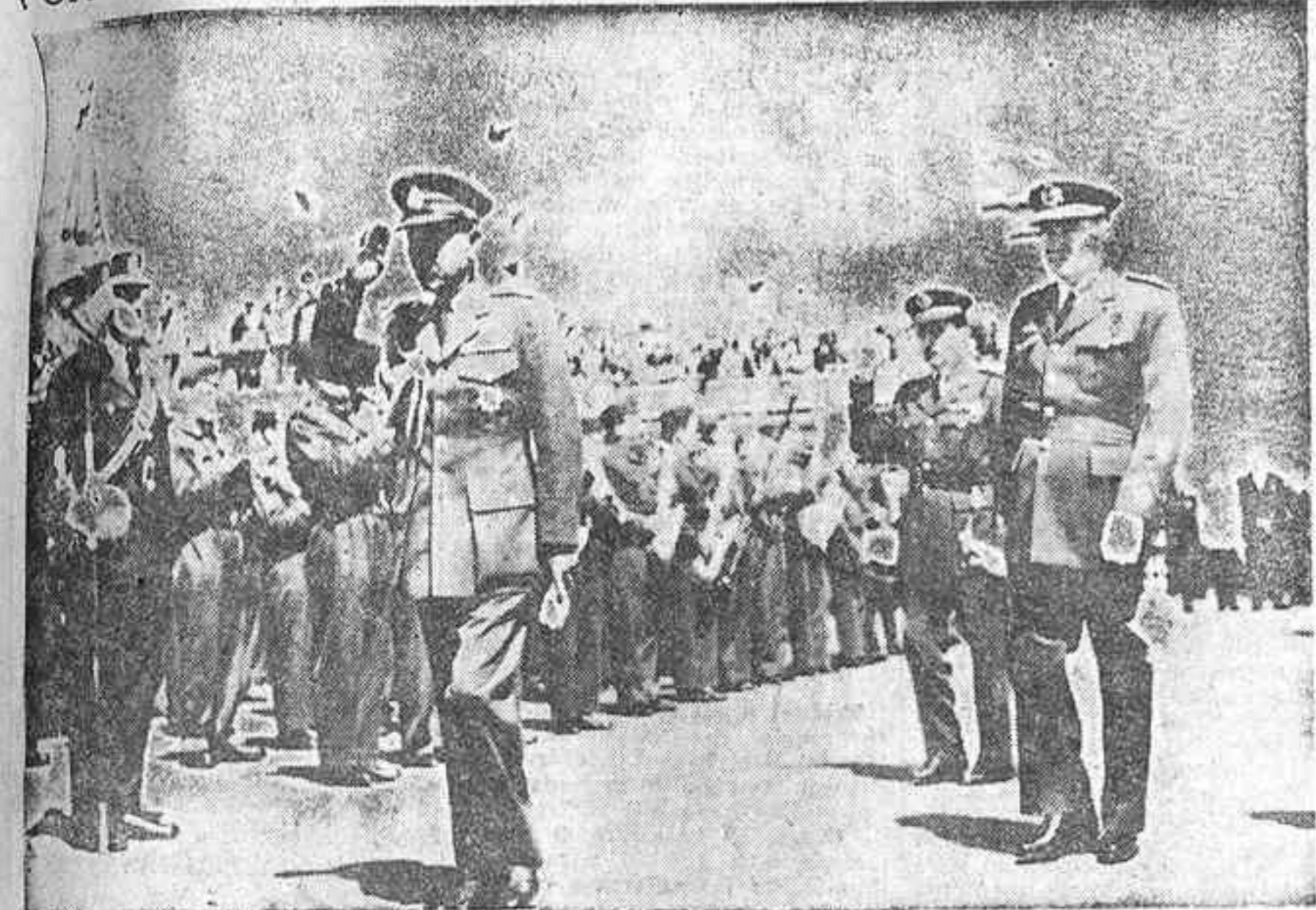
El mariscal Pibulsonggram, en unión del ministro del Aire, teniente general González Gallarza, pasa revista a las tropas que le rindieron honores a su llegada al aeropuerto madrileño.

POR LA TARDE ASISTIO A LA CORRIDA DE TOROS