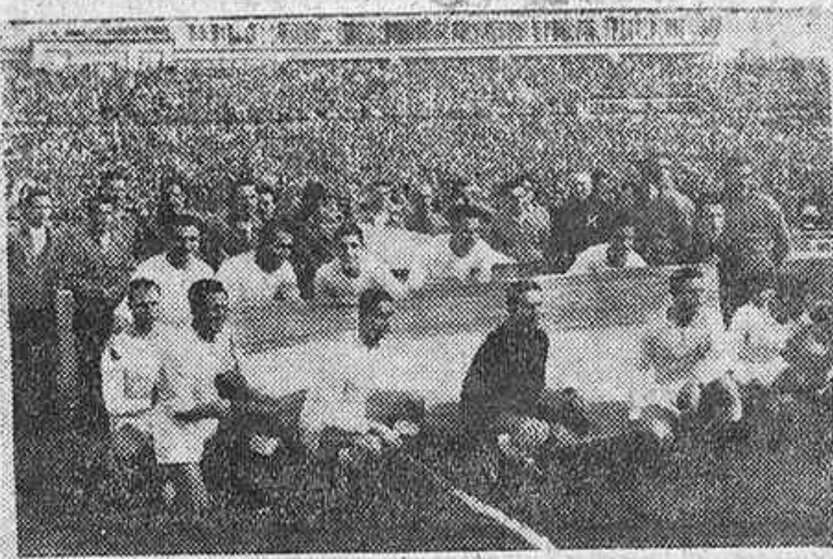
Antes de dar comienzo el partido celebrado ayer en Chamartín, en el que el conjunto argentino del River Plate venció al del Madrid por cuatro tantos a tres, posan ante los fotógrafos los componentes de ambos equipos exhibiendo las banderas de los países.