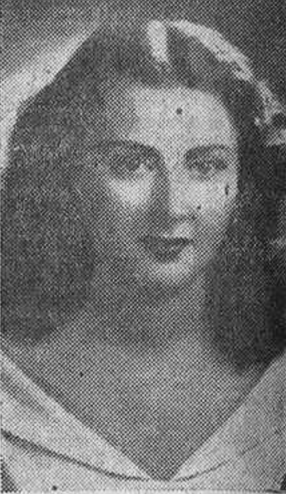
La bellísima artista Paquita Gallego, primera figura de la revista musical española, que ha logrado reunir, al servicio de un arte depurado, las excepcionales calidades de la excelente actriz y de la magnífica cantante