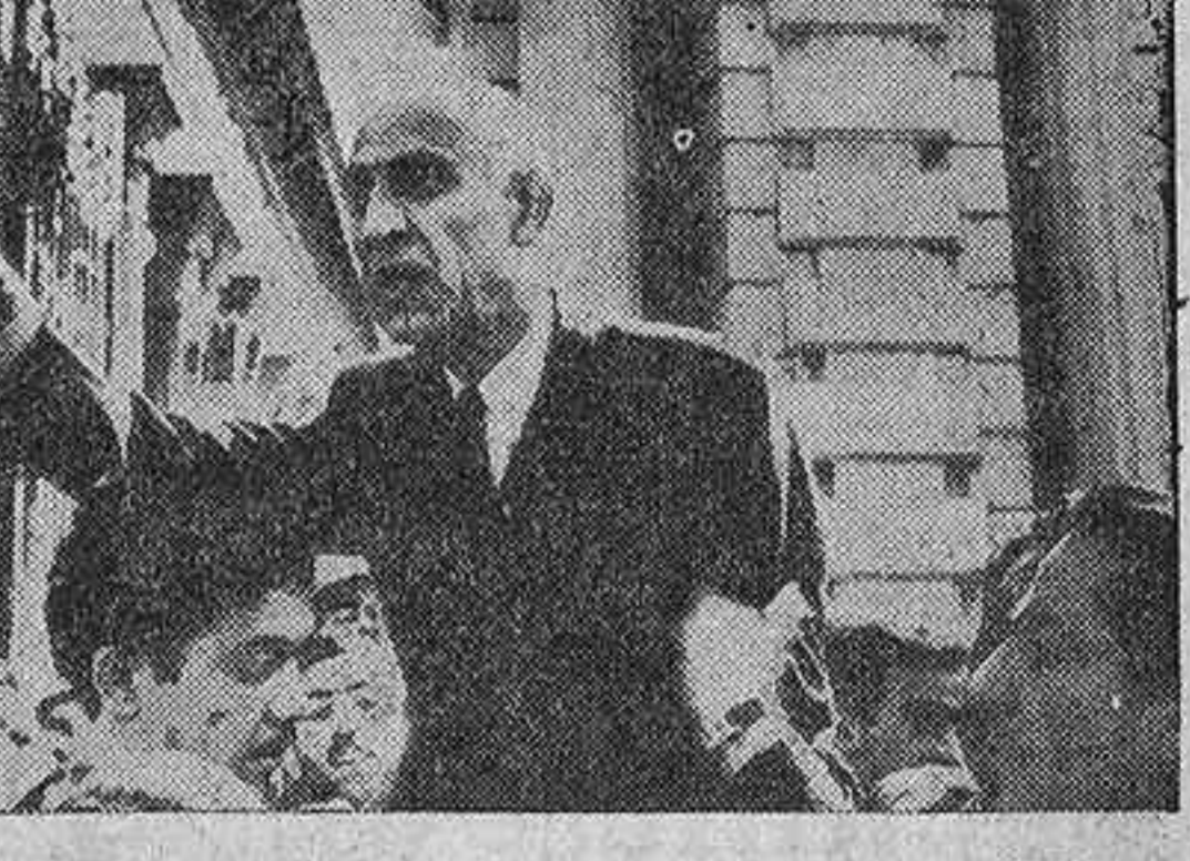
Ayer salió para Nueva York, con objeto de asistir a las deliberaciones del Consejo de Seguridad sobre la cuestión del petróleo persa...