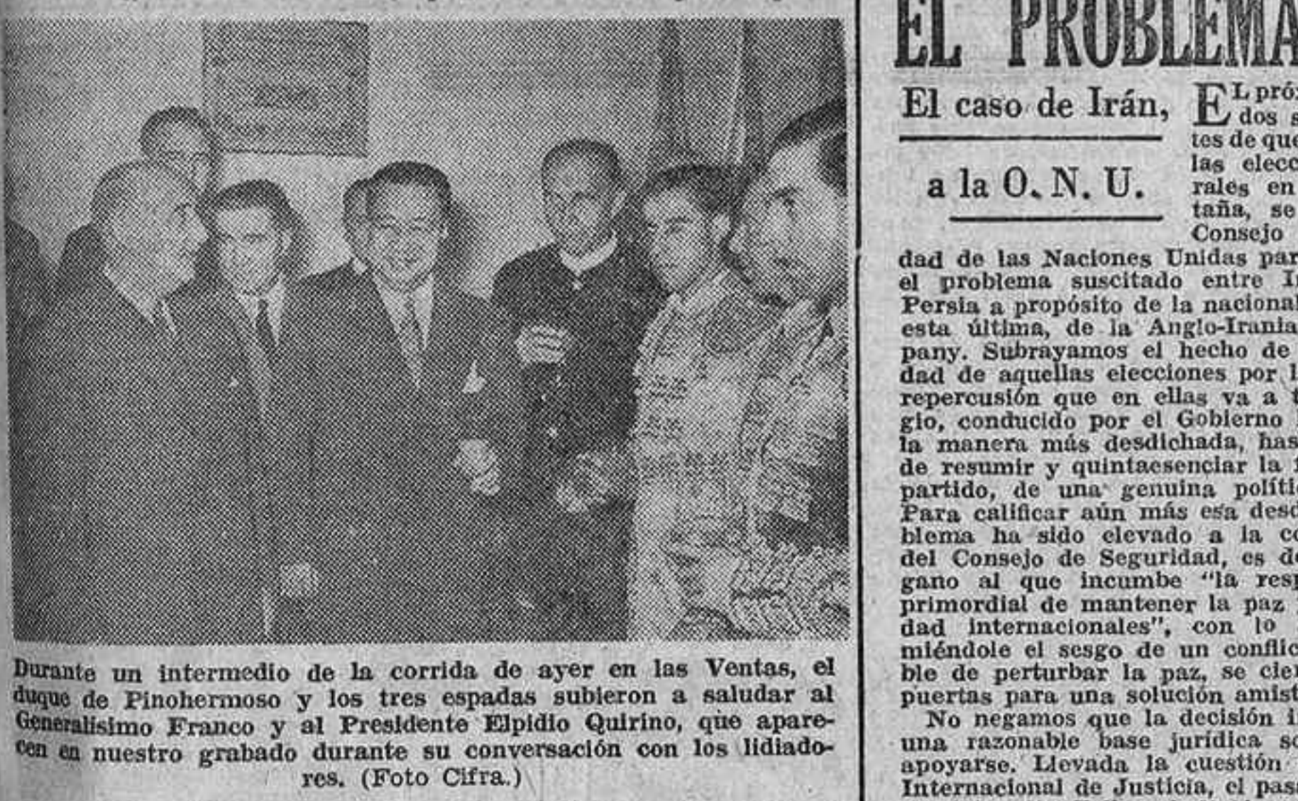
Durante un intermedio de la corrida de ayer en las Ventas, el duque de Pinohermoso y los tres espadas subieron a saludar al Generalísimo Franco y al Presidente Elpidio Quirino, que aparecen en nuestro grabado durante su conversación con los lidiadores.

Poco antes de las cuatro de la tarde de ayer, hora anunciada para la corrida de toros en la plaza de las Ventas, llegaron en automóvil a las puertas del caso taurino Sus Excelencias el Generalísimo Franco y su esposa, doña Carmen Folo de Franco, en compañía del Presidente de la República de Filipinas, Su Excelencia don Elpidio Quirino, junto con los jefes de las Ases Civil y Militar del Caudillo,