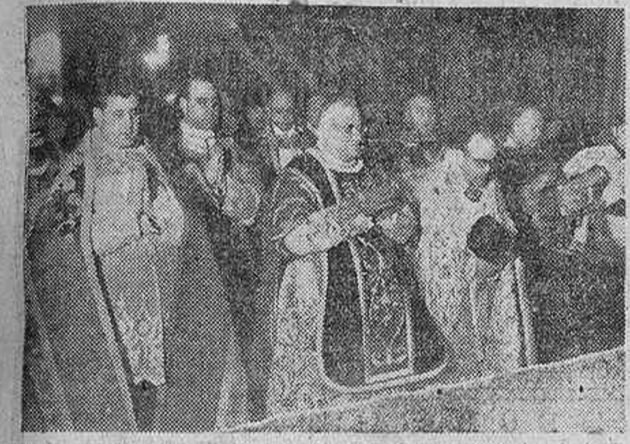
El nuncio de Su Santidad, monseñor Cicognani, ofició de consagrante en la ceremonia religiosa de ayer en San Francisco el Grande, que terminó dando la bendición a los fieles el nuevo Obispo de Mondoñedo

El ministro y el subsecretario del Ejército ocuparon lugares destacados entre la concurrencia