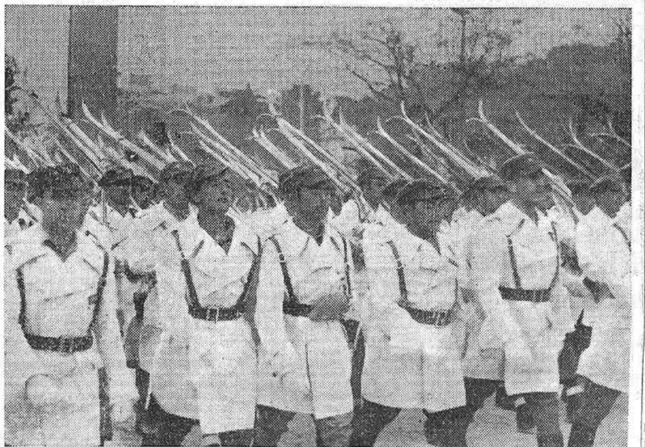
El Batallón Alpino, que tan importantes servicios ha prestado en la Sierra, desfilando por una de las principales vías, con sus esquís y sus albos y pintorescos uniformes

Nuestro estimado compañero dedica esta atención especialmente a los soldados del Ejército glorioso de Franco, que se hallan incidentalmente en Madrid, con motivo del Desfile de la Victoria,