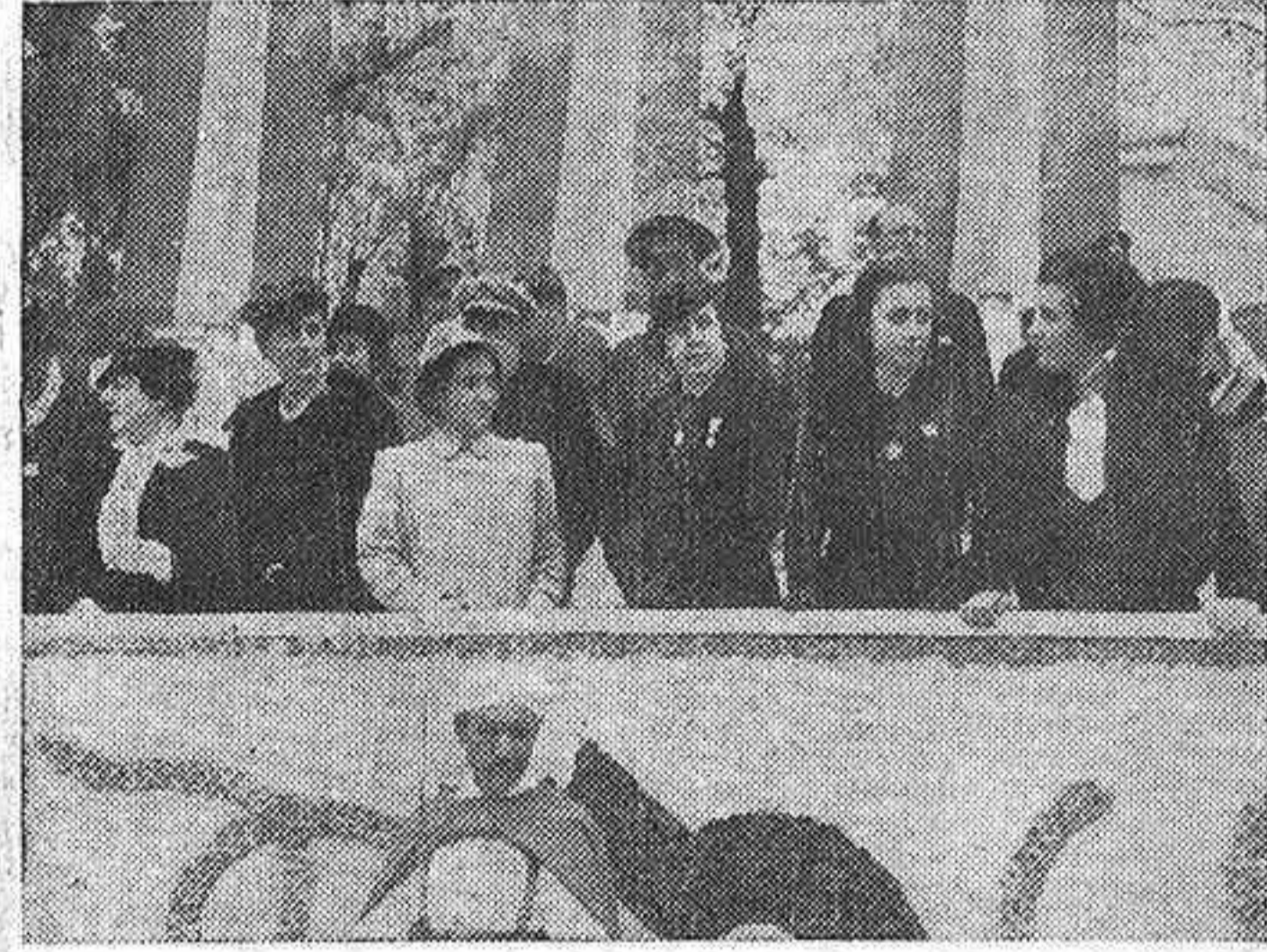
La excelentísima señora doña Carmen Polo de Franco, esposa del Caudillo (tercera figura de la izquierda), y su hija Carmencita, presenciando el gran desfile desde la tribuna