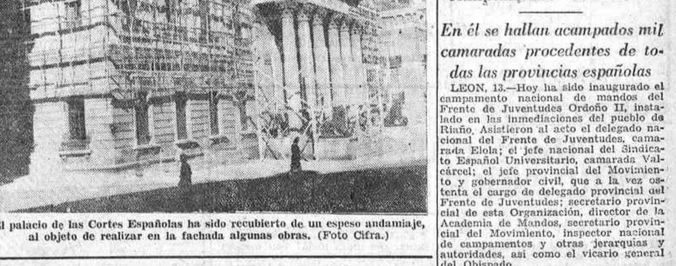
El palacio de las Cortes Españolas ha sido recubierto de un espeso andamiaje, al objeto de realizar en la fachada algunas obras.