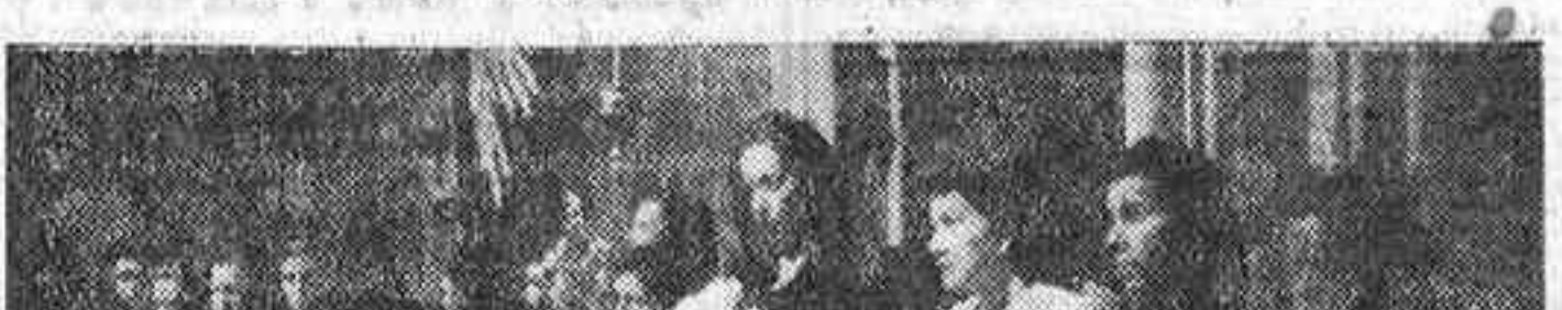
Una piadosa tradición madrileña es la de que las madres ofrecen a sus hijos recién nacidos a la Santísima Virgen de la Paloma

(Viene de primera página) En la parroquia de San Andrés. A partir de esta época es cuando figura el cuadro de la Paloma cubierto con cristal.