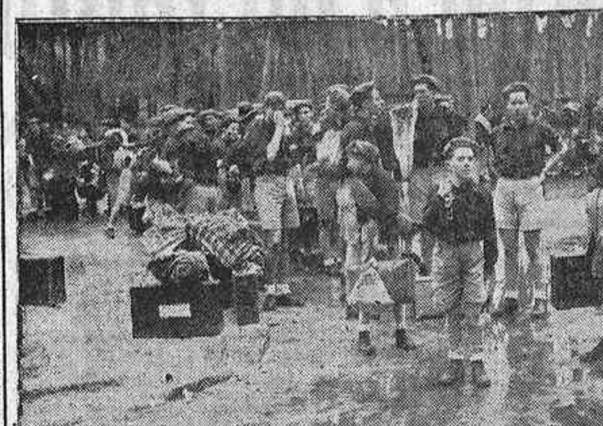
Grupos de muchachos del Frente de Juventudes llegan a Madrid para tomar parte en la gran concentración que, como homenaje a S. E. el Jefe del Estado, se celebrará en el Prado en la mañana de hoy. (Foto Cifra).