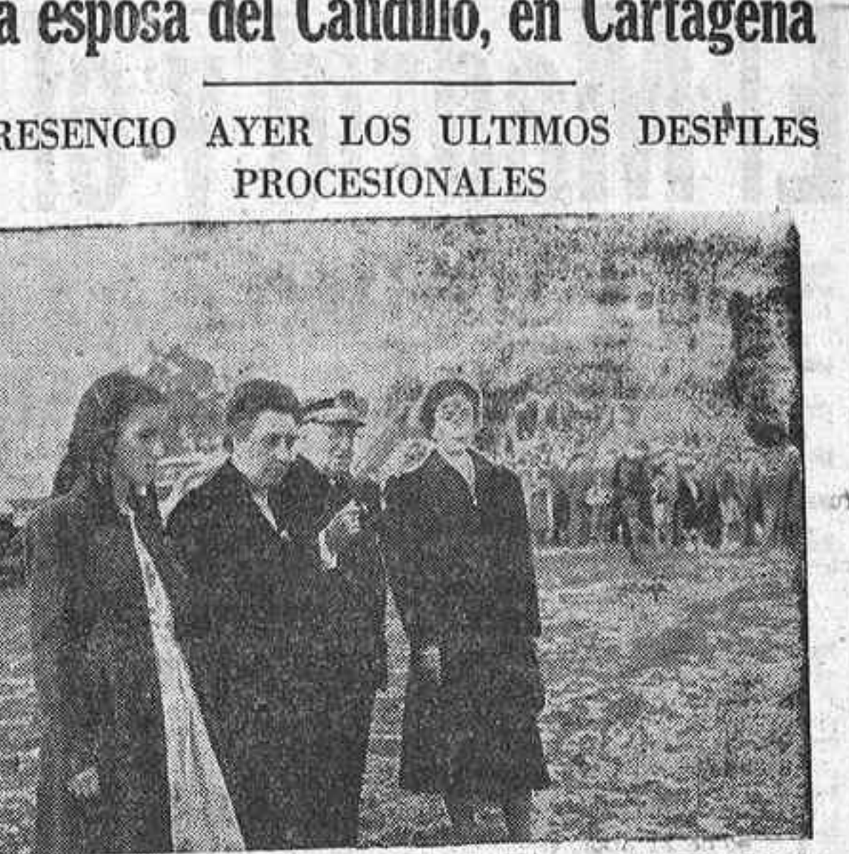
La Excmo. señora doña Carmen Polo de Franco, acompañada por el Almirante Bastarache, efectúa una visita al Parque Torres, de Cartagena, durante su estancia en aquella ciudad levantina...