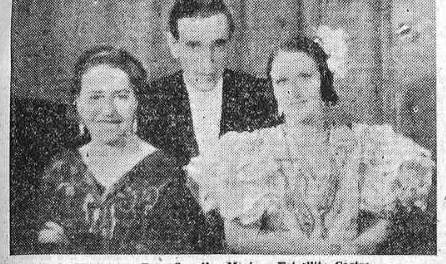
Mariemma, Pepe González Marín y Estrellita Castro.