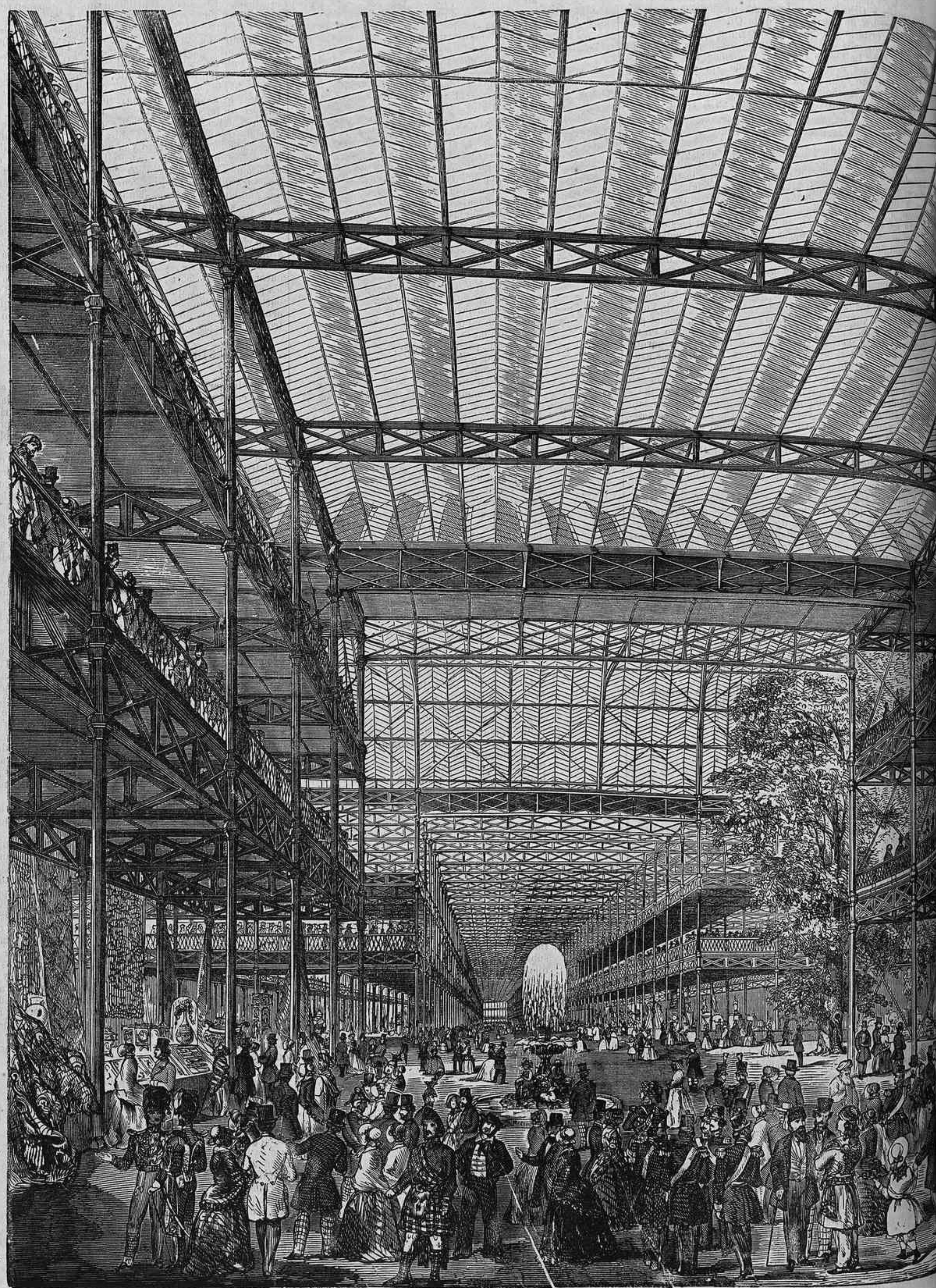
Vista general interior del Palacio de la Exposición universal en Londres.