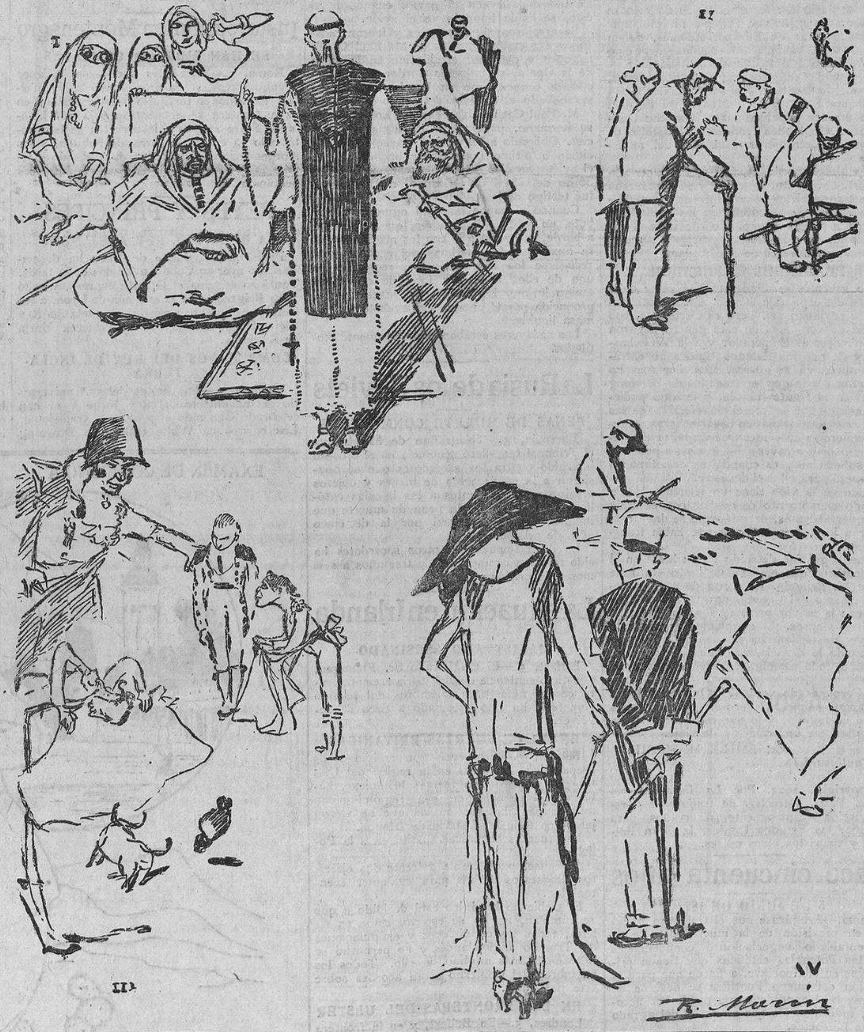
I. Moros y cristianos o las tentaciones del padre Revilla.—II. Camillero I. El uno viene sacramentado y el otro herido gravemente. ¿En qué toro ha sido? Camillero II. En la tercera carrera de caballos de la tarde. — III. Pepe-Hillo (a los toreros que tomaron parte en la corrida del Montepío): «Tú, Chicuelín, esencia del torero ¡con ese miedo!, córtate la coleta ya. Marcial: Si todo tu arte está en el delantal, a la cocina a escape. Y tú, Nacional II, menos tinte trágico y a no torear a cabeza pasada.» IV. Bonita carrera. Por correr unos minutos se premia con 50.000 pesetas a un caballo. ¿Conoces tú algún premio de esa cuantía para recompensar en una carrera a la inteligencia y al trabajo?