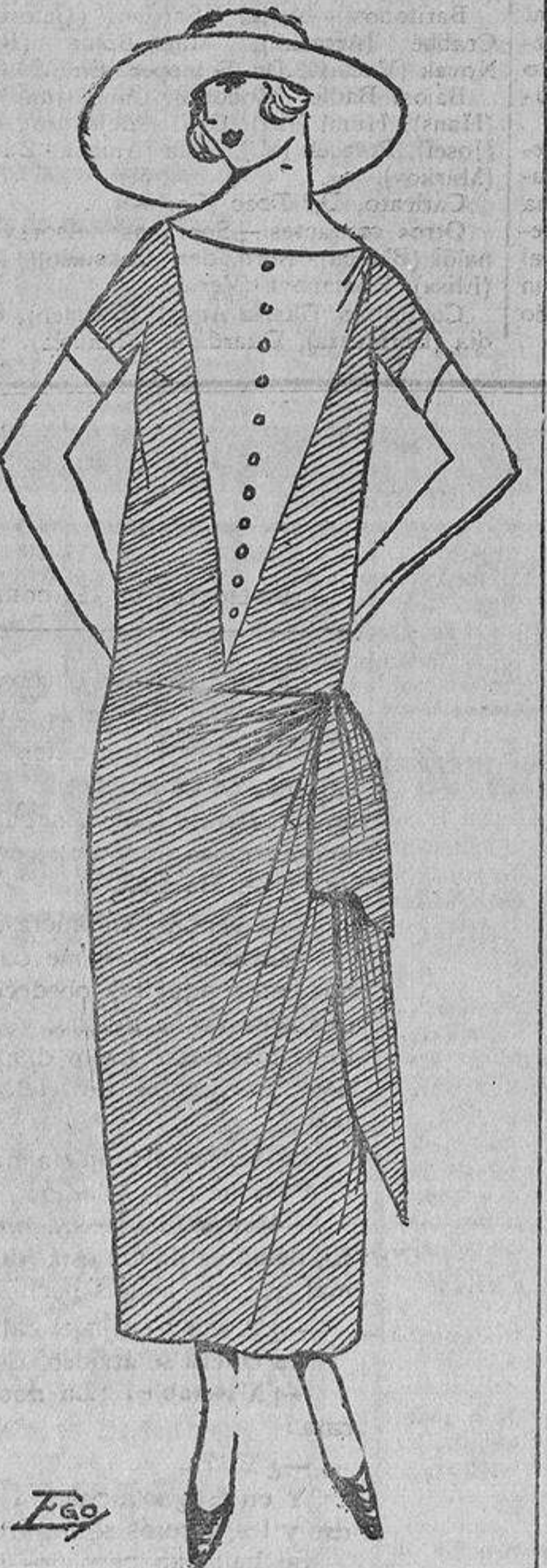
Traje de Iracopla de «Smyrna», color champagne, adornado con un peto de seda blanca.

Ya no se visten las muñecas de aldeanas, pastiegas, etc., sino que la moda, tomando nota de la afición, crea figurines de trajes, y las muñecas representan la actualidad con