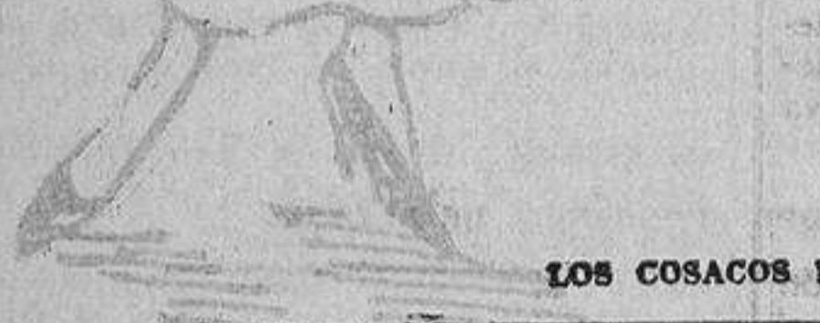
LOS COSACOS EN PARÍS

Servicios de Turismo y Viajes de LA CORRESPONDENCIA DE ESPAÑA, Arenal, 1, principal.—Madrid Envío gratis