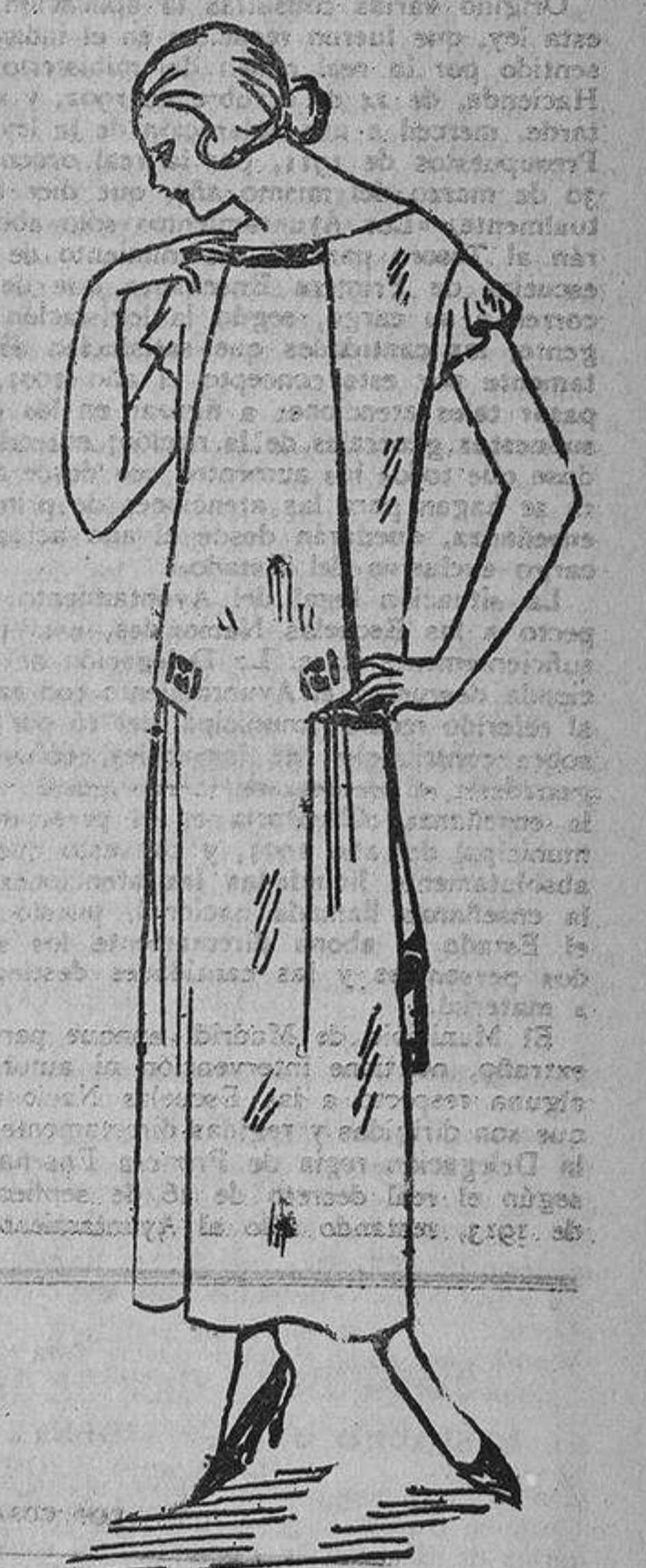
Vestido de seda y rosa adornado con bordados encarnados.

constante del cabello debe usted usar Petróléo Gal, y a poco de haber comenzado su uso, notará que la caída se contiene cada día más, hasta dejar de caer. Claro es que los primeros días, debido al friccionamiento del cuero cabelludo, notará usted que se desprenden más cabellos, lo cual no deberá alarmarla, pues son los cabellos que tienen estropeada la raíz, y que, al frotarlos, se desprenden; pero con ello no se causa ningún mal a la cabeza, pues se limpian mejor las raíces. Después del constante uso empiezan a salir nuevos cabellos, fuertes y vigorosos. Antes de terminar el primer frasco notará usted que la caspa desaparece por completo.