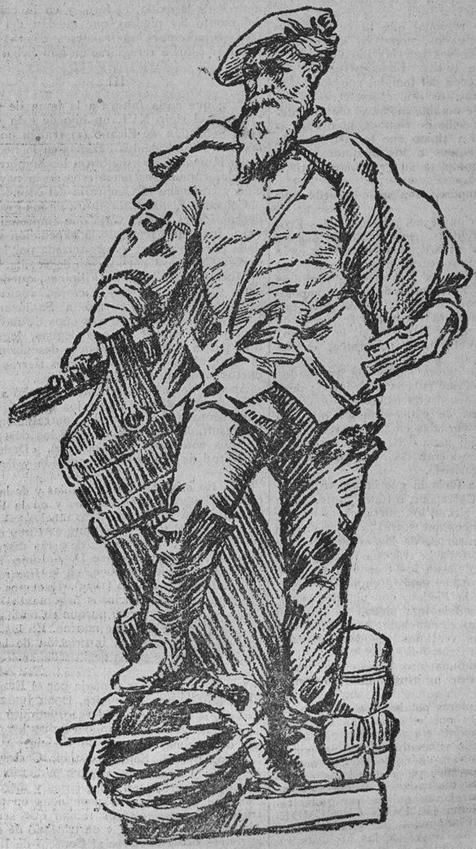
Sebastián Elcano.—Escultura de Bellver