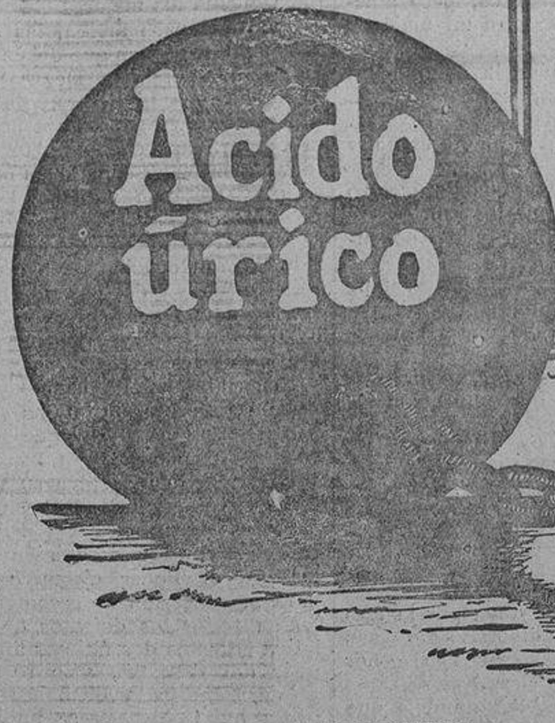
Depositarlo Generales: DALMAU OLIVERES, 14 Pasco de la Industria, BARCELONA