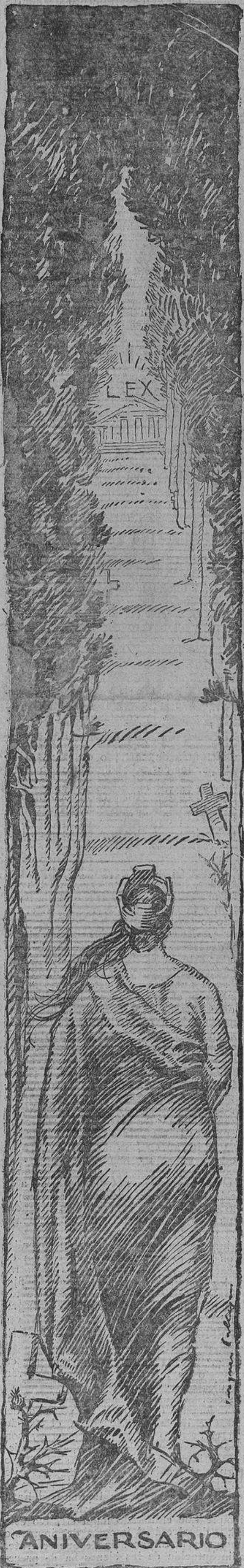
Haci6 el a6o de la Justicia m6rcula solemnemente la Patria, entre las tumbas de sus m6rtires.