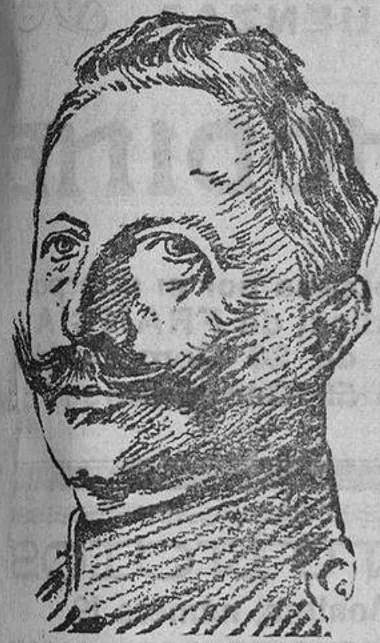
El Kaiser al estallar la guerra

Para seguir mereciendo el favor del público, “La Correspondencia de España” HA ADQUIRIDO LA EXCLUSIVA, para toda España, de la publicación de las