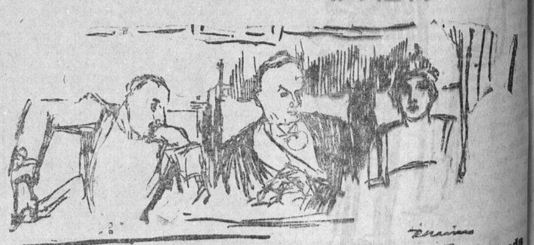
Los Reyes y el P. Alvear en el palco del Teatro Pareda durante la función de gala.