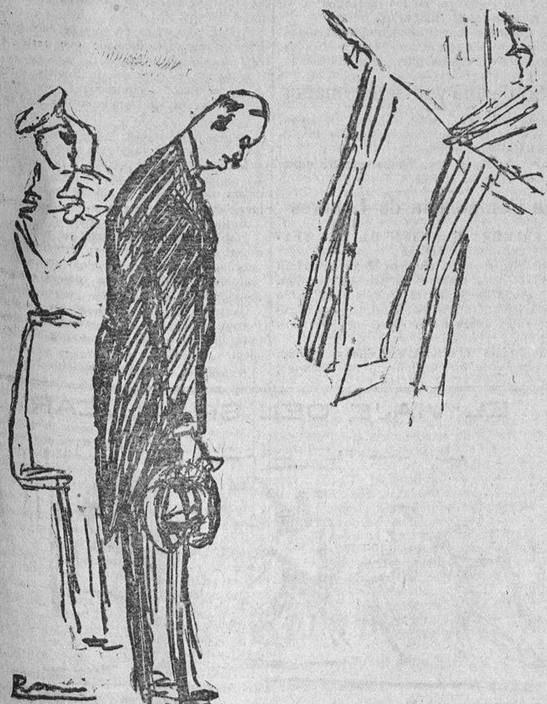
Saludo a la bandera