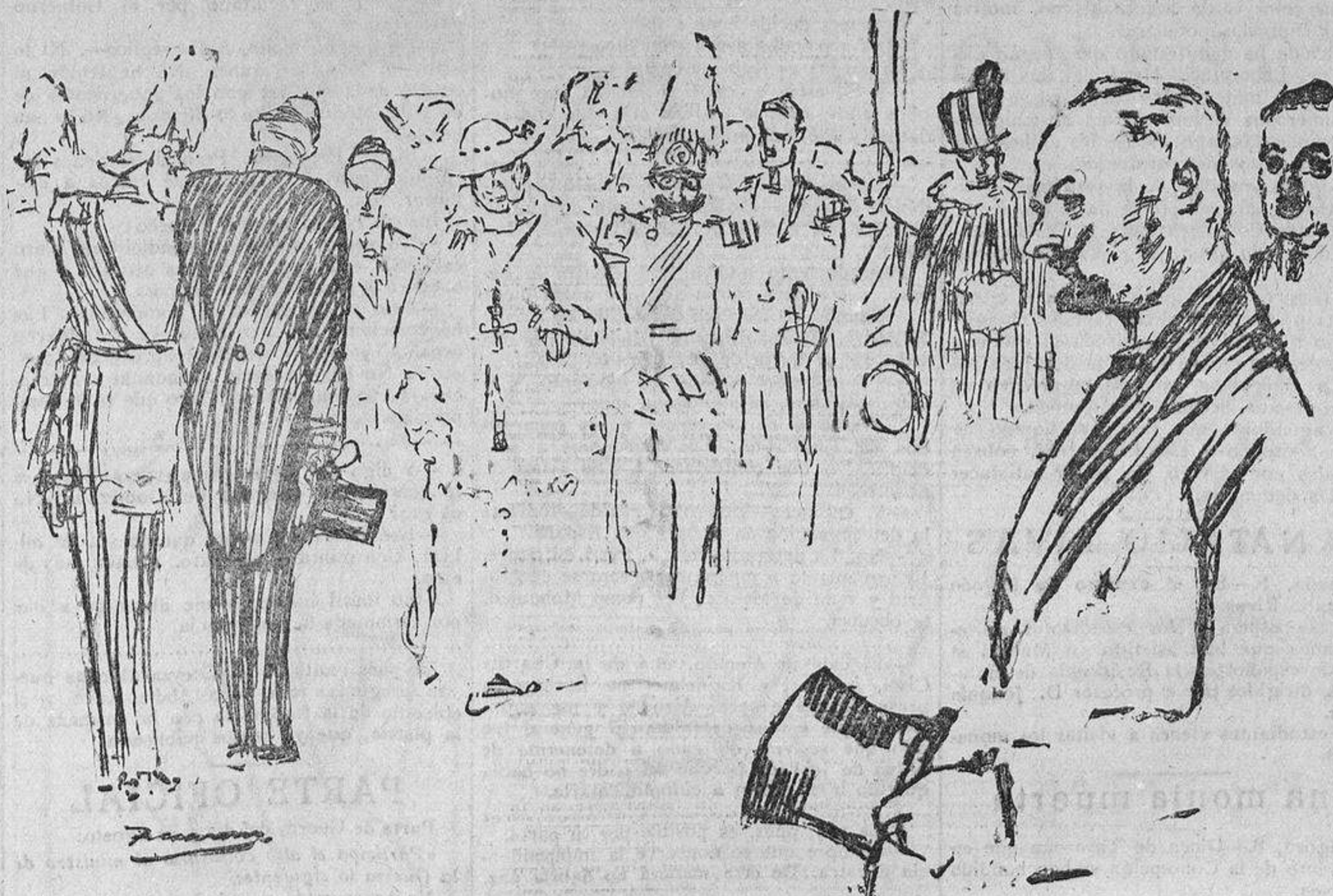
El Presidente saluda a las comisiones.

Continúa esta información en la página quinta