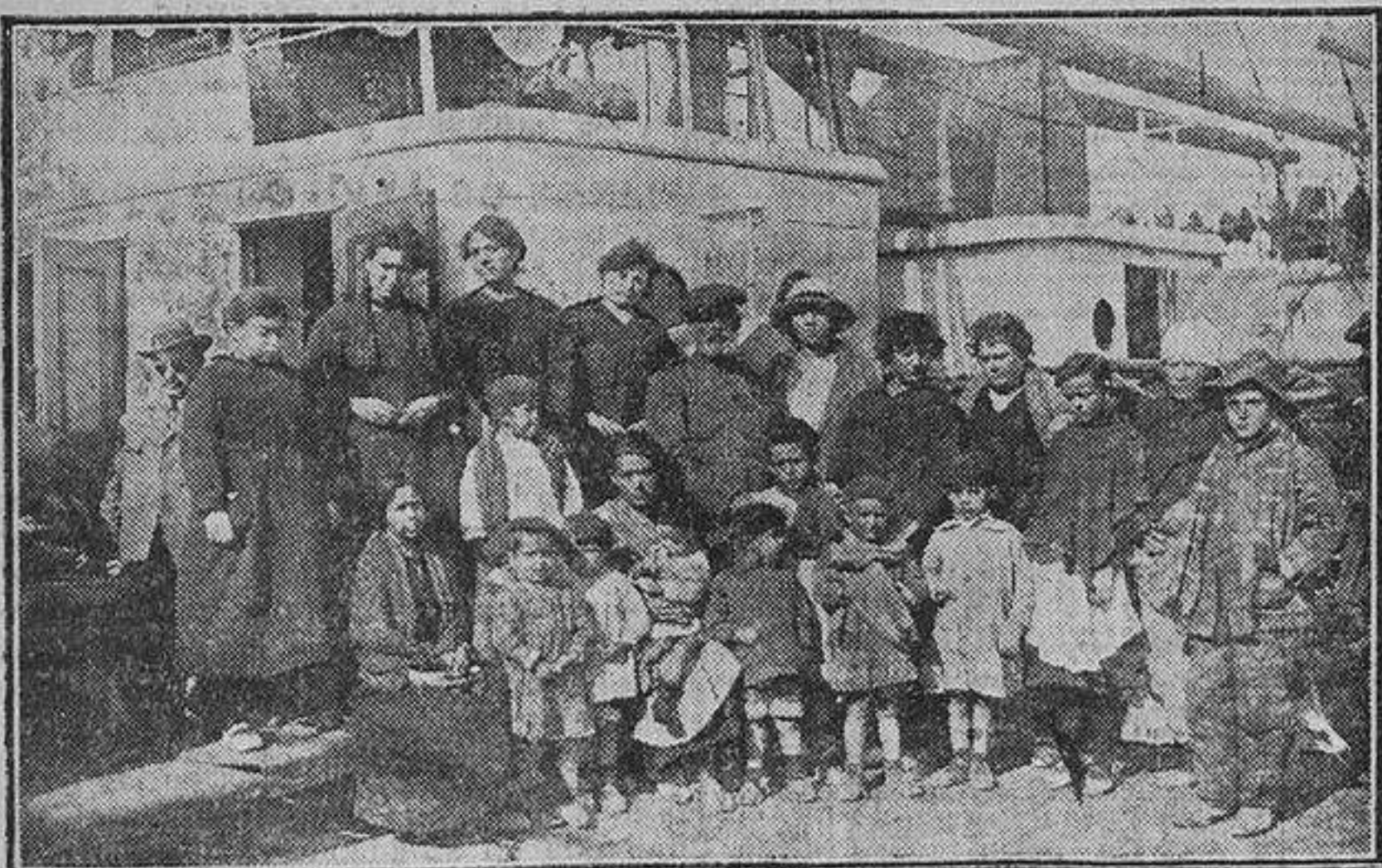
Grupo de los niños prisioneros. Todos quedaron huérfanos, algunos de padre y madre. El humano sacrificio de los mayores salvó las vidas de estos infelices niños.