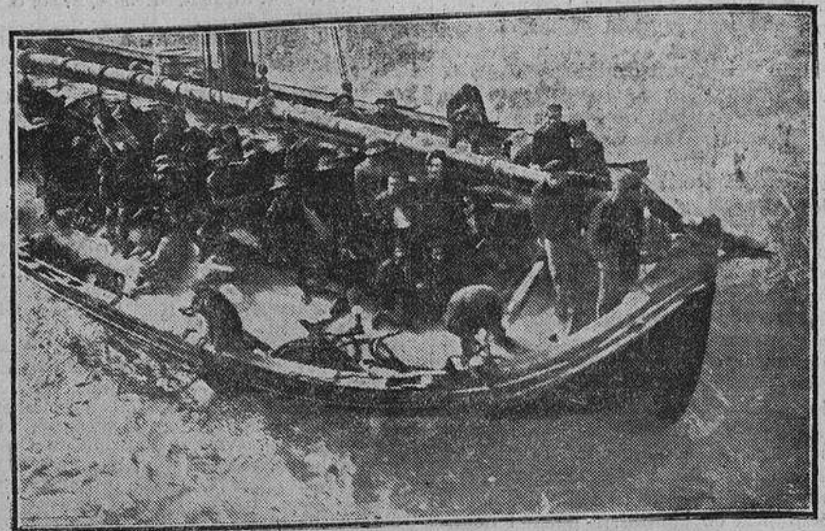
Uno de los lanchones de prisioneros arribando al costado del «Antonio López», azotado por el Levante.

—Soy crítico. —¿De arte? —Sí, porque la literatura es arte. —¿Y en dónde escribe usted, admirable colega?