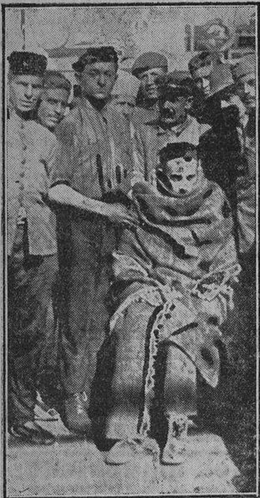
Uno de los soldados gravemente enfermo en el momento de embarcar

¿No habéis percibido el grito unánime que resuena a estas horas en el país todo? El haz que forman todas las voluntades demanda el premio urgente para el sargento Francisco Vassallo. ¿Qué hacemos a Vassallo?—se pregunta. Han transcurrido sólo algunas horas desde que puso el pie en Melilla la soñada, y al divulgarse algunos hechos, sólo algunos, de la labor de sacrificio y de bondad realizada con los soldados cautivos, las gentes han sentido sobre sus espíritus el poder