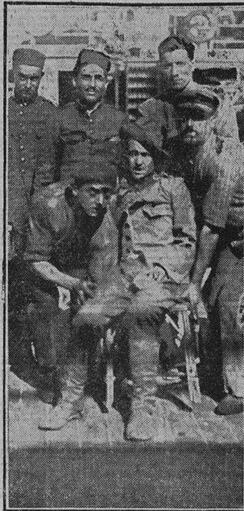
Un soldado es conducido a la embarcación de «Antonio López»