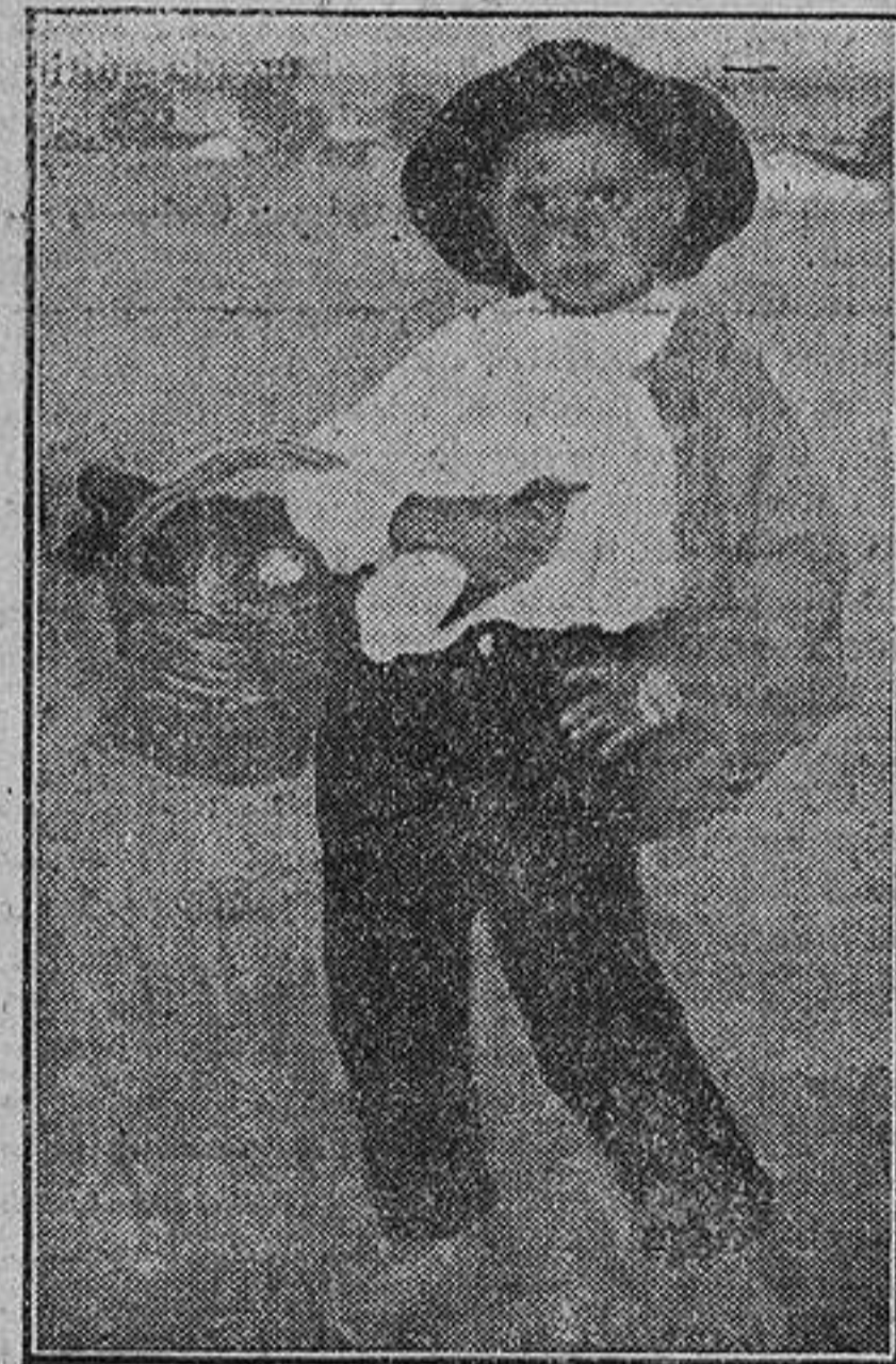
«El niño del avejarruco»

—Naturalmente que sigo trabajando. Llevo dos años en Madrid, y no puedo quejarme. Soy hombre de modestas aspiraciones,