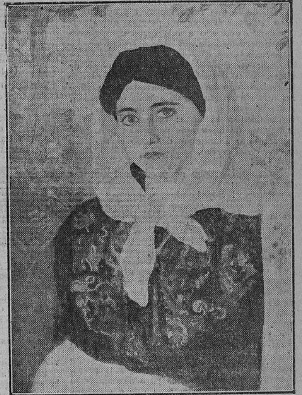
Fragmento del cuadro «Carmen», que ha sido enviado a Buenos Aires.

—¿Y qué pensaban los italianos? No me explico cómo una obra así haya podido vol-