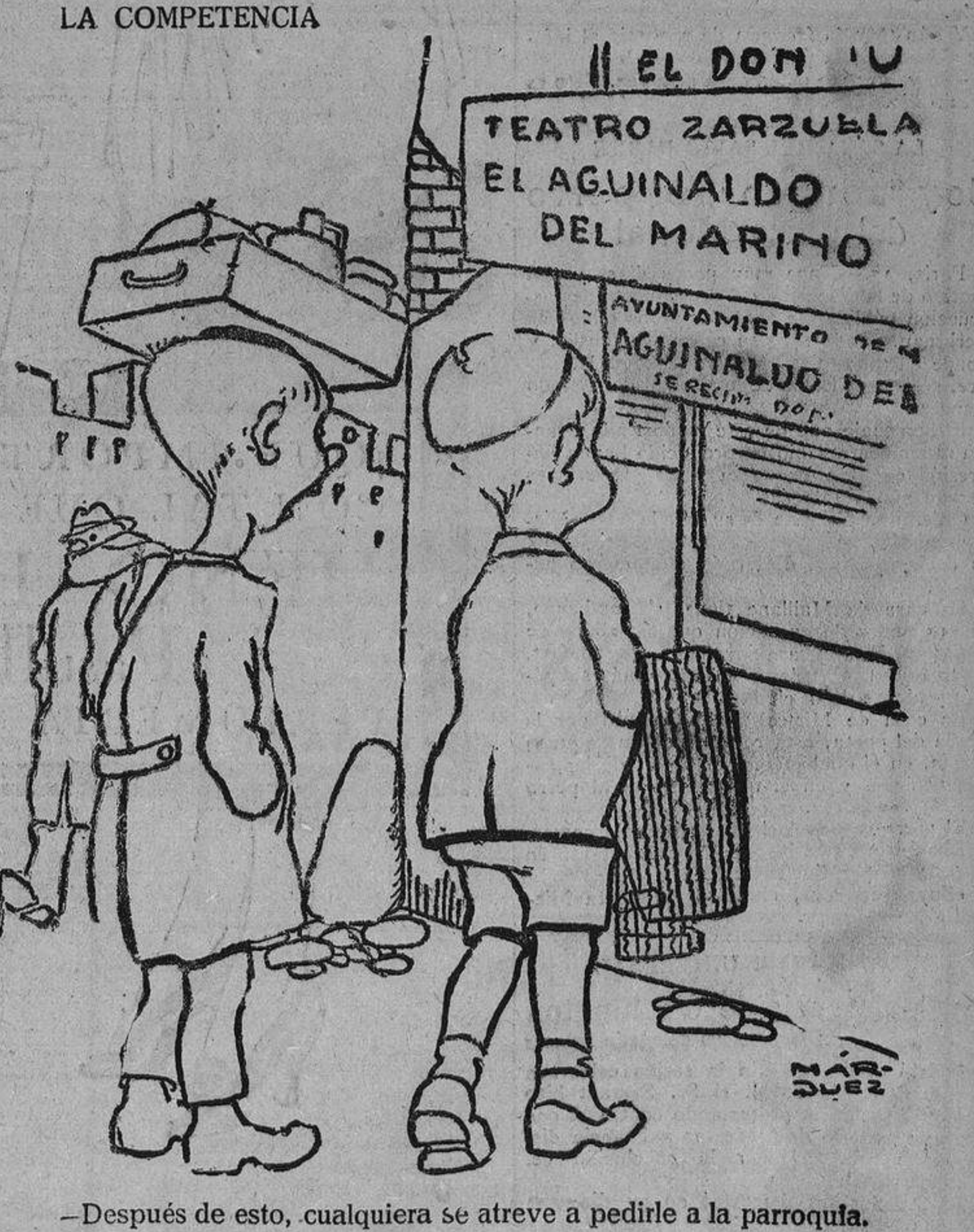
—Después de esto, cualquiera se atreve a pedirle a la parroquia.

Berlín, 10.—El Reichstag ha rechazado, por 105 votos contra 138, una moción presentada por las derechas, en la que se pide el mantenimiento del antiguo pabellón imperial en la Marina.