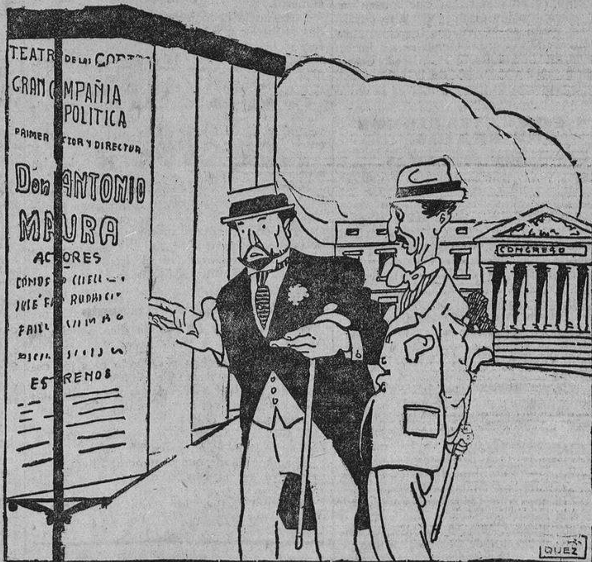
Alba.—Ya verás, Melquiades, cómo esta compañía sólo actúa en otoño. Seguramente para el invierno nos llaman a nosotros