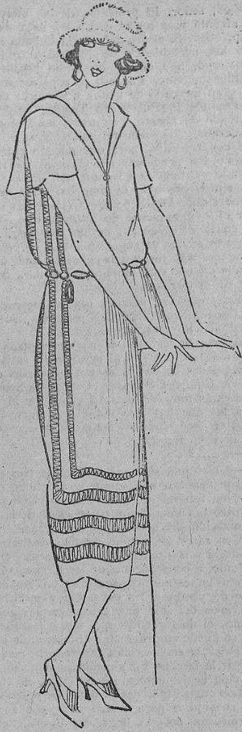
Muy sencillo de hacer una misma, este vestido de grü sa tela blanca de algodón, adornado con un especie de entredós de lana, que se hace a ganchillo, sobre un cartón, como silueta para hacer fleco.

Los trajes de novia largos son majestuosos; yo no he podido acostumbrarme a las faldas cortas para esa ceremonia, que