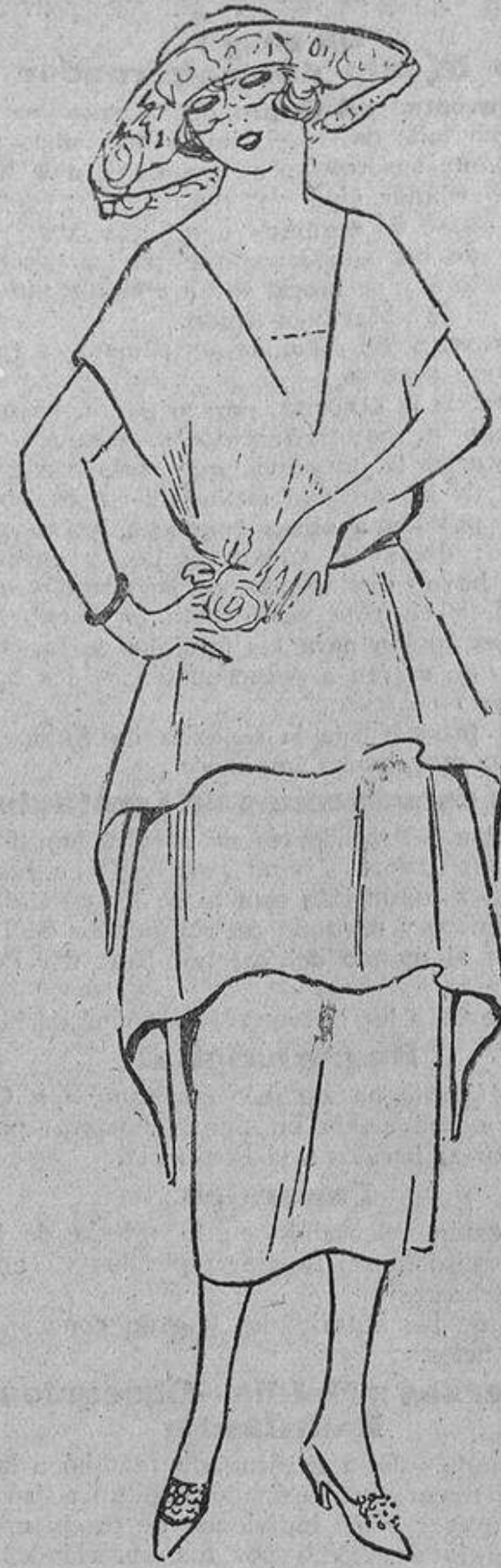
Sencillo vestido de crespón de seda gris con volantes, que caen detrás alargados.

USE USTED LOS PRODUCTOS ROBERTS EN TODAS LAS PERFUMERIAS