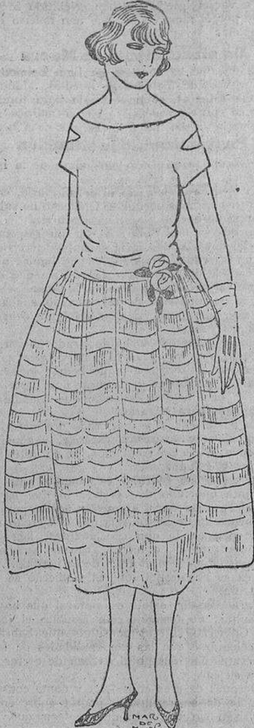
Encantador este vestido de taftán y tul negro o de color. La falda va cubierta por tiras de taftán sobre el tul, que está muy fruncido.