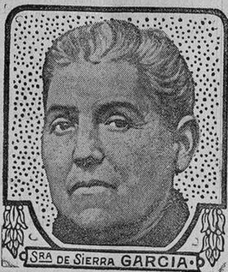
La Señora de Sierra García, que habita en Baena (Córdoba), calle de Amador de los Ríos, n.º 12, ha recurrido a las Píldoras Pink para restablecerse y restaurar sus fuerzas: ella misma nos informa de que disfruta de una salud perfecta.

Las personas entradas en años hacen mal en suponer que las indisposiciones de que adolecen con frecuencia son el inevitable resultado de la edad. Péciso es que no se imaginen tal cosa. Las personas de edad deben cuidarse lo mismo que los jóvenes; y si se cuidan por medio de las Píldoras Pink tienen grandísimas probabilidades de recuperar la integridad de sus fuerzas y de disfrutar por largo tiempo de una vejez muy resistente y todavía robusta. Mantener la sangre en estado de pureza y de fortaleza: en esto estriba el secreto de la buena salud en todas las edades de la vida.