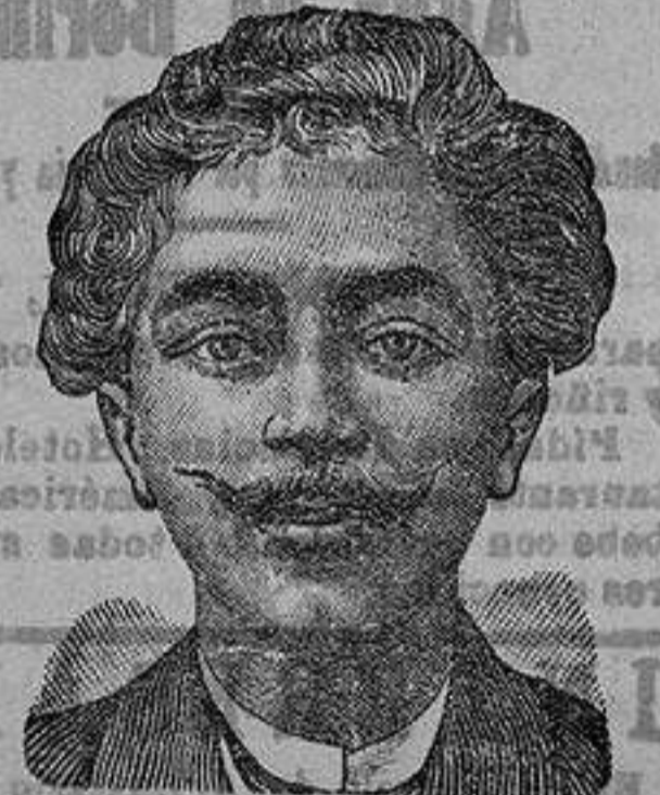
Después de 15 días de la curación