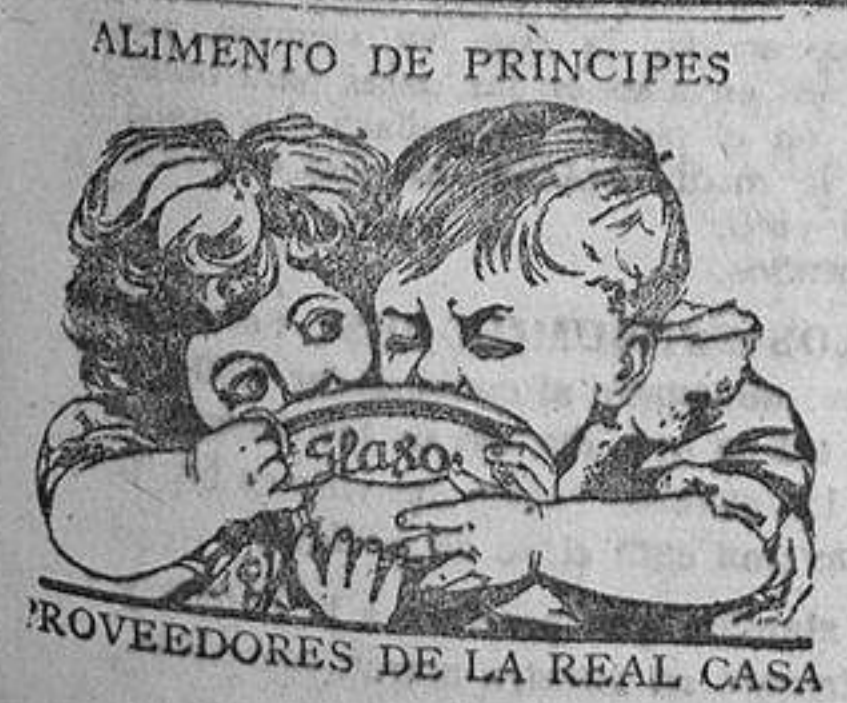
ROVEDDORES DE LA REAL CASA

Imp. de LA CORRESPONDENCIA DE ESPAÑA. Factor, 7.