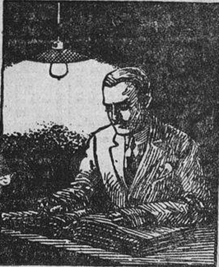
TRABAJANDO CON LÁMPARA DE FILAMENTO METÁLICO