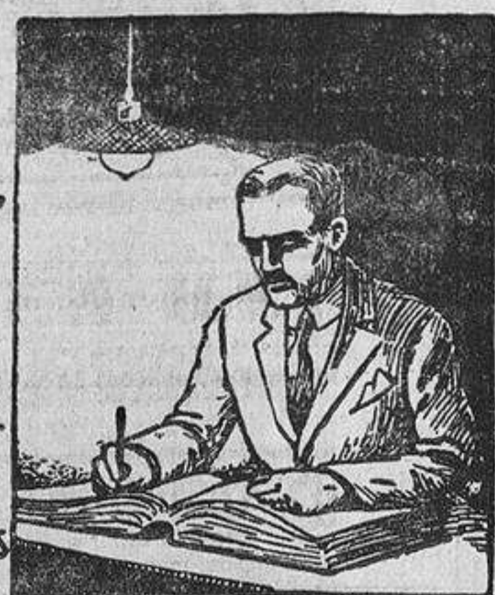
TRABAJANDO con PHILIPS ARGAT LLENA DE GAS ARGON.