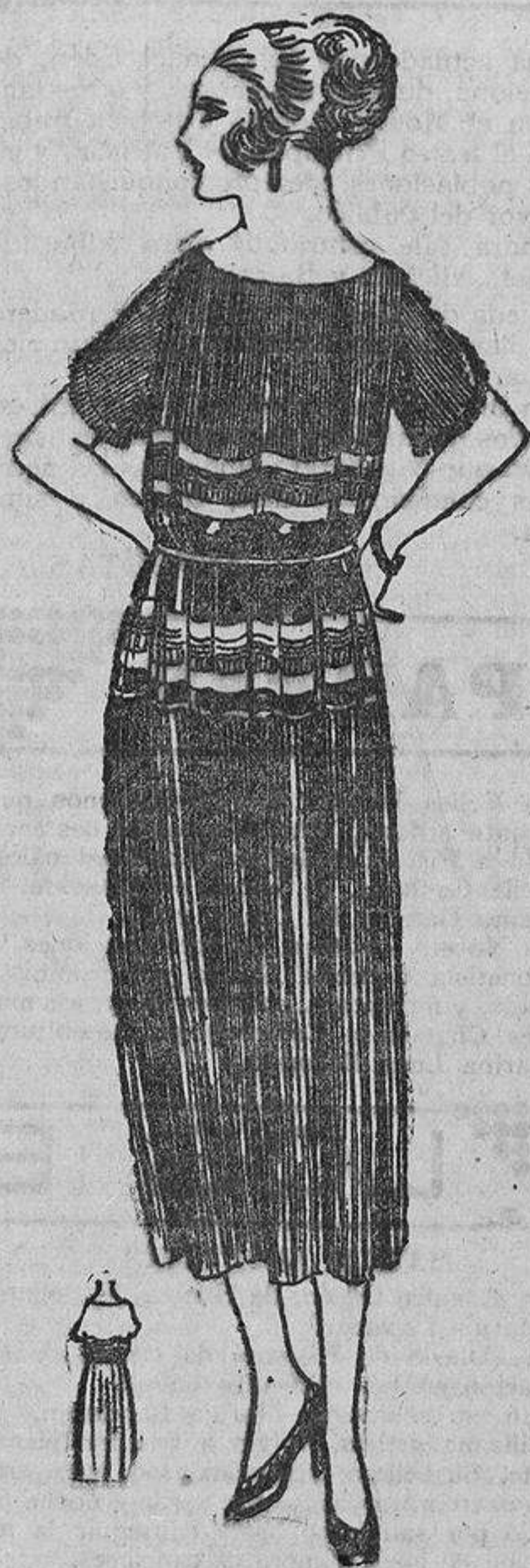
Visto en el «Palace», brindamos la idea a las muchachas habilidosas; sobre un vestido de cañamazo negro zurci con gruesas sedas de distintos colores una franja horizontal que rodee el cuerpo y la parte delantera de la falda.

Supongamos, por ejemplo, que no tengáis más que un solo vestido azul marino. Para el paseo matinal y las compras, etcétera, podéis ponerlo con un chaleco aveallana, o una blusita de seda blanca o amarillenta, de forma camisero. Sombrero redondo de paja erizada, o si hace un día espléndido, de grueso «paillason» marino. Guantes mosquetero y medias con zapatos muy «trotteur».