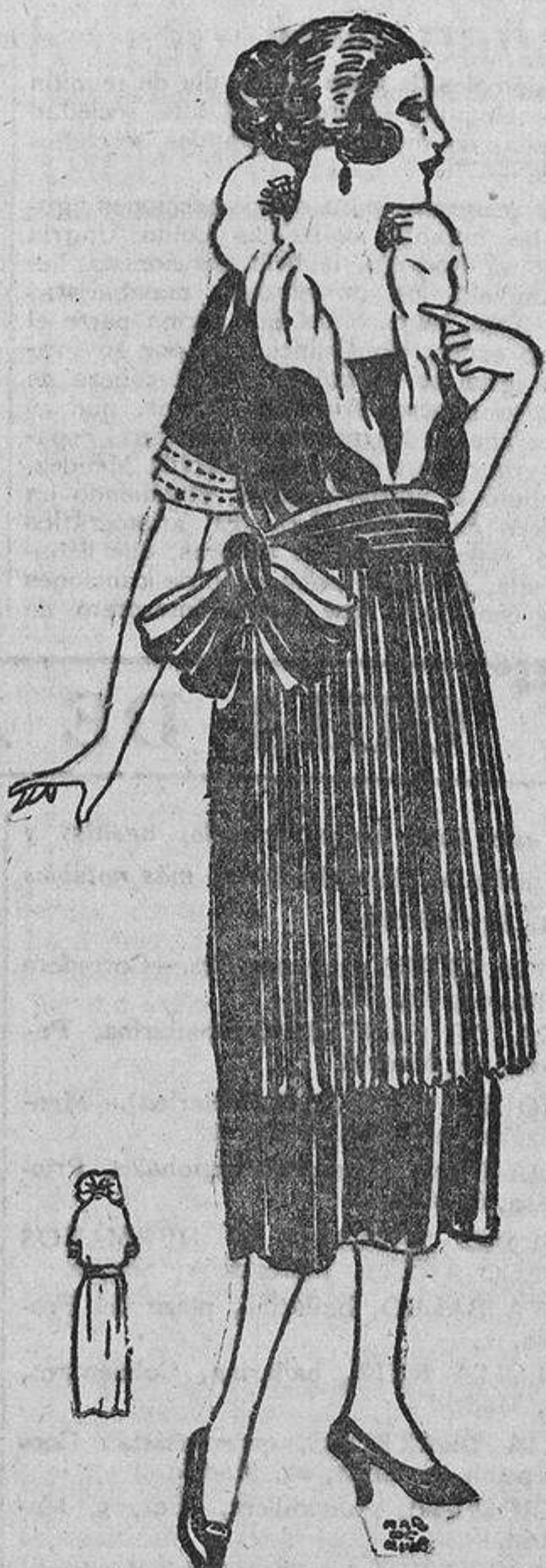
Un delantal para servir el té? No, un delantal plisado de tafetán negro como el vestido, sobre una falda sencilla; en la cintura gran banda negra y blanca por dentro, y alrededor del escote gola plisada de tafetán negro, y blanco interiormente.

Gracias a la moda de los chalecos se puede, alternando uno de «duvertyne» azul rey con otro de brochado antiguo, cambiar por completo el aspecto de un vestido. Este no es un detalle importante para las que poseen una bolsa inagotable; pero para una fortuna modesta puede ser de gran utilidad.