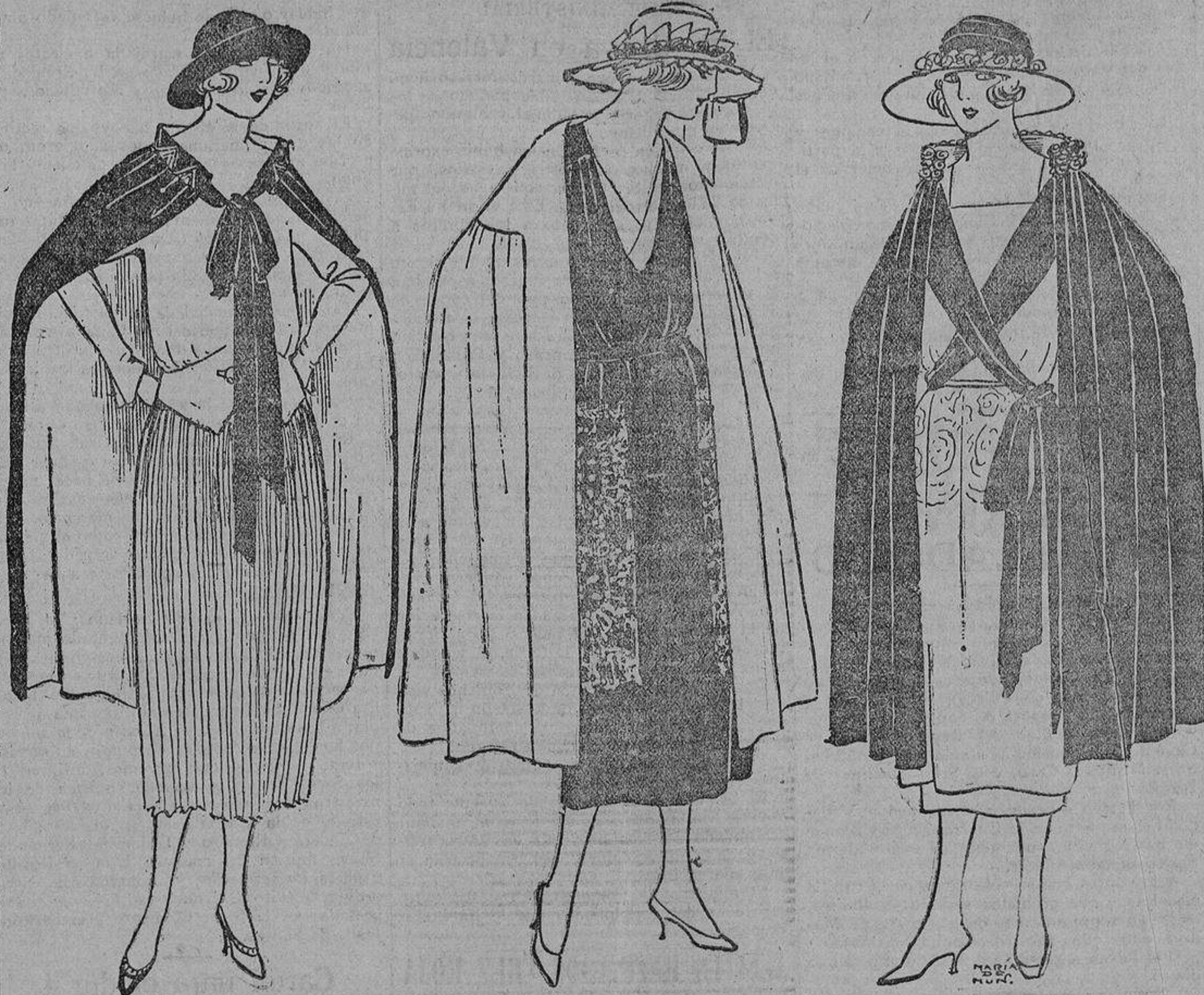
Simple capa cortada al hilo y fruncida en una tira con bordados, puede llevar forro de distinto color—o no llevarlo—que todo está bien.

Las capas que se destinan exclusivamente como salidas de teatro se confeccionan