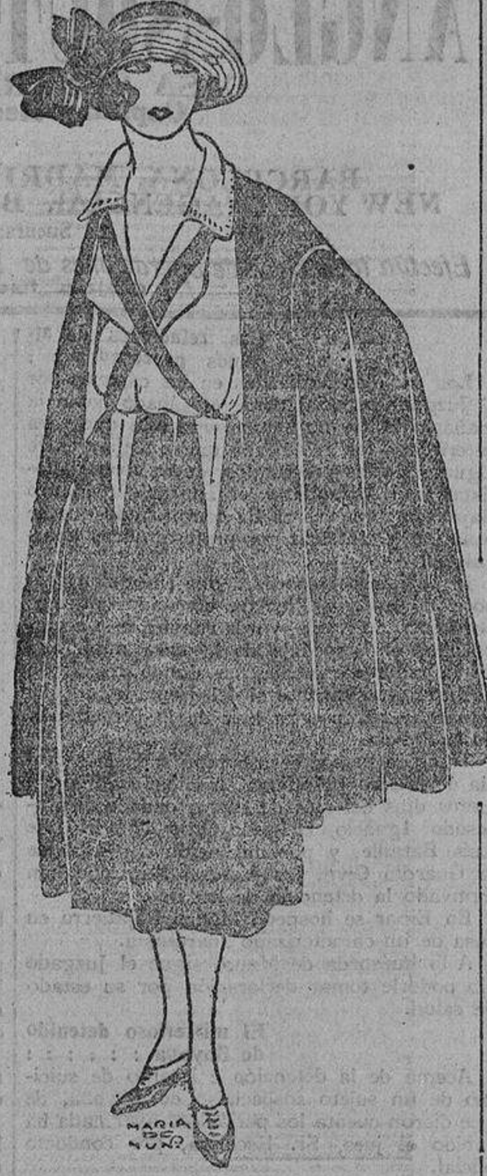
Las capas veraniegas que empiezan a presentarnos, son de crepón de seda y con un corte de capa a los lados.