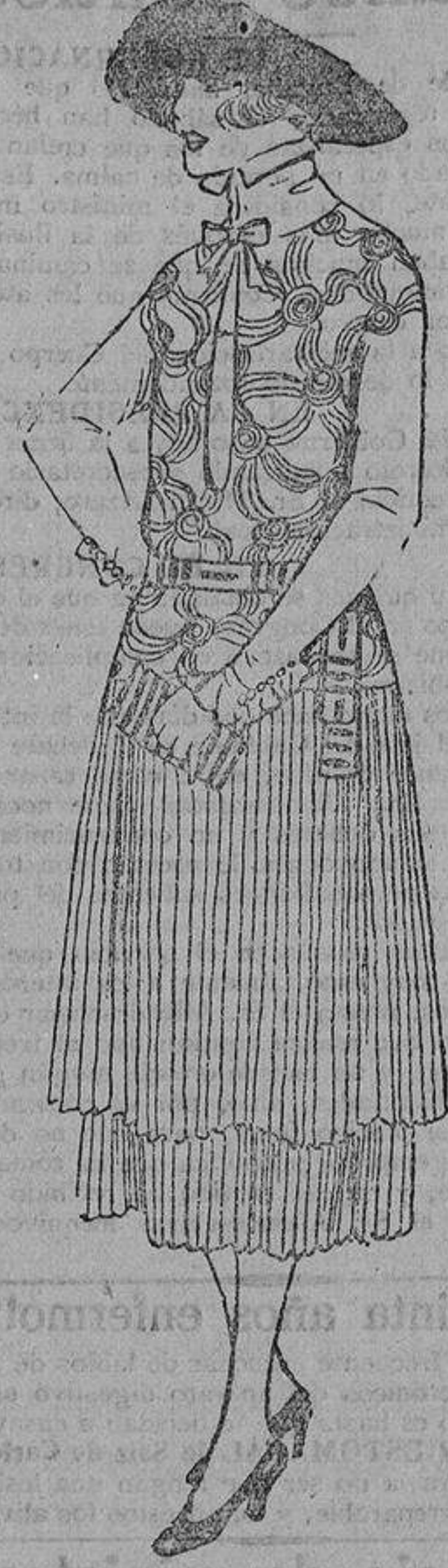
Un bonito vestido, con dos volantes plisados, y el cuerpo bordado con lana beige. El modelo, de fina sarga marino.

CORALINE EL MEJOR DENTIFRICO EN TODAS LAS PERFUMERIAS