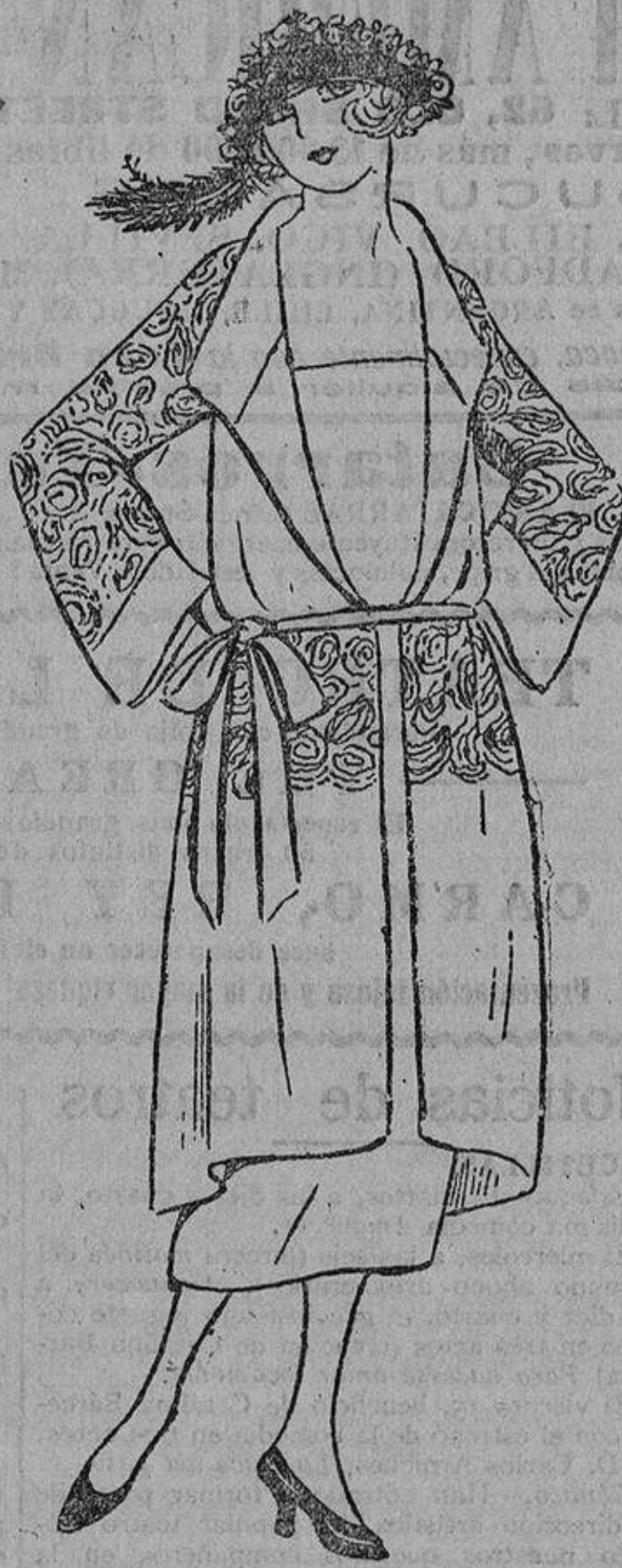
Una señora estará muy elegante con un traje de crepón de seda negro bordado, en gris o con seda brillante negra.

El azul marino sienta mal a las morenas de cutis oscuro; en cambio, está bien a las de tez clara. Lo mismo ocurre con el