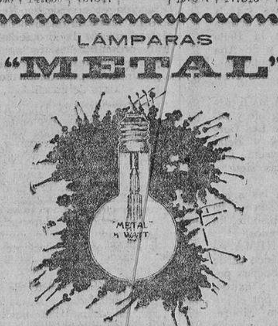
Compañía General Española de Electricidad MADRID. APARTADO 150