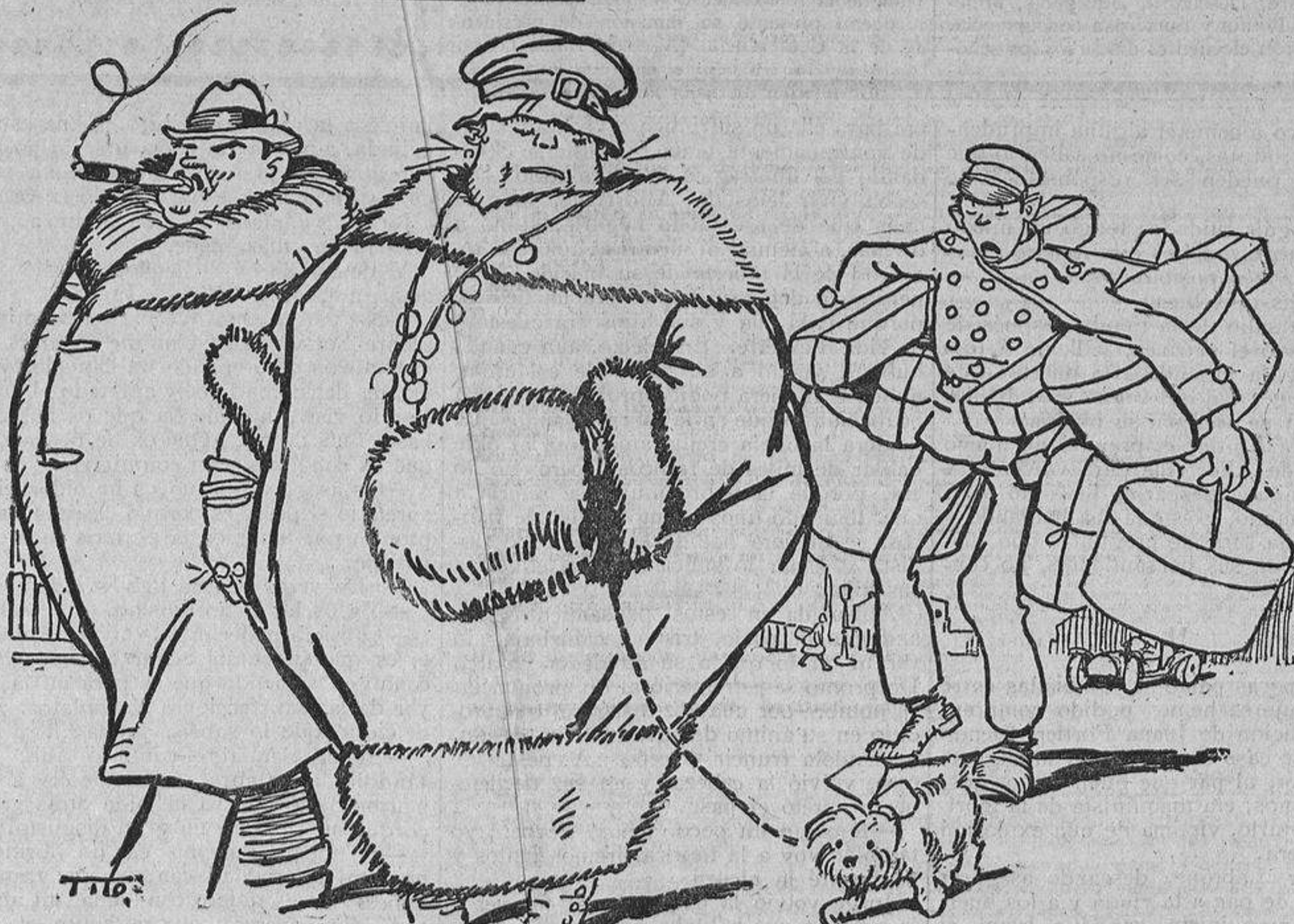
— ¡Pobre chico! — ¡Peor sería que tuviese que llevarte a ti!