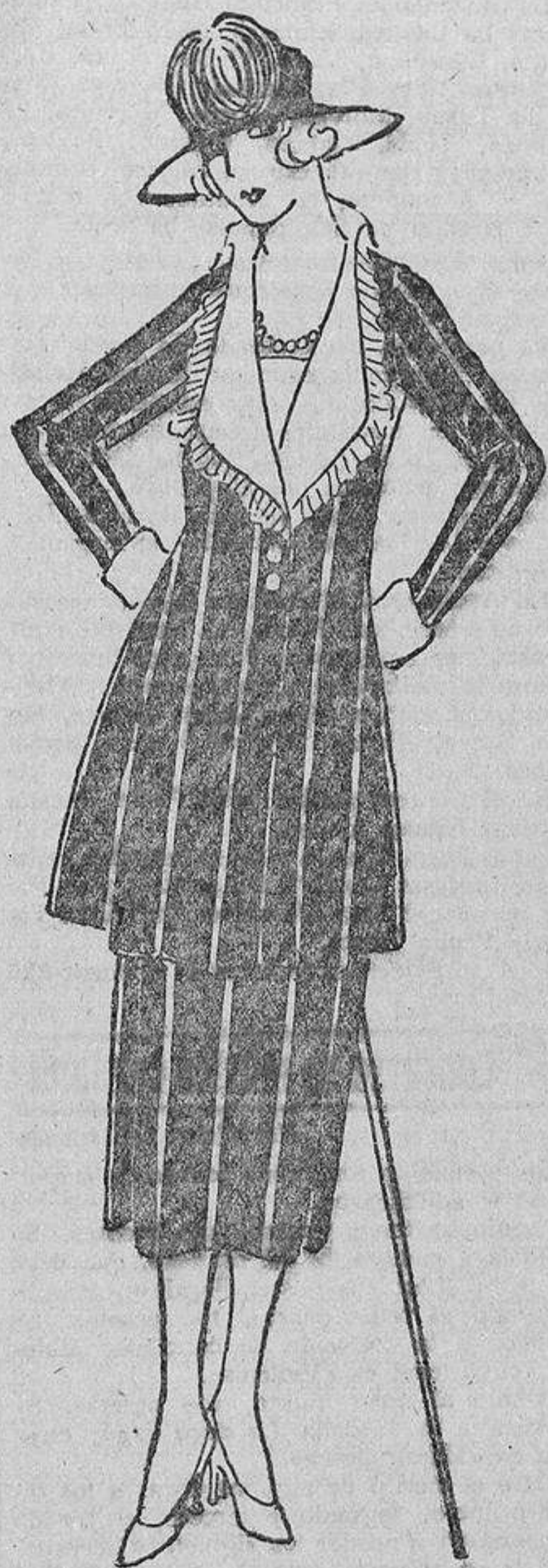
La severidad de un traje sastre, de sarga marino rayada en blanco debe ir acompañada por un cuello de organdí blanco.

Para no engordar, muchas desgraciadas han tomado el partido de suprimir la alimentación, y es triste verlas en los públicos absorber un té oscuro y sin azúcar, y aun añaden con sonrisa forzada: «¡Qué delicioso es este té! ¡Qué aroma!» Y en apariencia olvidan tomar las pastas que muy a gusto mordisquearían. Estas son las sacrificadas voluntariamente.