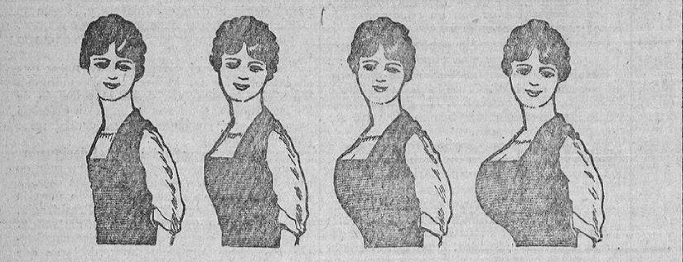
Estos grabados enseñan la científica sección que en treinta días me transformé el pecho blando e irregular en pecho maravilloso y duro. Mande hoy mismo el adjunto cupón y observe cómo su propio pecho pasa por iguales transformaciones