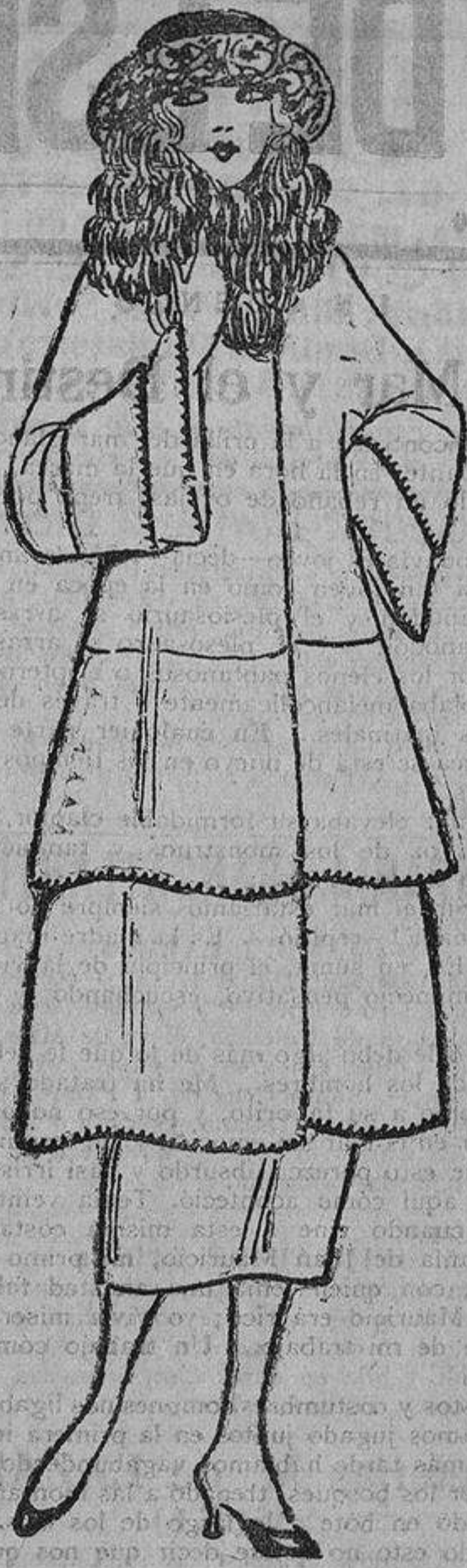
Muy acertado este modelo de terciopelo de lana color cuero, con sus dos volantes cortados ligeramente en forma, rematados con un punto de lana a ganchillo y su piel «beige» de mongolia desizada.

«La elegante señora de Kolinsky», como la llamaban los cronistas de sociedad antes de la guerra por el «chico» de sus «toilettes», aunque todavía podría vivir del crédito de sus amistades, prefiere vender pantallas y almohadones en un rin-