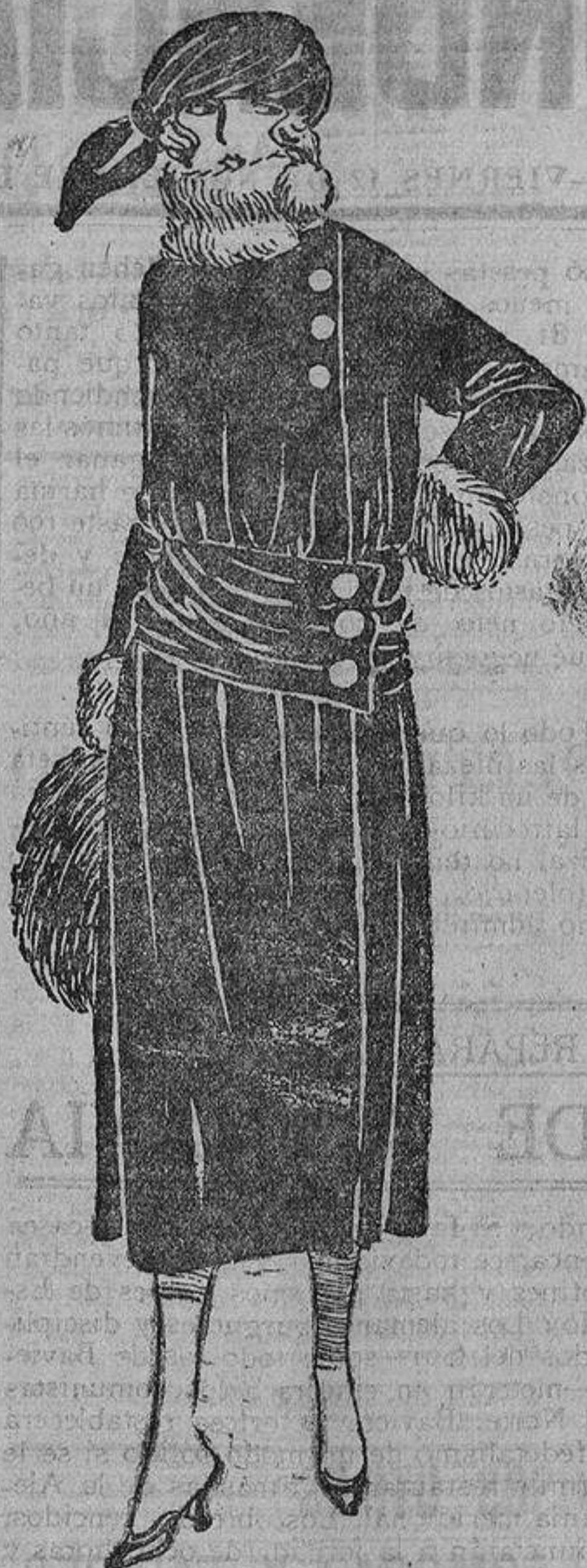
Este vestido-abrigo puede ser de lana o terciopelo abrochado a un lado y con una ancha banda colocada un poco baja, en la cintura.