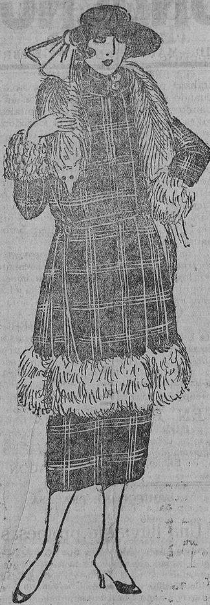
Gabardina azul marino rayada en «belge» Mongolia del mismo tono, y un bonito tipo, bastan para conseguir esta silueta elegante.