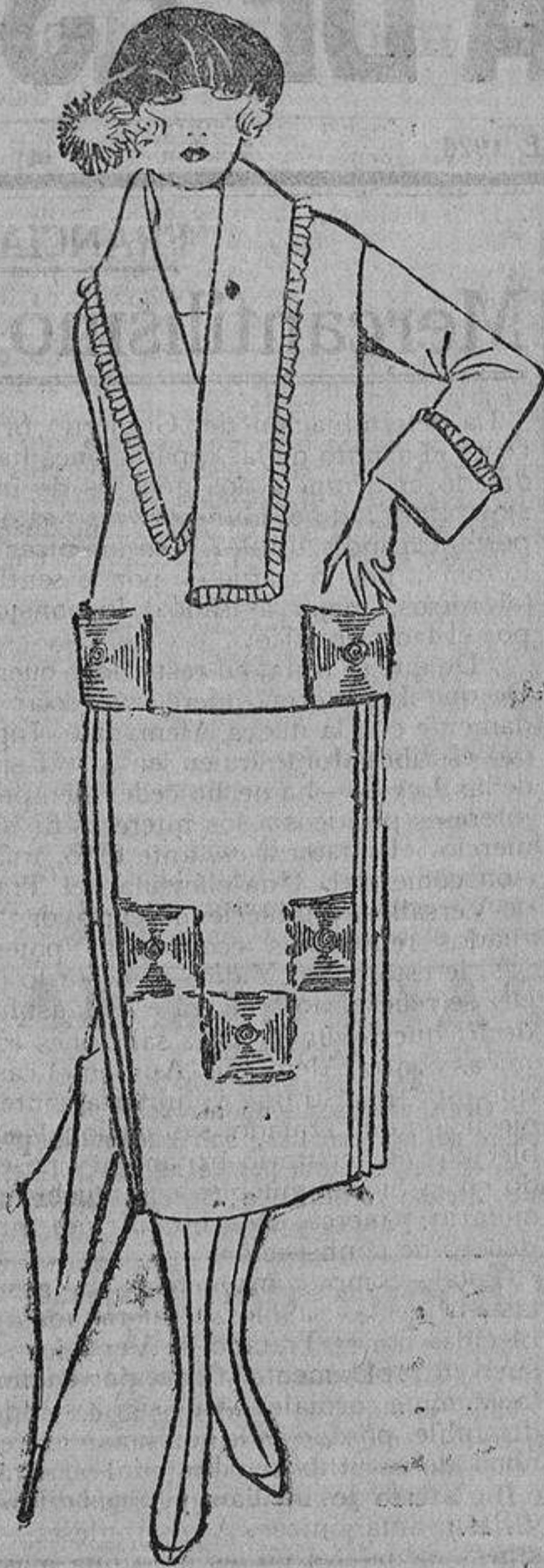
Qué juvenil resulta esta chaquetita recta, que se introduce por la cabeza, en color roña, con bolsillos bordados en negro, falda plisada a los lados y bordados negros en la tabla lisa de delante. Puede repetirse el detalle en la espalda o hacerla toda plisada.

Los trajes sastre se hacen en tejidos oscuro, de preferencia azul marino o marrón, y también con dibujos escoceses en tonos, muy oscuros; a las personas mayores, de pelo gris, les favorece especialmente el gris oscuro y también el gris