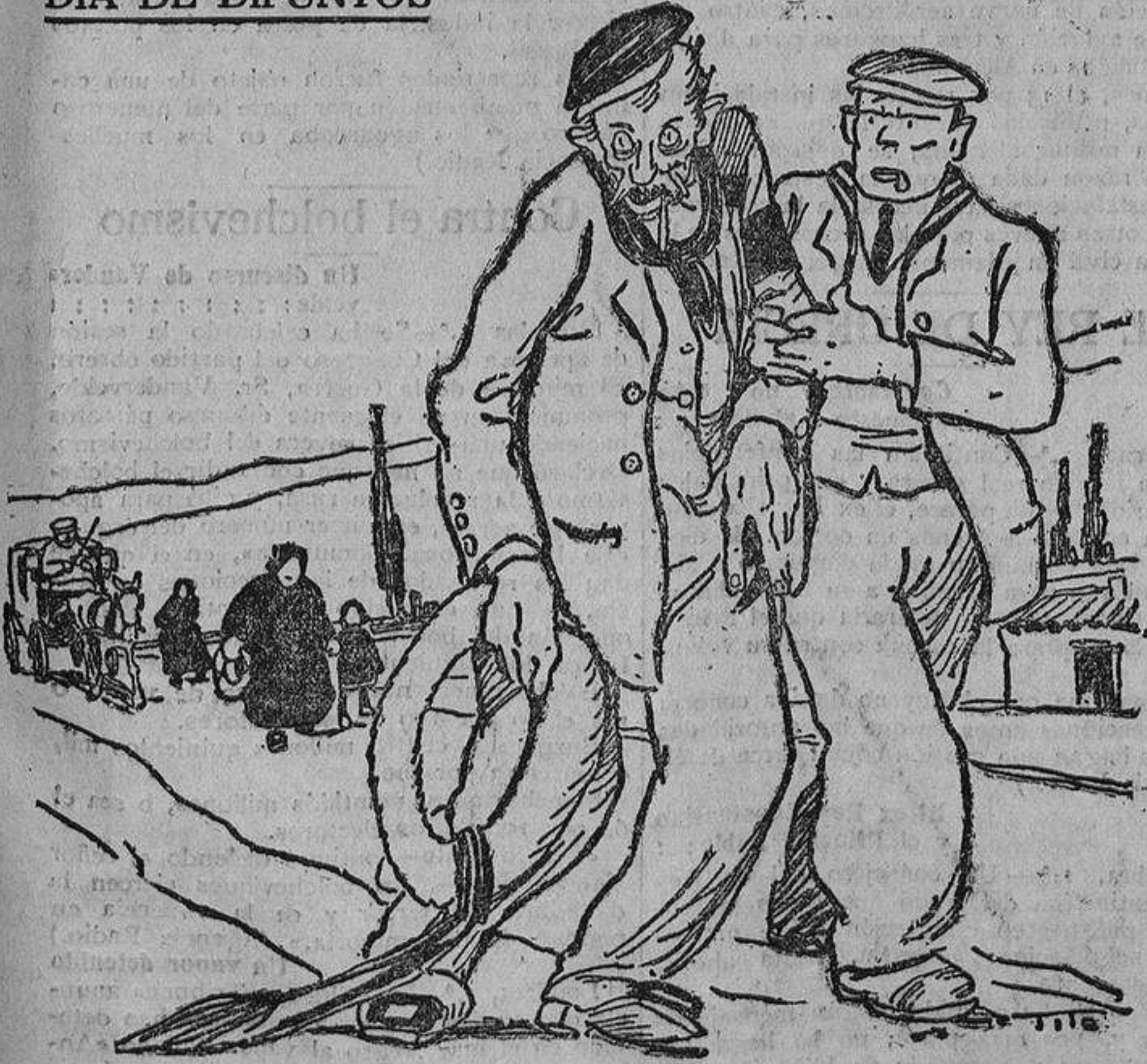
El viudo alegre