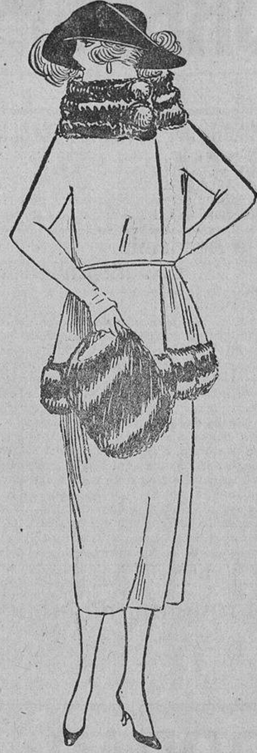
Juvenil, este modelo de gruesa lana azul marino adornado con piel de castor o mongolla desrizada «belge».

cio pomposo con su fotografía, que es bastante linda, y sus millones de dote, diciendo que deseaba casarse con un hombre guapo, formal y sin posición. Con las respuestas y fotografías empapeló su habitación, y a pesar de la condición de belleza requerida, tiene algunos ejemplares más feos que Picio.