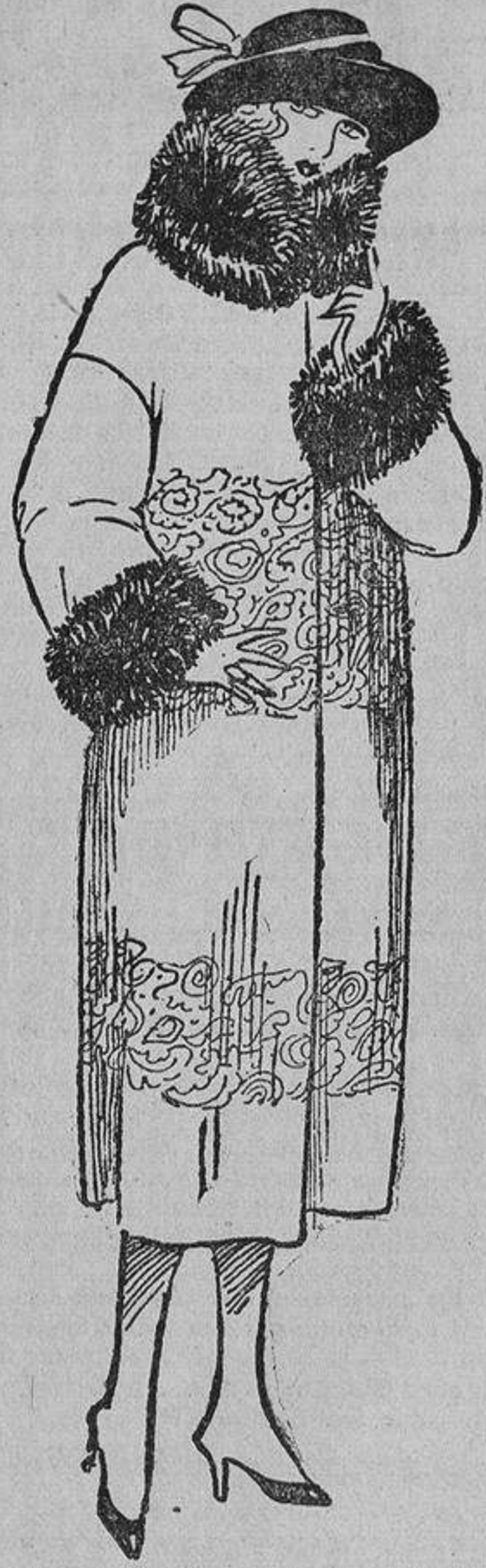
Para que no haga demasiado vistoso, se borda mucho tono sobre tono, como este abrigo recto, para una mujer esbelta.

Otras personas adornan su casa con recuerdos de amigos y con esquelas de defunción, de nacimiento, matrimonio, etc. Una joven americana puso en los principales periódicos neoyorquinos un anun-