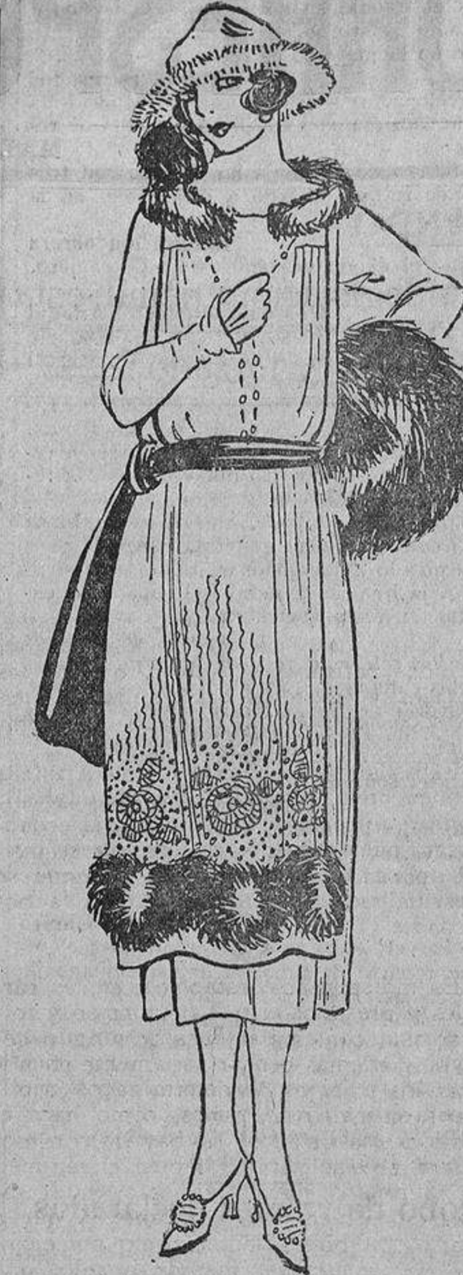
Para la hora del te, este vestido con su delantal, que nace en los hombros y desciende casi hasta el borde de la falda. Raso marino bordado en oro, rojo y verde.

En París, como fantasía, se ven en los escaparates plumas de avestruz rizadas y también teñidas en colores muy vivos; son bonitas, pero menos prácticas que las anteriores.