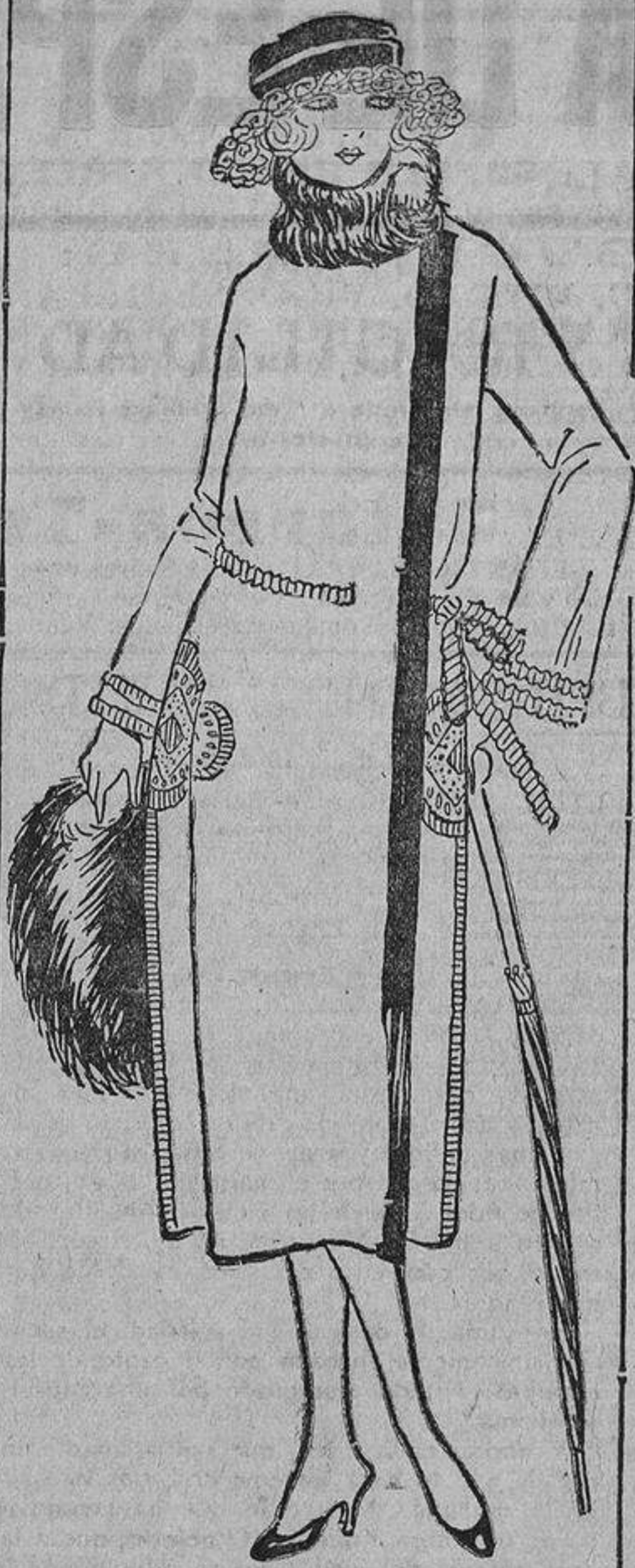
Muy acertado, este abrigo de terciopelo de lana gris, con cuello de mongolla desrizada, bordados y una tira a un lado, de lana azul «nattier».

Encuentro muy decorativas esas plumas de ave teñidas en colores brillantes, acompañadas de un timbre de igual color y que son una nota alegre en un escritorio femenino.