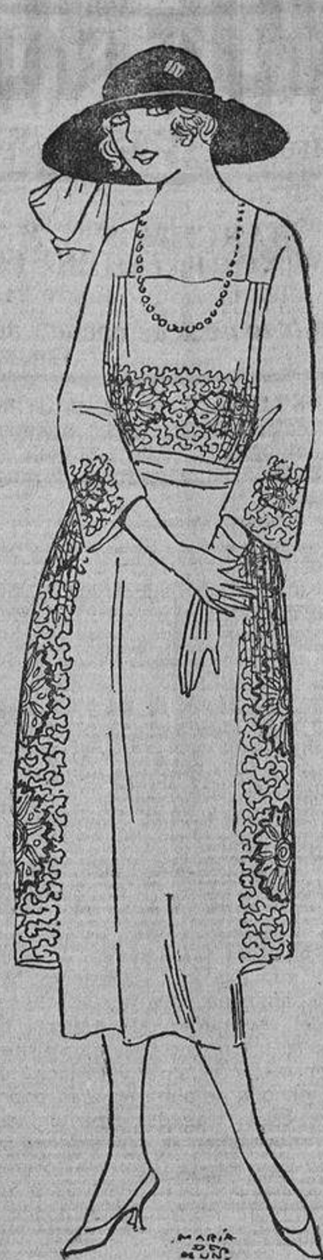
Para visita o teatro este vestido de terciopelo «frisson», de un delicado tono gris de reflejos azules, bordado con cuentas e hilo de acero.