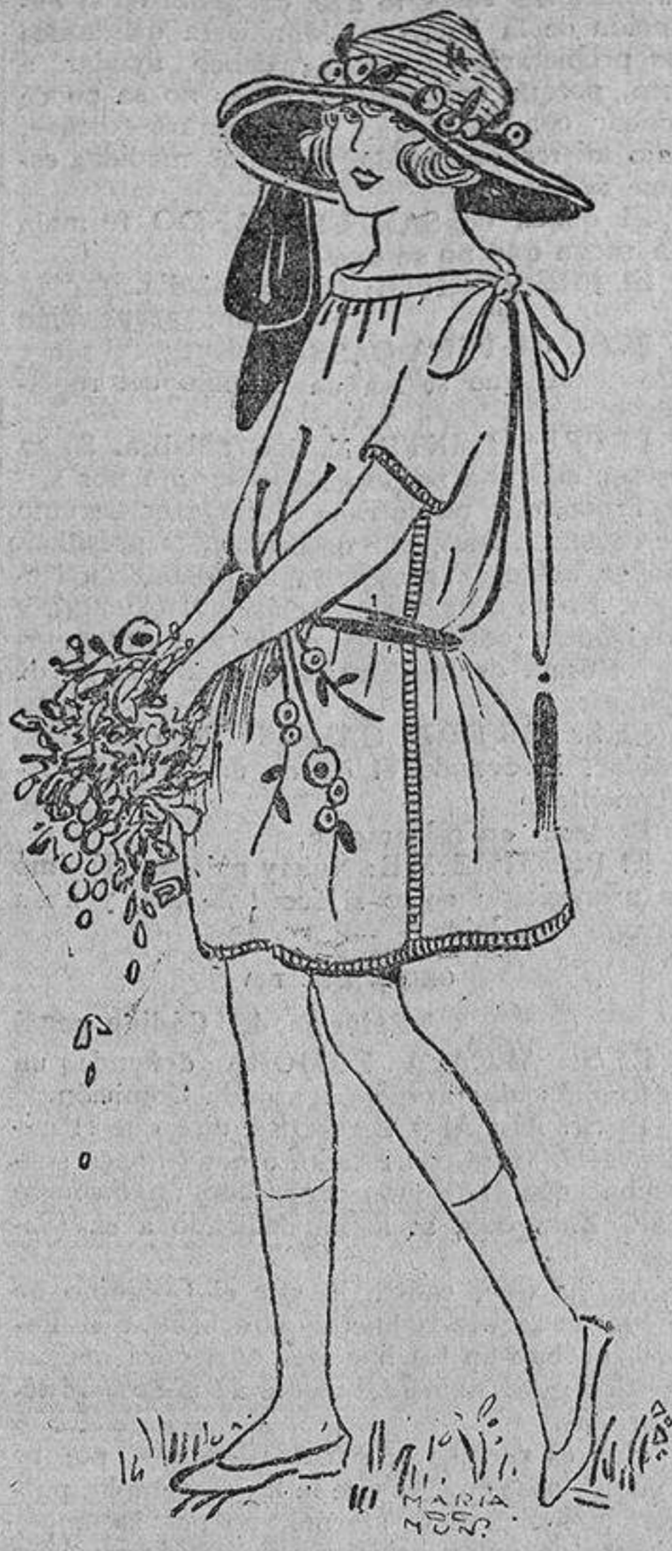
Crespón de lana verde; delante ramas bordadas en negro, flores naranja y rosa. Galón bordado.