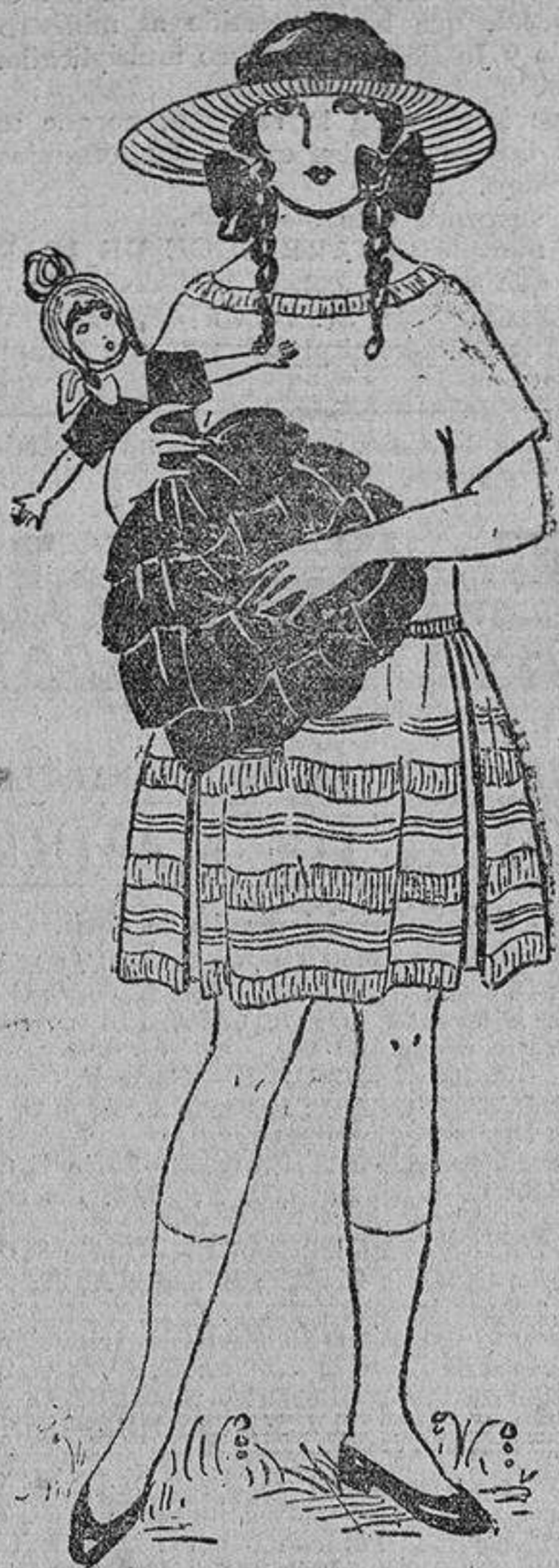
Organdi, linón o crespón de China naranja pálido; la falda, cortada en tres pedazos, dos a los lados y uno delante, adornados con plieguecitos y tiras de la misma tela plegadas.

Es ridículo ver a una joven dedicarse a deportes violentos, compitiendo con los hombres; pierde todo el encanto de su feminidad, que es su arma más eficaz para vencer a los hombres. No se puede reco-