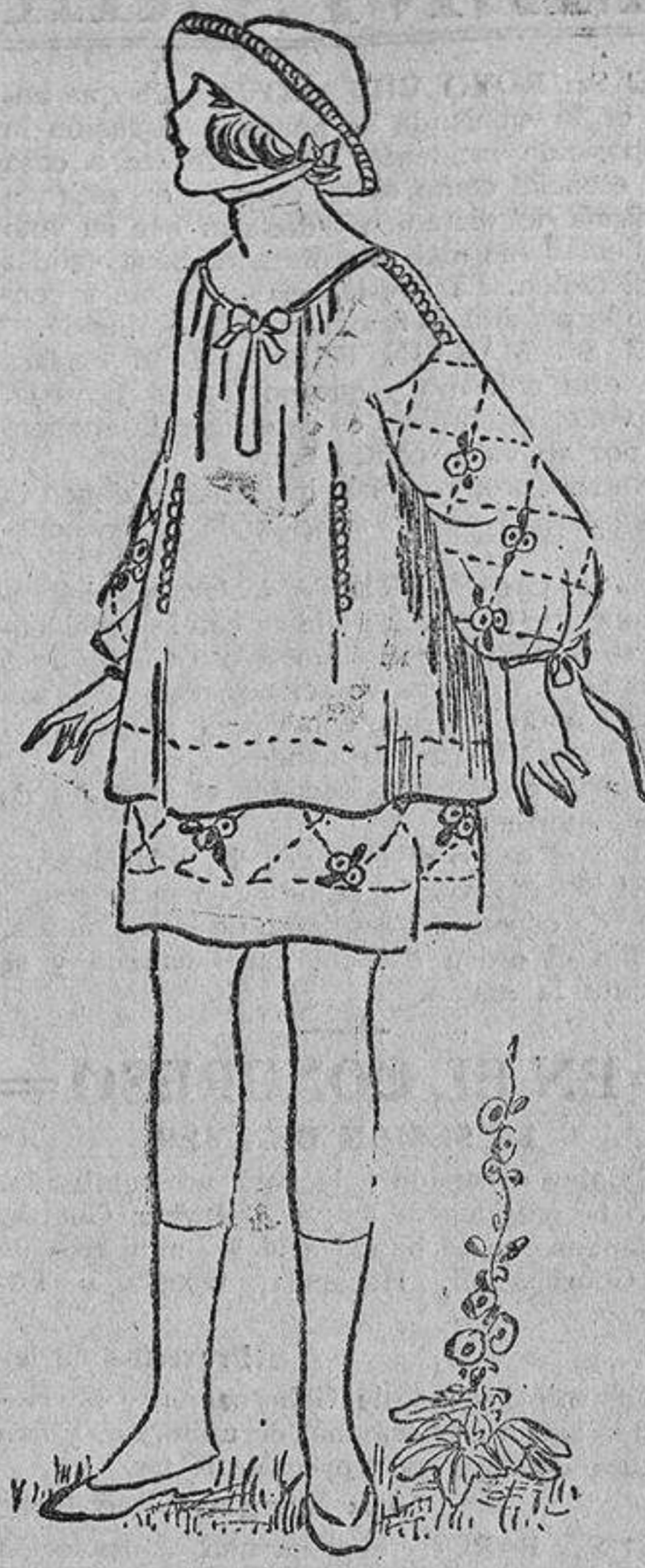
Crespón de lana blanco, pespunte marrón y grupitos de flores de distintos colores.

mandar a ninguna joven que se dedique al boxeo, foot-ball, saltos de altura; entre los deportes los hay que pueden adaptarse a su configuración; todos los ejercicios que enseñan en los gimnasios, carreras pedestres, tennis, juego de pelota, saltar a la cuerda, etc.