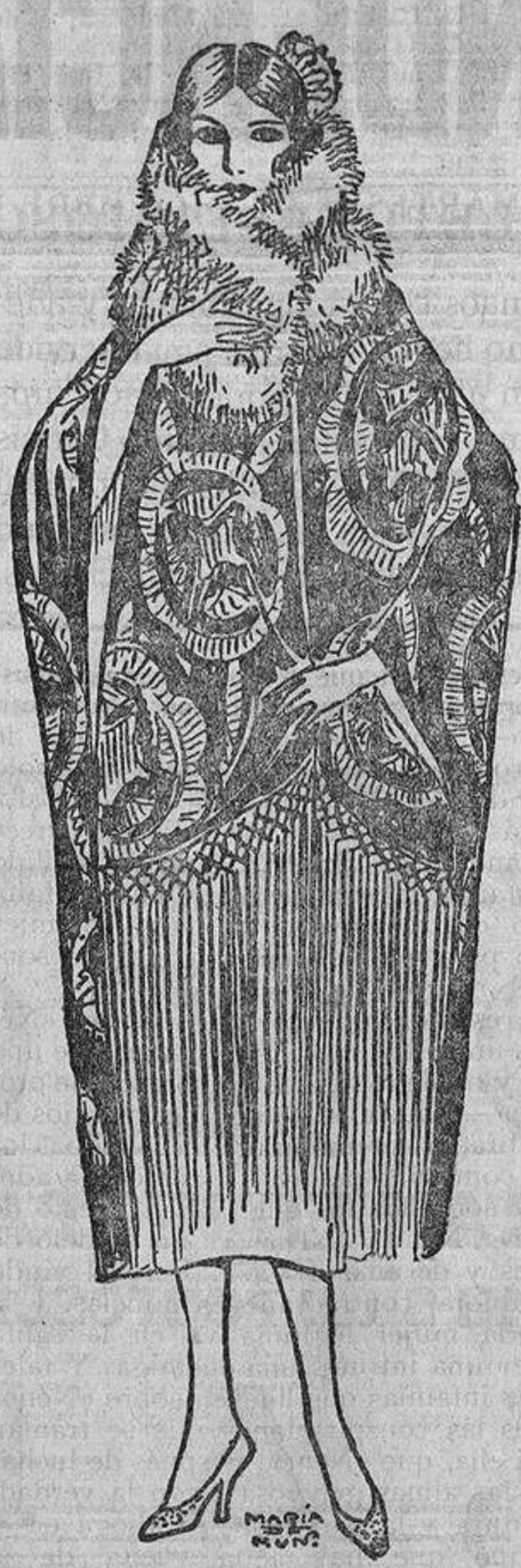
Sale de una cena del Ritz, y parece que vuelve de una verbena, con su «manteau» negro bordado en plata, con ancho fleco en el delantero y forrado de tisú de plata.