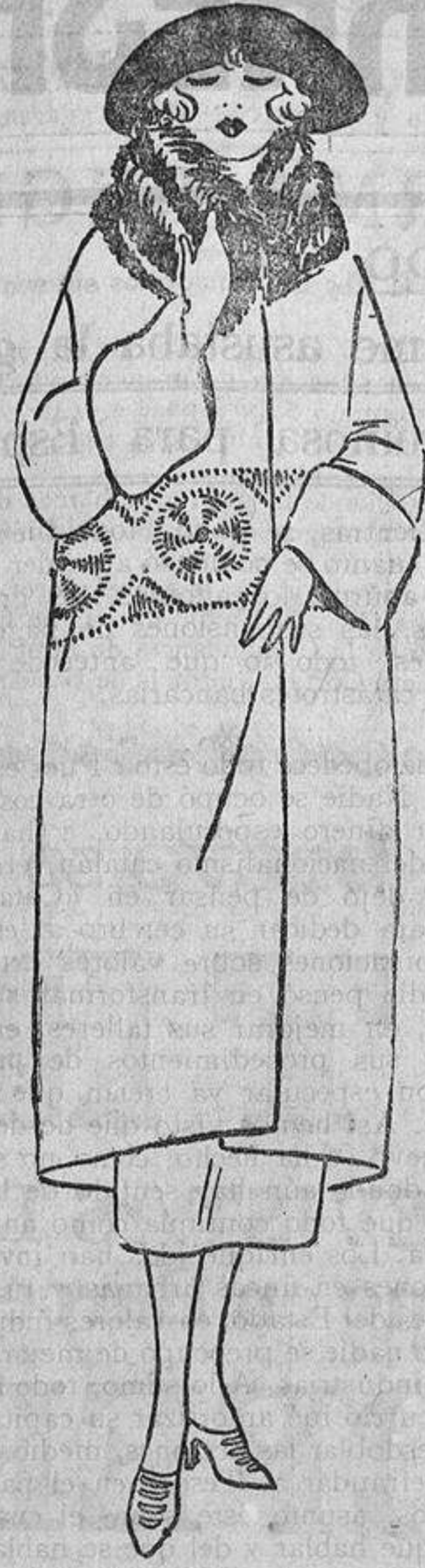
Por la tarde hemos visto envuelto una esbelta rubia, este abrigo recto, de duvetina color roña, con gran cuello de nutria y bordados de azabache.

tos en vez de cohibirnos y paralizar nuestras manos en una postura forzada. Muchas mujeres utilizan el manguito para llevar las menudencias adquiridas en sus visitas a los bazares; es una gran comodidad, pero no exenta de inconvenientes. Como ahora los manguitos no son de grandes dimensiones, en poniendo cualquier paquetero ya no hay sitio para calentar las manos, y además, ¡qué de carterías, pañuelos y cartas se han perdido por confiarlos a este estuche abierto en los dos extremos!