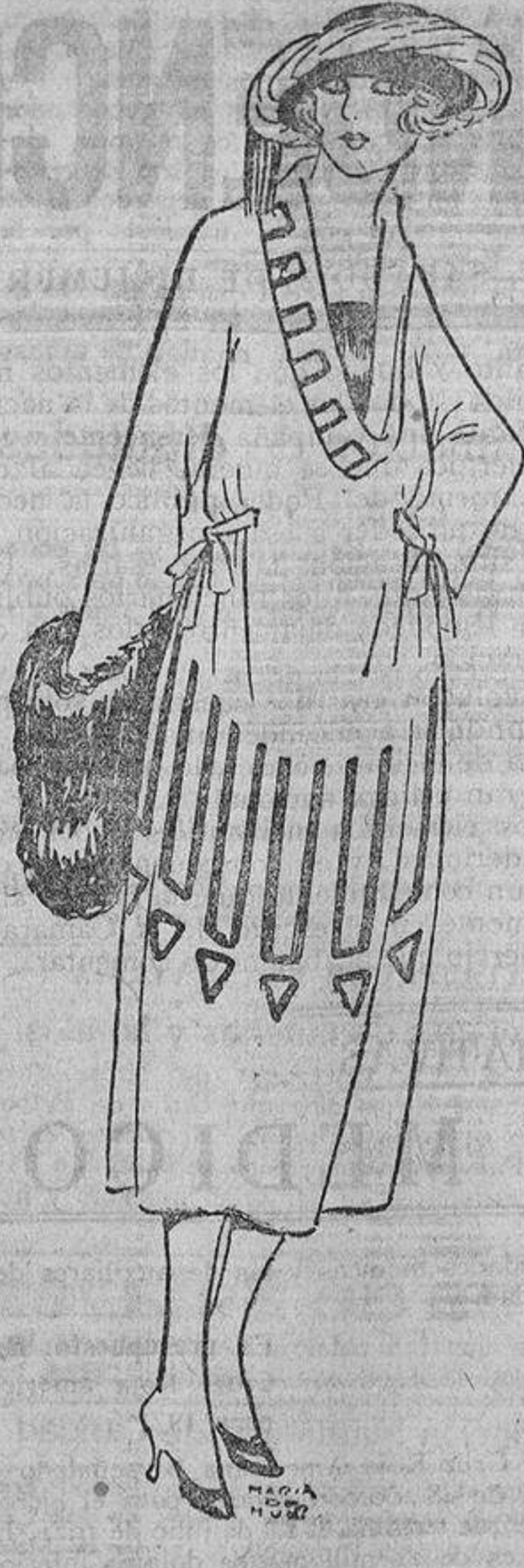
Se fijerean desplazadamente las telas; este adorno está hecho dando unos cortes al paño gris del vestido e introduciendo unos vivos azul «nattier», también de paño.