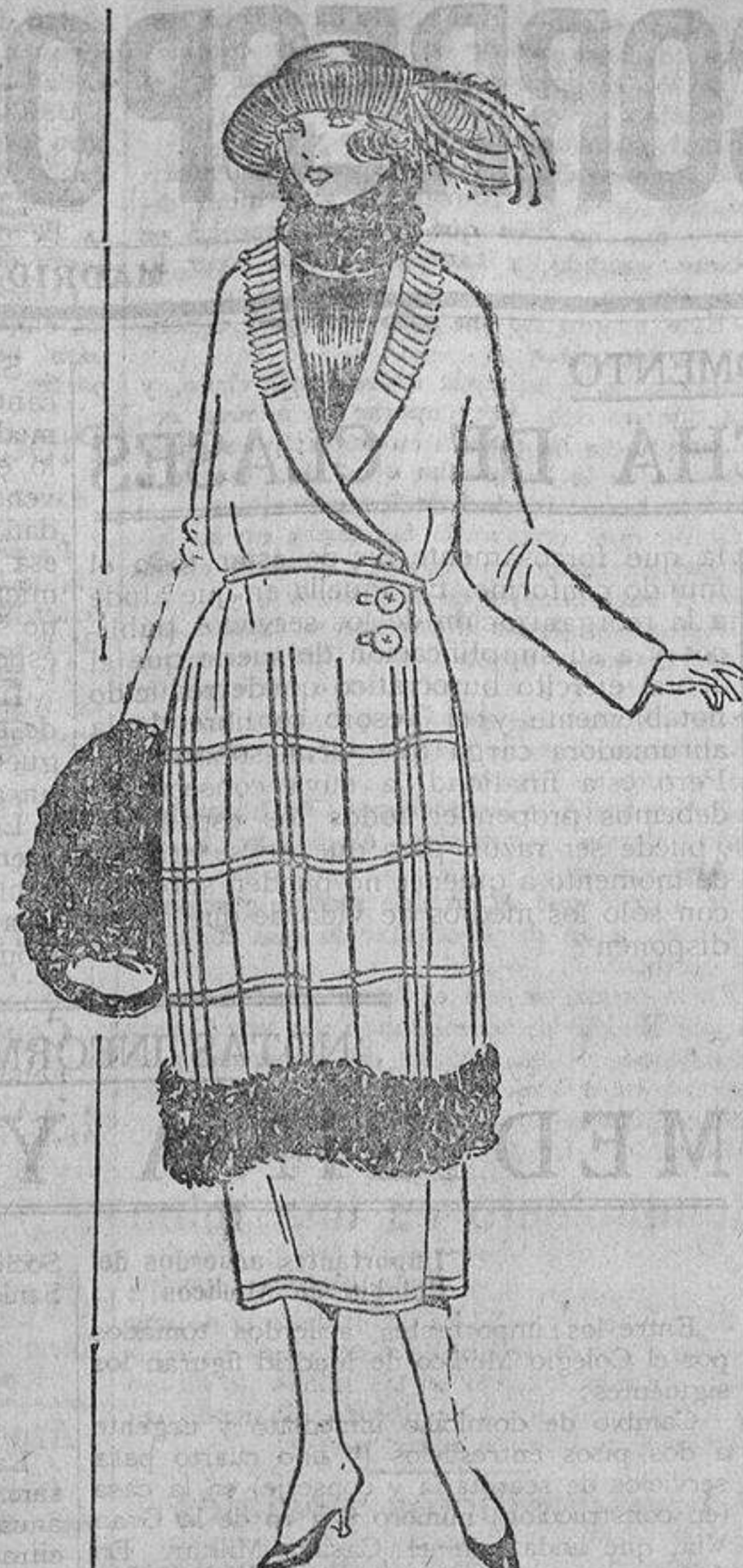
Sobre un terciopelo de lana verde miró, unas tiritas de charol o tela encerada y piel de nutria o de caracul.

en las manos, friccionarlas, agitarlas, frotarlas; pero no las acerquéis al fuego; de vez en cuando, fricciones de alcohol alcanforado.