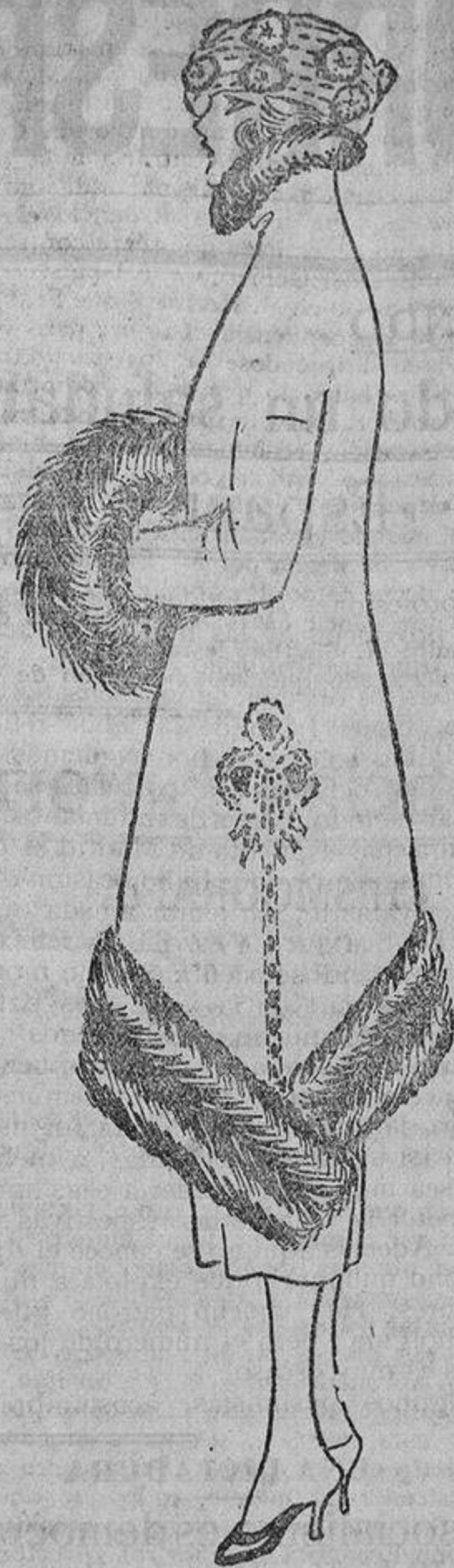
Para una mujer que no le guste ir vestida «como todas», una nueva idea para colocar un zócalo de piel en el borde de un chaquetón.

nitos cachivaches dispuestos por todas partes, para evitar la libre circulación. Una vez se le ocurrió levantarse un poco demasiado rápidamente, para ver una relojera en forma de zapatilla, bordada con pelos y lentejuelas, y descalabró un musiquero, delicado trabajo de marquería de D. Lino, su tío. Bueno; pero ¿a qué estas divagaciones? —me diréis—. Pues vienen para decirnos que, como antes no querían oírnos, podíamos ser unas perfectas pavas sin que nadie se apercebiera de ello. Ahora, ya que se nos escucha, debemos «amueblar» nuestro espíritu.