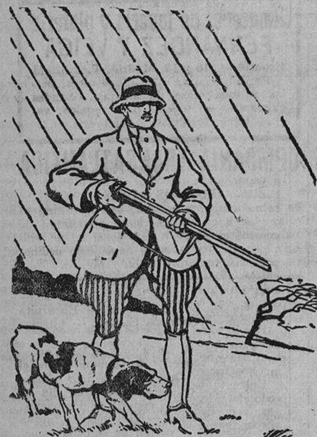
En esos tiempos fríos y húmedos, se ha Ud. resfriado, quiere evitar que esa constipación incómoda degeneren en influenza peligrosas. Algunos comprimidos de Rhodine (Rhoféine) tomados en un poco de agua le permitirán volver a sus negocios y Ud. no sufrirá más.

Emilio Corést Anuncios en general VALVERDE, 8