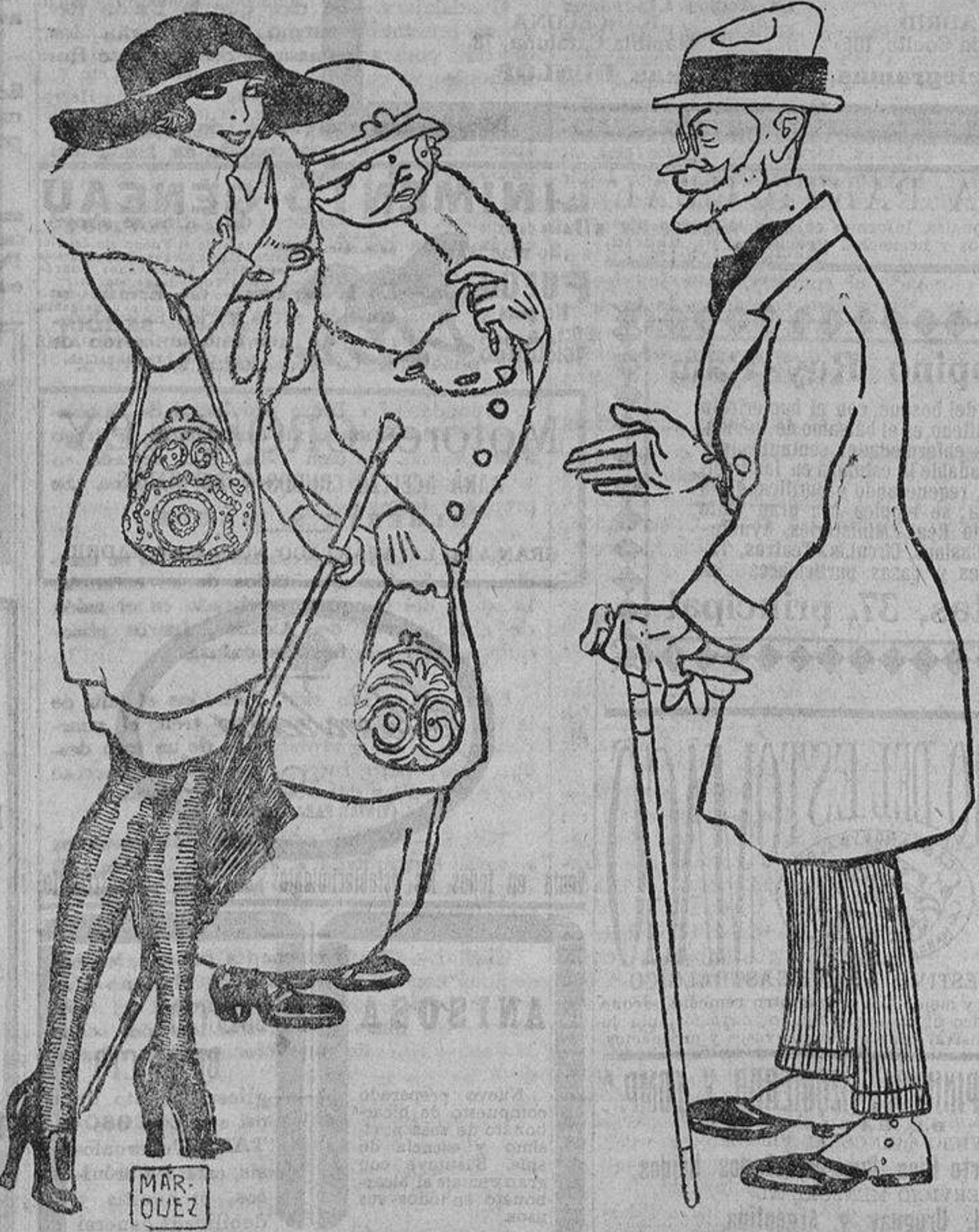
—¿De modo que ésta es la pollita que acaban de poner ustedes de largo?

Como las autoridades no adoptan ninguna medida decisiva no tendrá nada de extraño que el día menos pensado tengamos que presenciar sucesos muy desagradables, pues el vecindario está ya cansado de tolerar tanto abuso.