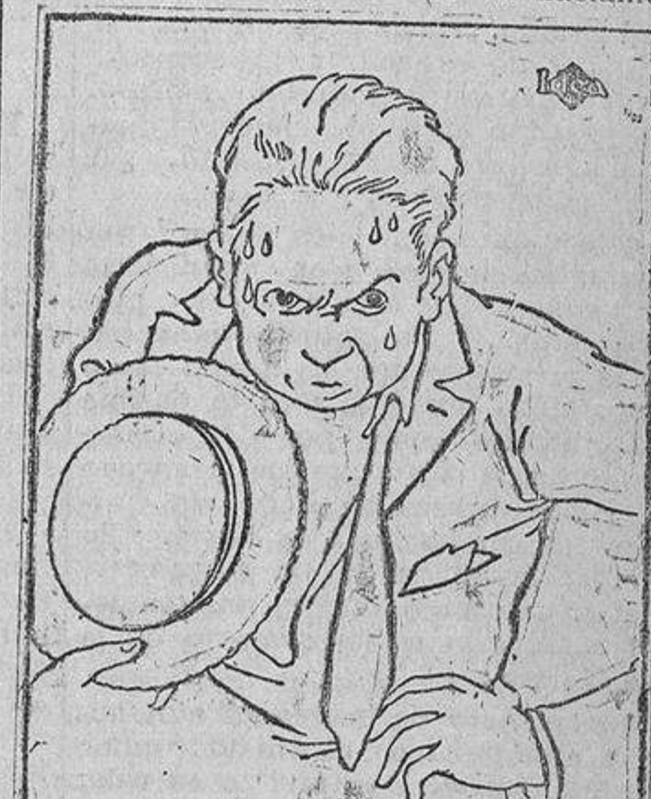
¿Suda usted? Lávese con jabón Heno de Pravja... Pastilla 1,50. Perfumería Gal. Madrid.