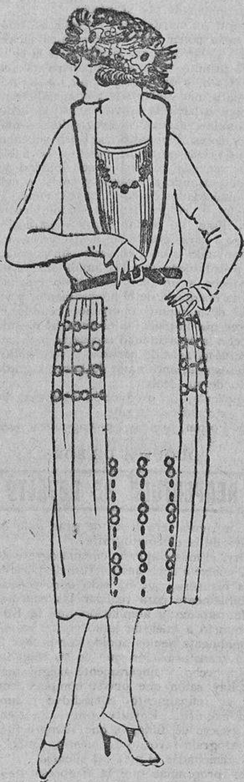
Sobre un traje de fina sarga blanca ribeteado con trenillas negras y cinturón de ante ídem unas anillas negras y unos «pespuntes» de seda también negros.