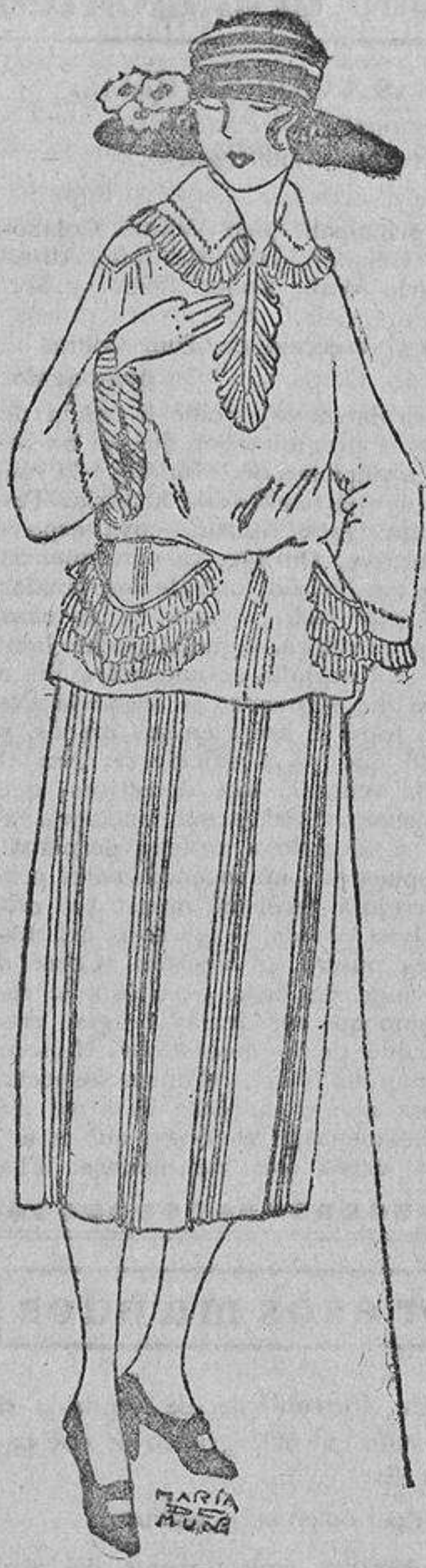
Una blusa linda que puede también formar parte de un vestido completo, de «pongé» canario, adornada con plisés y calados.

La playa de Hendaya es muy grande, y hace el efecto de vacía. Todos los habitantes de Hendaya, más todos los veraneantes