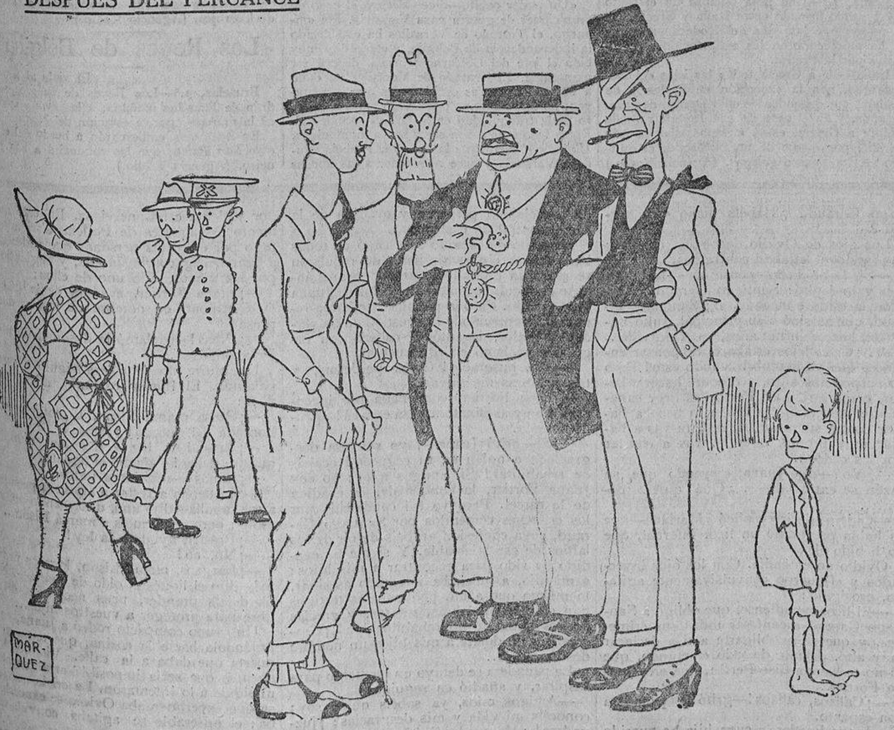
—A éste lo que le perjudicó fué los cinco faroles que dió, sin enmendarse, junto al 8. —¿Y quién le mandó a él meterse a farolero?