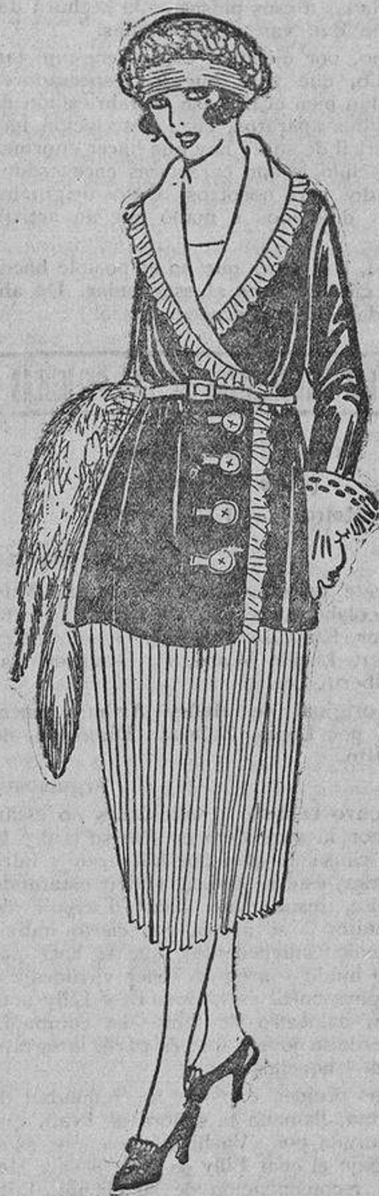
«El uniforme de Teresa» llaman sus amigas a este vestido, porque le ha caído tan en gracia que apenas se lo quita. Se compone de una falda blanca plisada y una chaqueta marino con cuello de organdi, botones nácar y cinturón y ojales de piel blanca.

vamente a la casa donde ejerza trabajos propios de su sexo. Tales debieran ser a grandes rasgos vuestras promesas.