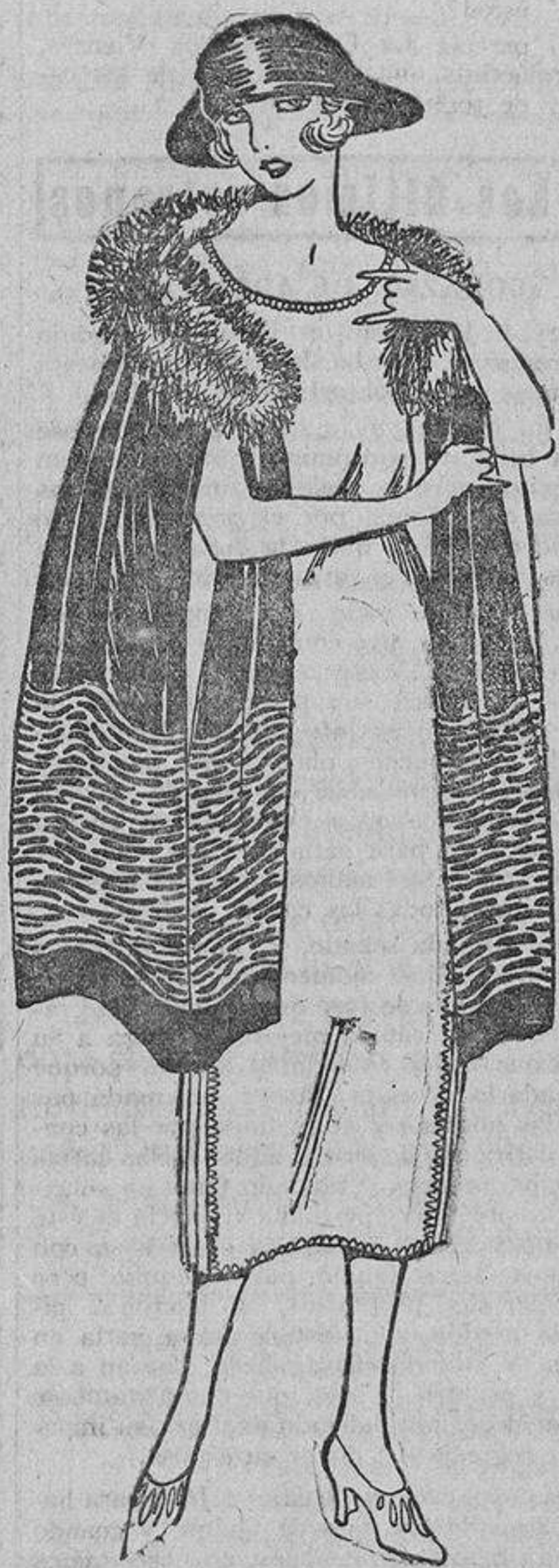
Carolina teme al frío casi más que a un hombre inconstante, y no sale nunca sin un abrigo al brazo; ayer llevaba una capa marrón bordada en «beige» y luego, con piel de lobo en el cuello.

Prohibición absoluta a las mujeres de tener cargos públicos; sustitución de todos los funcionarios mujeres por hombres; destierro inmediato de la mujer en todos los oficios comerciales, industriales, etcétera; relegación de la mujer exclusi-