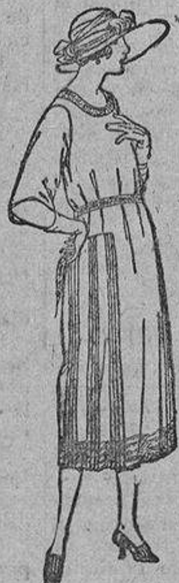
Vestidos de estambre, tricelina, gabardina, etc., en negro, azul y color, adornos bordados. De ptas. 110 a 150.