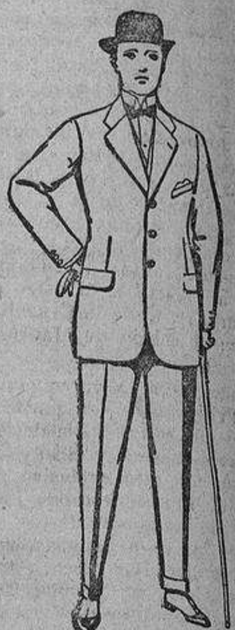
Trajes de cheviot, patén, etcétera. De ptas. 38 a 135