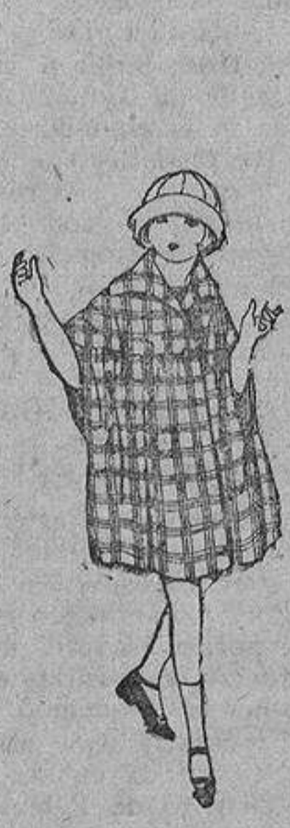
Capas de pañeta, cheviot, etc., diferentes colores y dibujos, para niñas de 4 a 9 años. De ptas. 25 a 58.