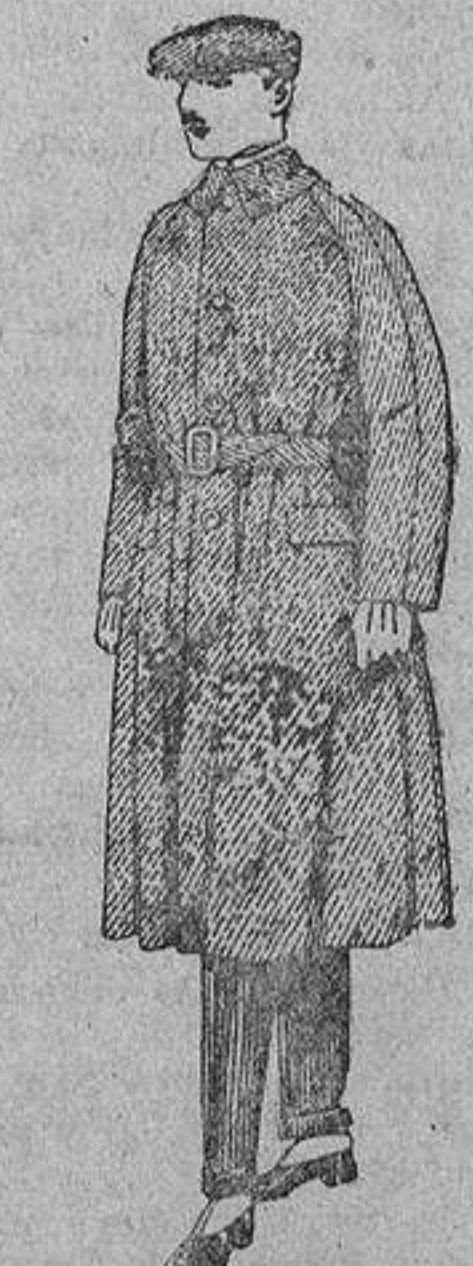
Gabanes de patén, cheviot o cower. De ptas. 90 a 160

Ropas confeccionadas para Caballero, Señora, Niño y Niña