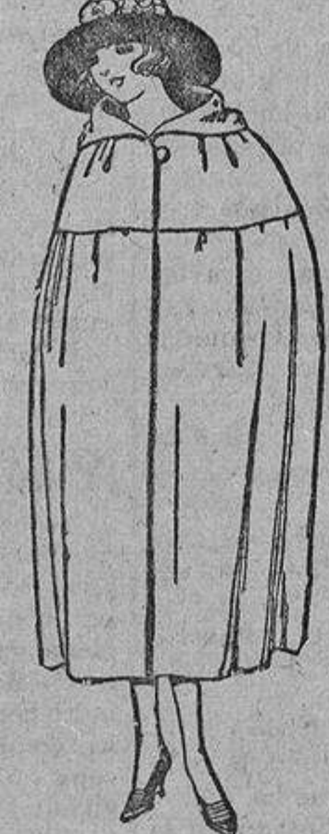
Capas de gabardina, terciopelo, de lana, etc., diferentes colores. De ptas. 100 a 150.