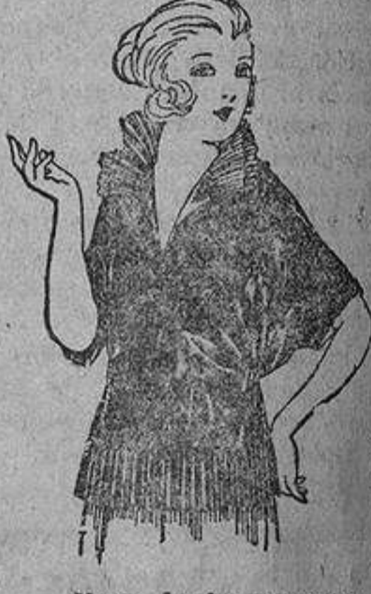
Blusas de charmeuse, granadina, etc., en negro, azul y color. De ptas. 30 a 55.

GENEROS NACIONALES Y EXTRANJEROS PARA PRENDAS A LA MEDIDA