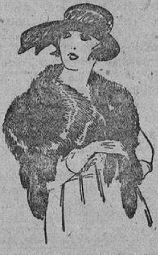
Cuello piel Renardina, en blanco, marrón, gris y negro. De ptas. 18 a 40.