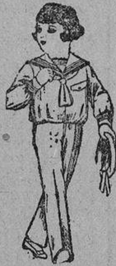
Trajes modelo "marinera", de lana, para niños de tres a nueve años. De ptas. 50 a 60.