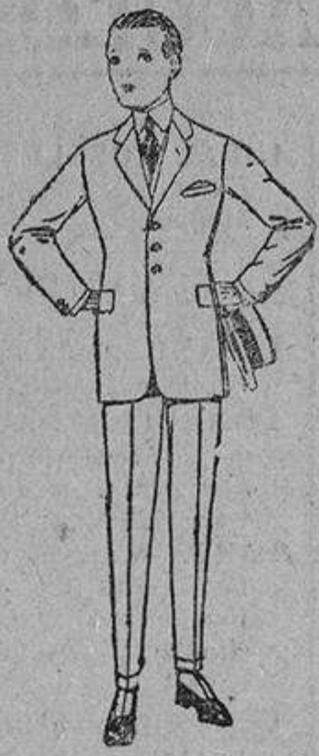
Trajes de lanilla, melton, vicuña, etc. para jóvenes de diez a diez y seis años. De ptas. 39 a 90.