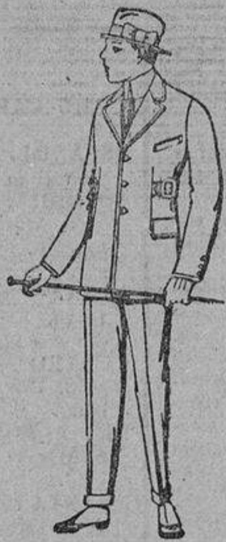
Trajes de patén, vicuña o jerga, etc. forma sport, para niños de diez y seis años. De ptas. 45 a 85.