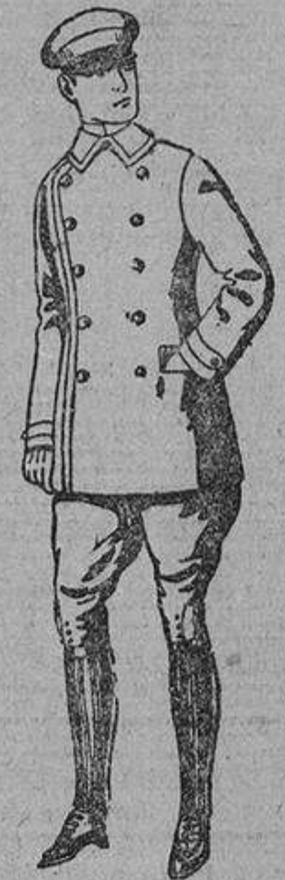
Trajes de uniforme para "chauffeurs", con pantalón breches. De ptas. 145.

Peletería, Géneros de punto, Camisería, Corbatería, Guantería, Artículos para viaje, Sombrerería, Zapatería, Bastones y Paraguas.