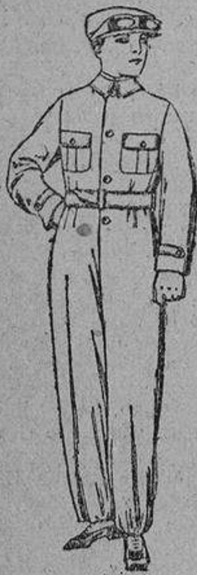
Trajes de drill, azul, beige, caqui, etc. para aviadadores, motociclistas, mecánicos, etc. De ptas. 40.