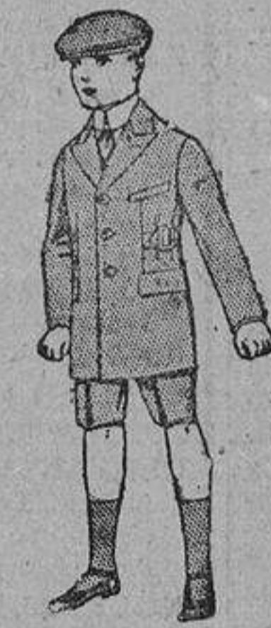
Trajes de lanilla, modelo inglés, para niños de cuatro a nueve años. De ptas. 35 a 55.