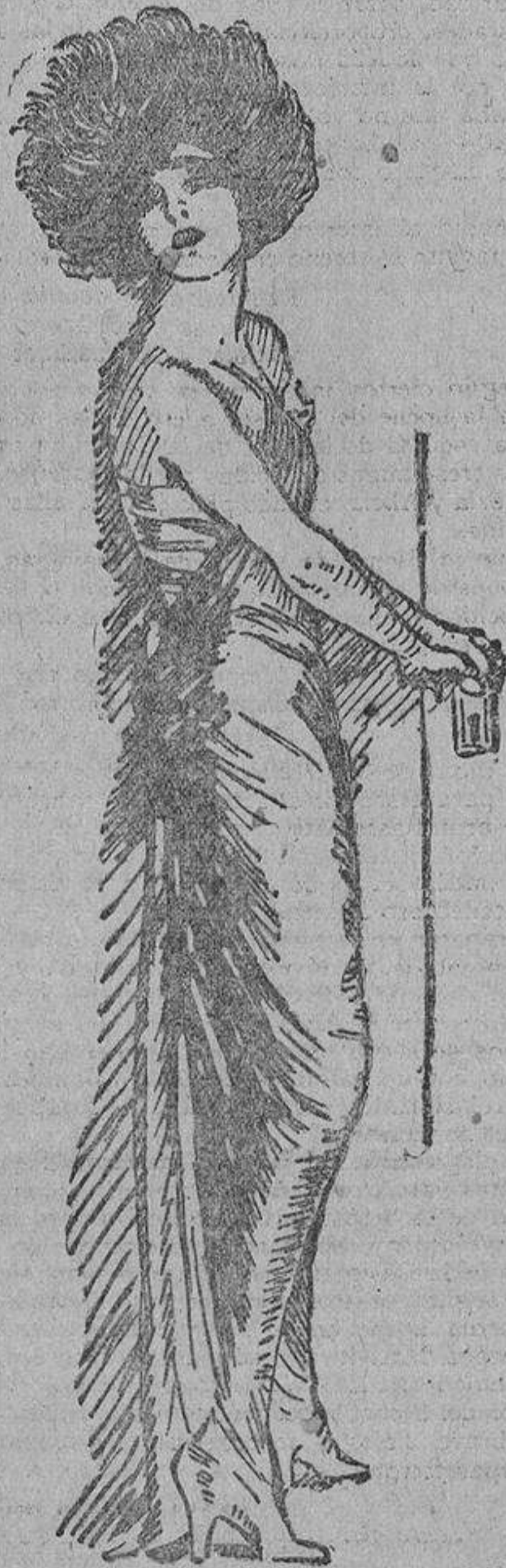
La gran artista dramática, de una intensidad de expresión admirable, es una mujer espléndida, de una pureza de líneas y de una belleza de rostro que seduce. Siempre están en noble pugilato su arte y su belleza, y siempre triunfa Nazimova.