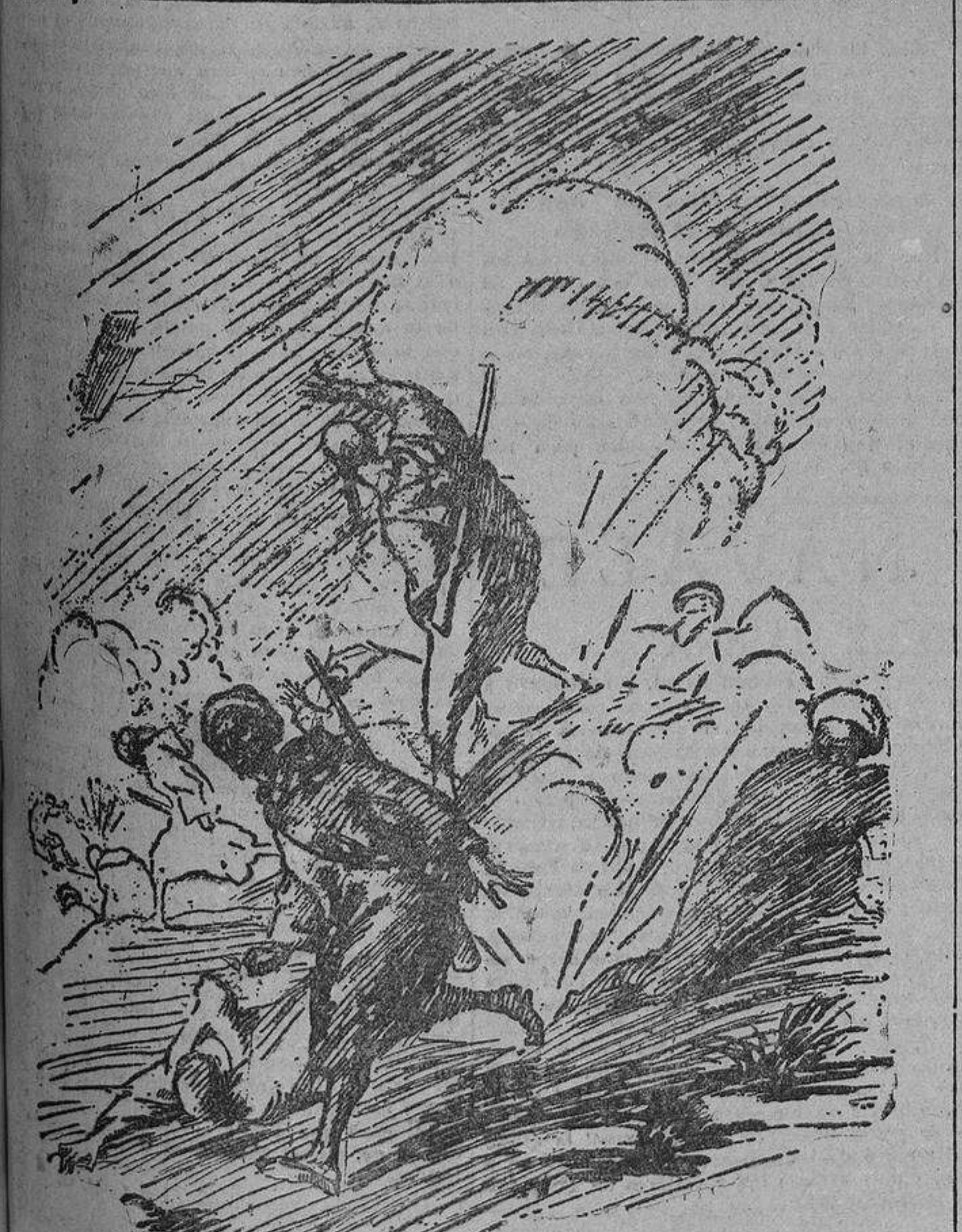
Un aeroplano bombardea las posiciones enemigas