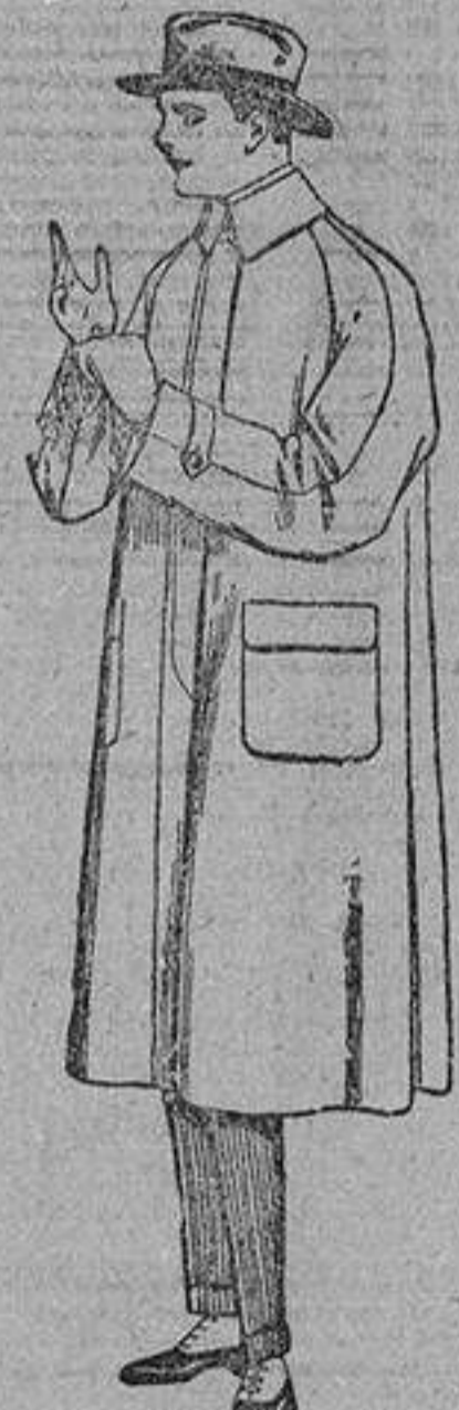
Impermeables ranglón en varios colores. De ptas. 45 a 150.