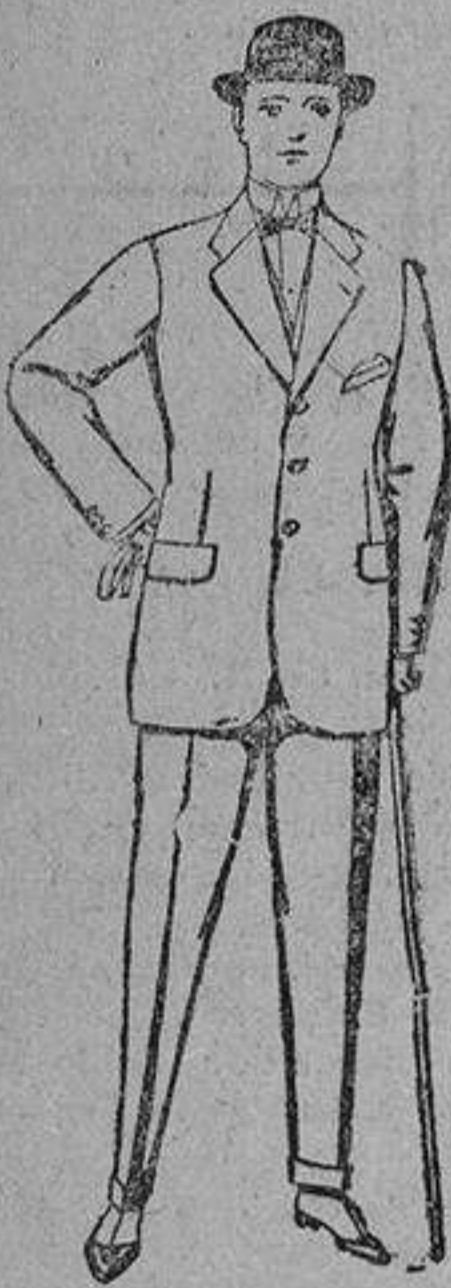
Trajes de lanilla y esparto. De ptas. 55 a 150.

Grandes surtidos de colores y calidades en todos modelos.