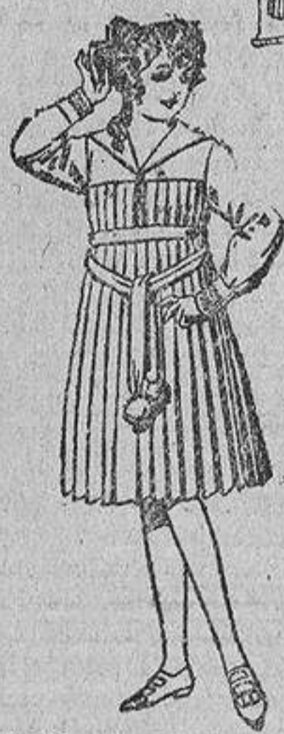
Vestidos de estambre, azul y color, adornos bordados, para jovencitas de 12 a 15 años. De ptas. 46 a 50.