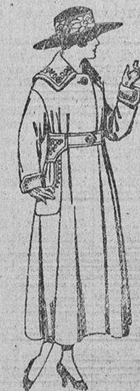
Abrigos de gabardina, paño, etc., en azul y color, bordados. De ptas. 75 a 95.

Ropas confeccionadas para Caballero, Señora y Niños.