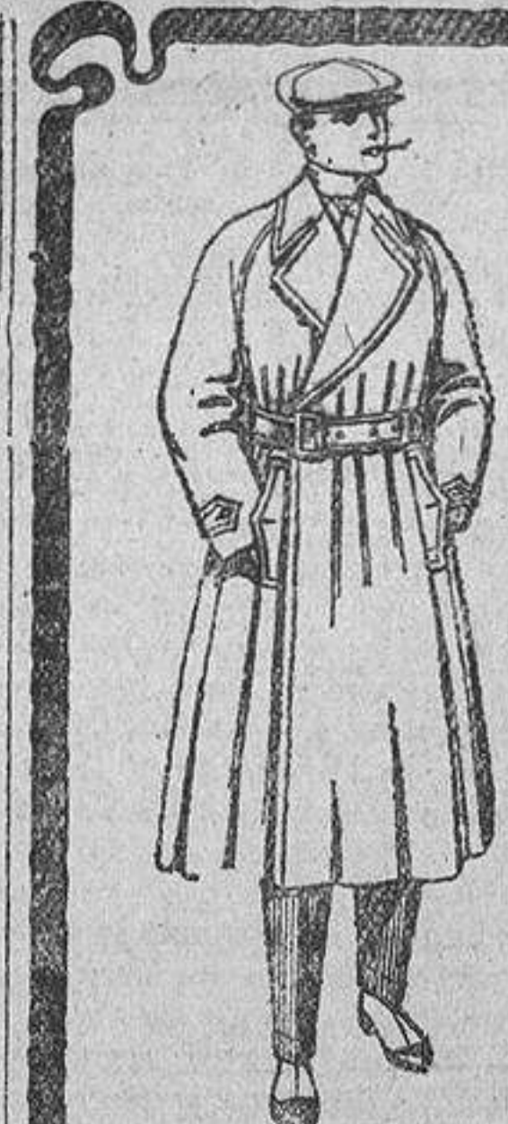
Gabanes impermeabilizados, con cinturón, diferentes colores. De ptas. 43 a 115.