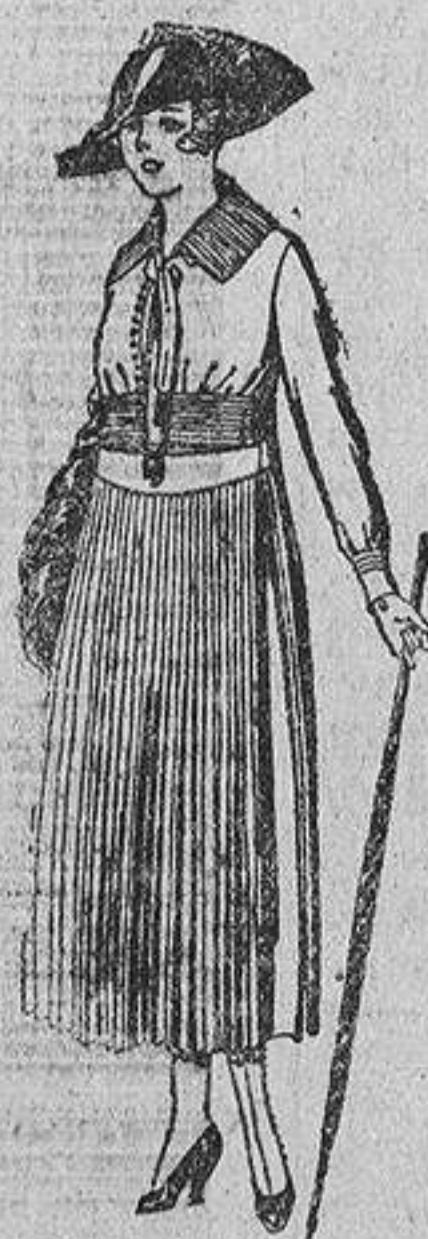
Vestidos de sarga inglesa, en negro, azul y color. De ptas. 72 a 85.