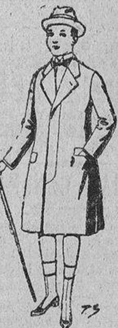
Gabanes de patén, para niños de 10 a 12 años. De ptas. 15 a 25.