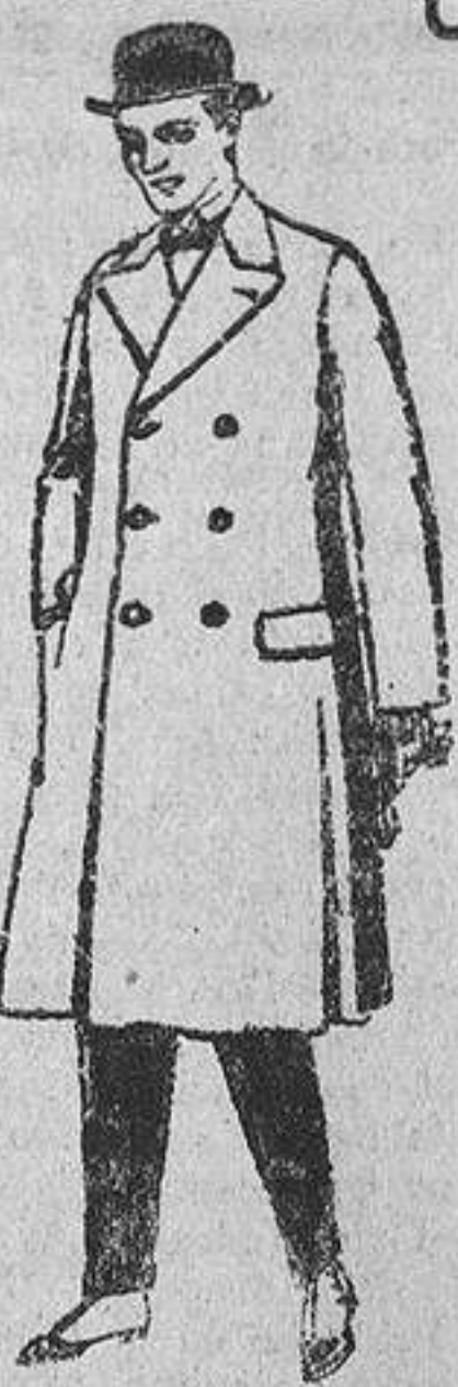
Gabanes de patén, gamma o lower. De ptas. 50 a 110.