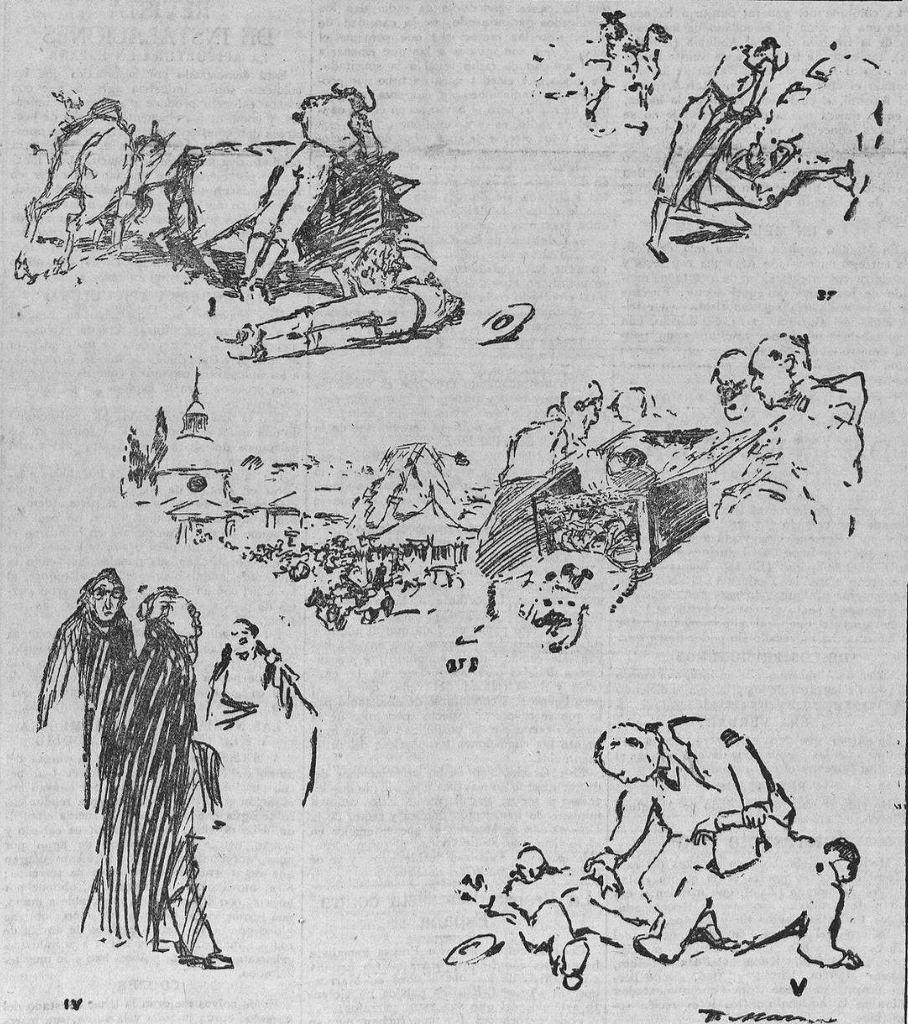
LO QUE VIERON LOS «ISIDROS», ESTE AÑO En los toros: Un quite «macho» de Chicuelo y un quite hembra «de delantals» de Marçal.—El día clásico: La pradera. Y los sagrados restos del santo.—La clásica capa de la Tuna portuguesa.—Y pudieron ver: Cómo en el templo de la lamunidad parlamentaria no «estar» ésta muy segura para los padres de la patria.