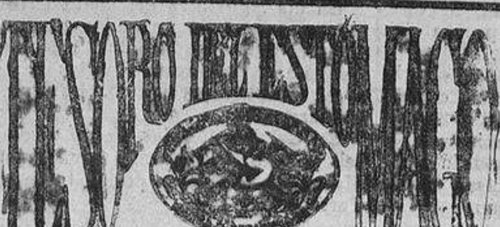
TÓNICO-DIGESTIVO Y ANTIGASTRÁLGICO

CONTRA INCENDIOS DE CASAS EXTRAMUROS DE MADRID Y SU PROVINCIA Oficinas: Sevilla, 16, tercero, Madrid. La Junta de gobierno de esta Sociedad ha acordado el cobro de un dividendo pasivo de cincuenta céntimos por cada mil pesetas de capital asegurado. Los señores socios podrán hacer efectivas sus cuotas en las oficinas de la Sociedad todos los días laborables, de diez de la mañana a dos de la tarde, y en el plazo de treinta días, a partir del 20 del mes actual. Madrid, 18 de mayo de 1922.—Por la Junta de gobierno, el Tesorero, P. Ramón Sáez.