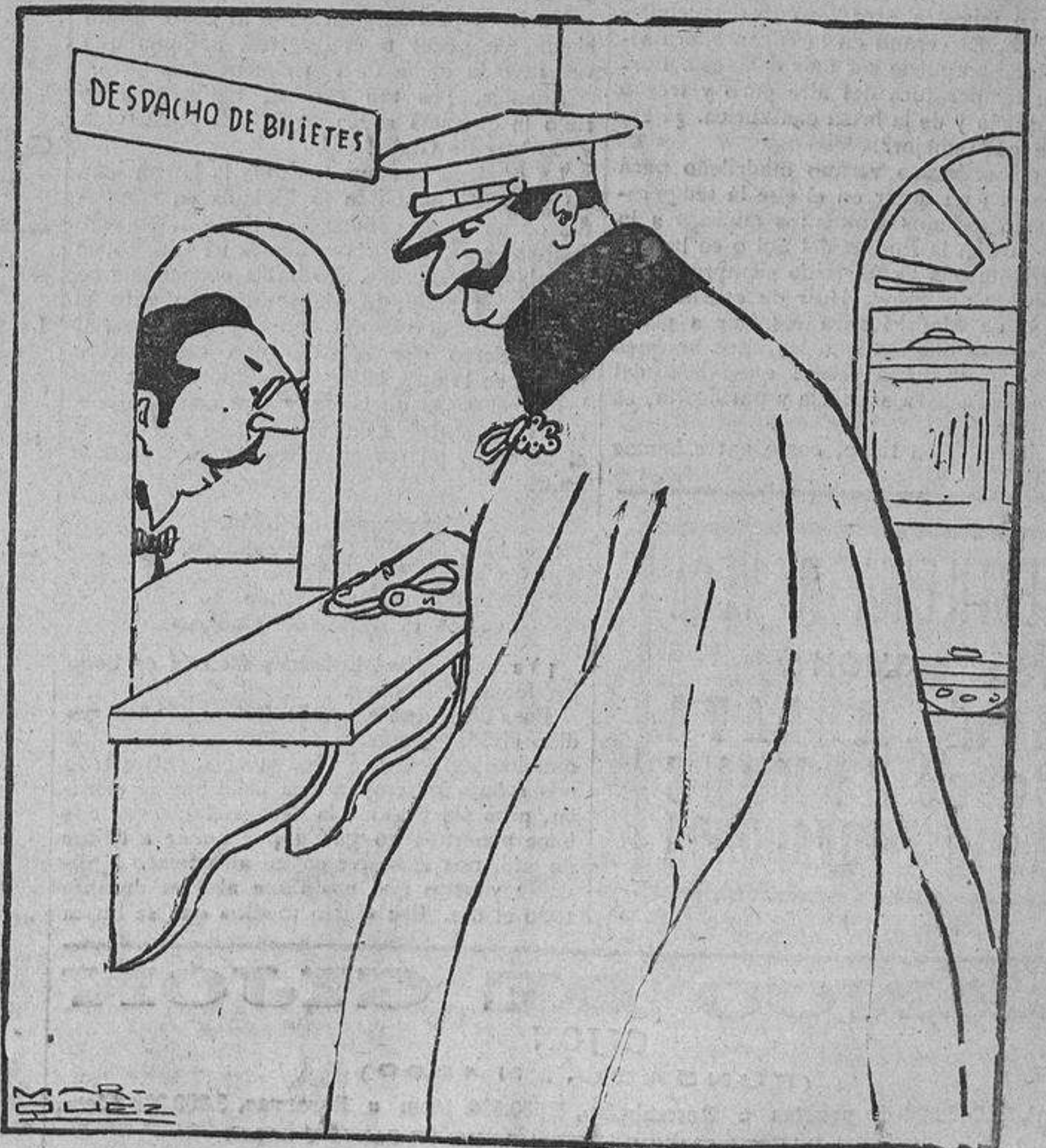
—¿De ida y vuelta, como siempre? —No; esta vez de ida solamente.